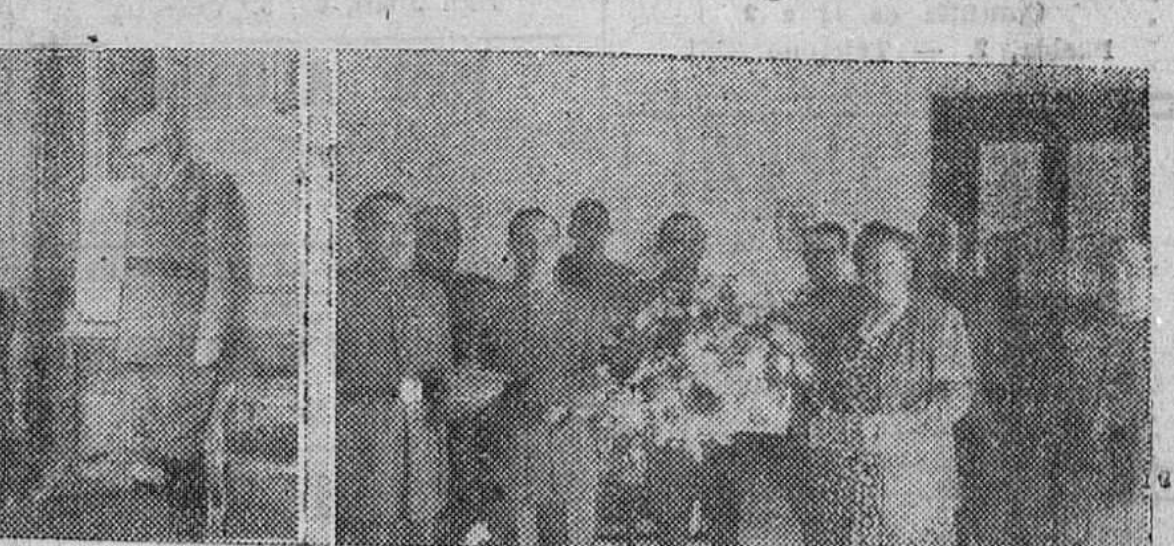
Dos momentos del homenaje tributado ayer por los suboficiales y C. A. S. E. de la región al teniente general Yagüe.

Protesta de nuestro Rvdmo. Prelado por la condena dictada contra Monseñor Stepinac