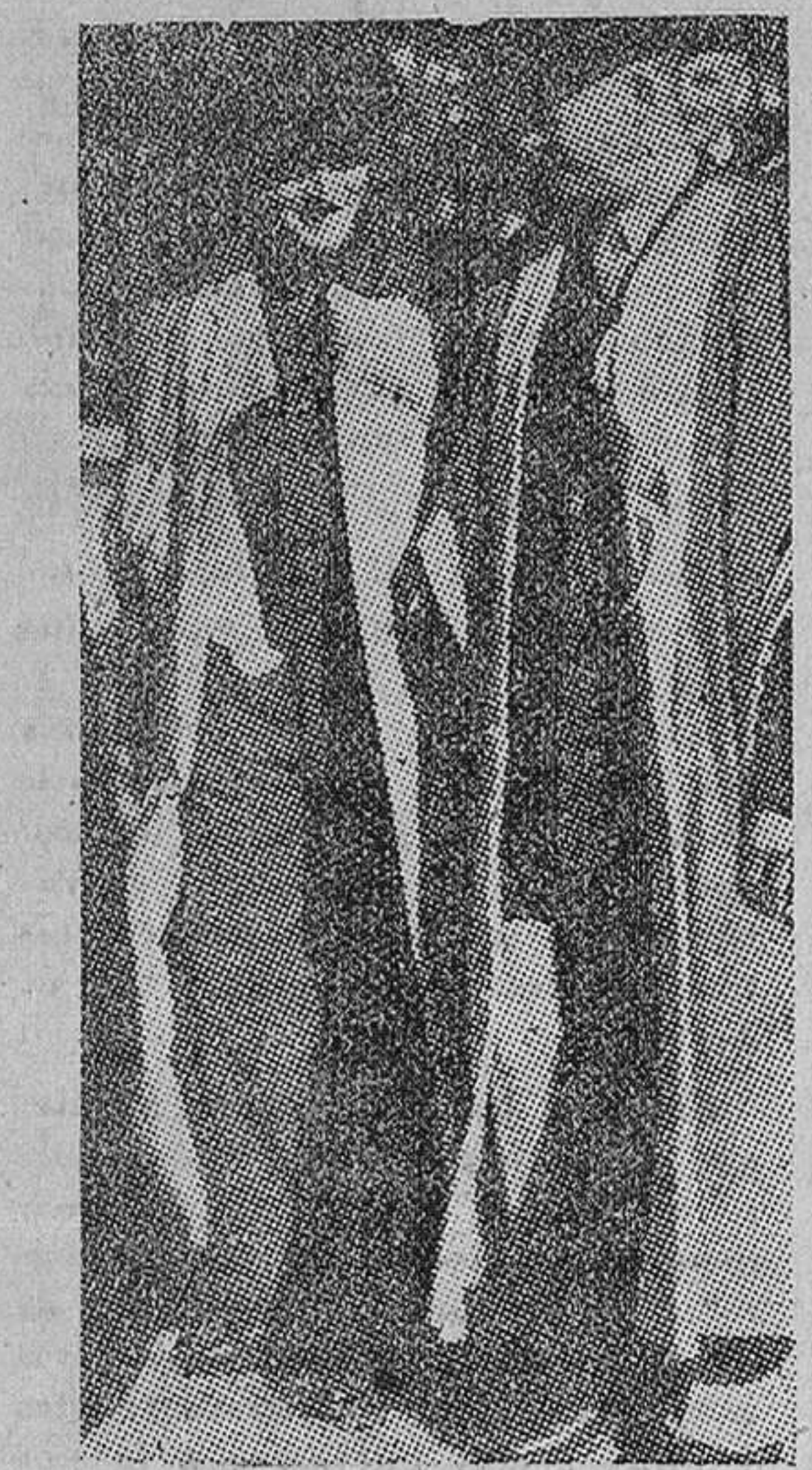
Londres. -- Los dos grandes militares vistos cuando se dirigen al Senado en la Universidad de Cambridge, durante la sesión celebrada el pasado día 11 y en la que les fueron concedidos dichos títulos honoríficos.