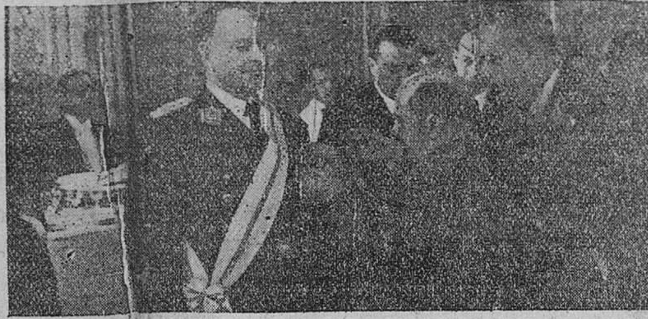
Madrid.—El ministro del Ejército, General Dávila, impone al general argentino D. Estanislao López, la gran Cruz del Mérito Militar, con distintivo blanco que le ha concedido el Caudillo, en el acto de despedida de la misión argentina, celebrado en el Ministerio del Ejército