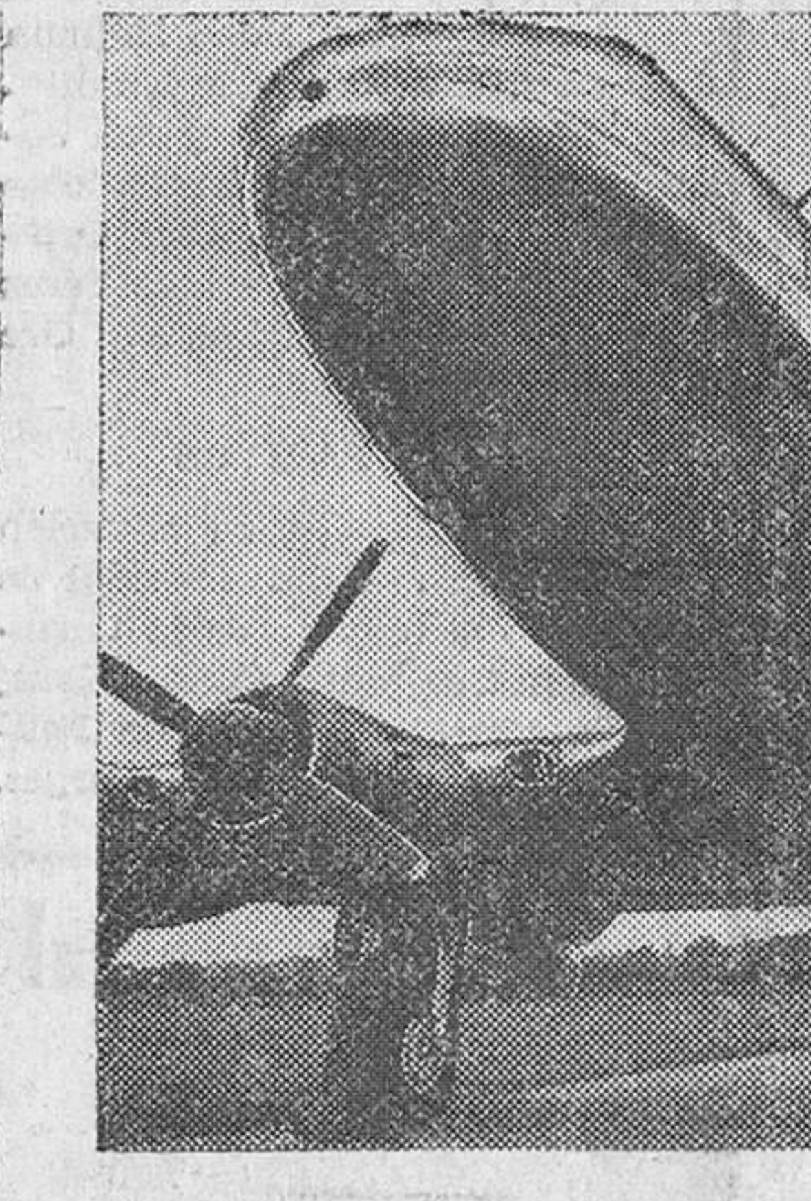
El nuevo aeroplano gigantesco "Hermes Hastings", de cuatro motores, con una velocidad de crucero de 480 kilómetros a la hora, que puede transportar entre 34 y 50 pasajeros