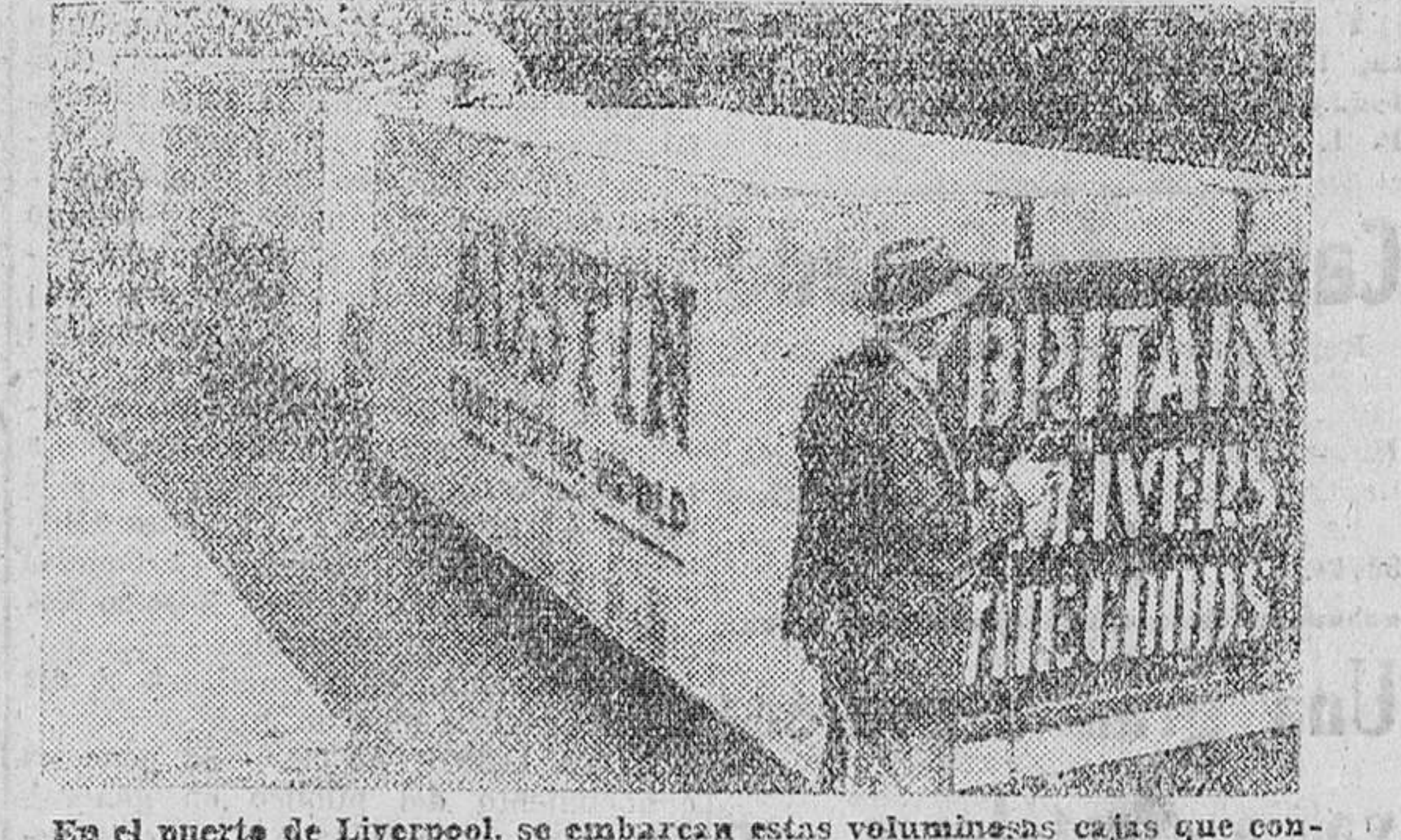
En el puerto de Liverpool, se embarcan estos voluminosos cajas que contienen accesorios para automóviles...