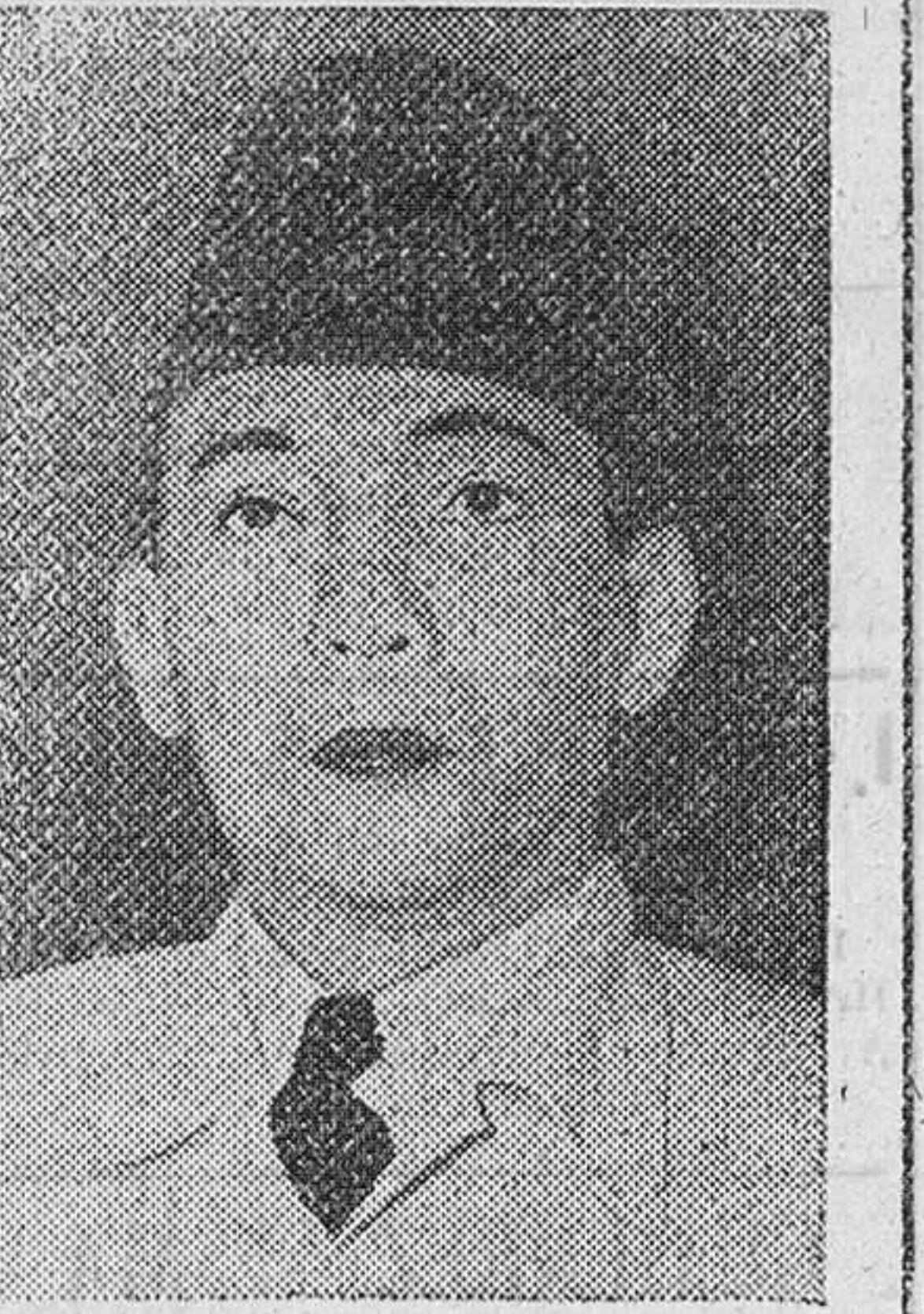
EL PRESIDENTE SUKARNO

Despidieron al cardenal los embajadores chilenos cerca de la Santa Sede y del Gobierno italiano y personal de ambas embajadas.