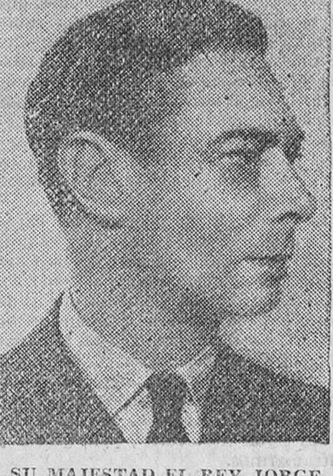
SU MAJESTAD EL REY JORGE

He aquí reflejado, uno de los magníficos ejemplos de la arquitectura británica de la post-guerra. El edificio en cuestión pertenece a un gran hospital de niños situado en Londres.