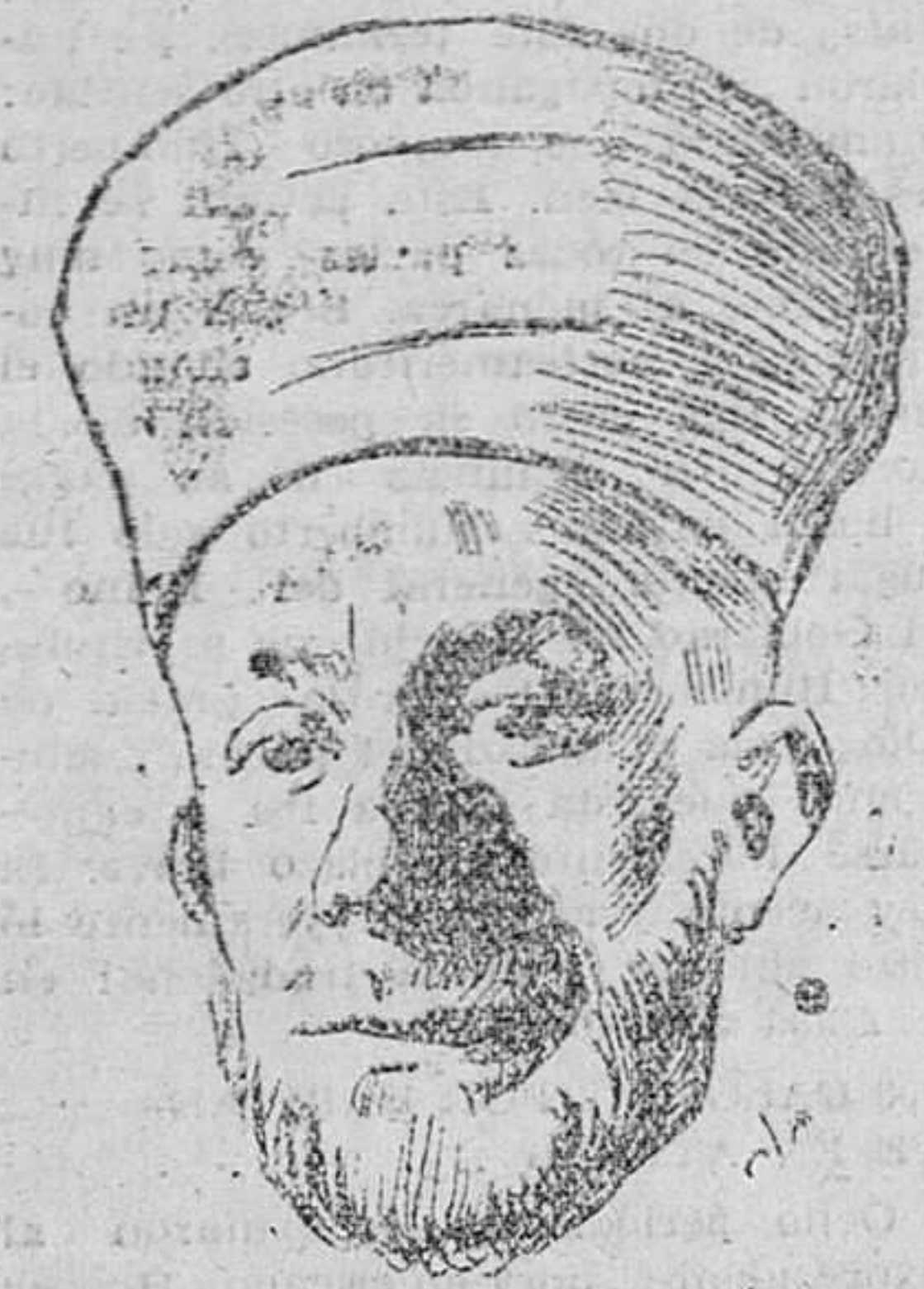
El Gran Mufti de Jerusalén ha salido clandestinamente de Francia...

EL GRAN MUFTI de Jerusalén ha salido clandestinamente de Francia