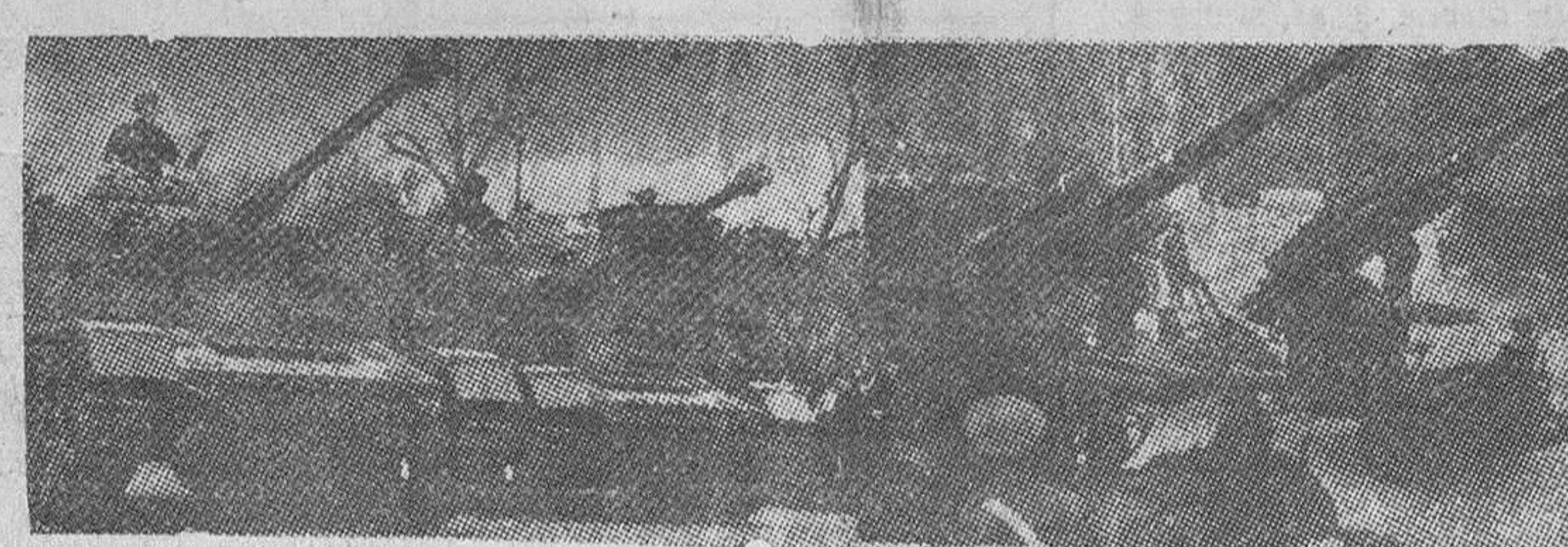
Baterías artilleras del Ejército desfilan ante el Caudillo, entre el entusiasmo de las gentes. También unidades de tanques pasarán ante S. E. el Jefe del Estado.