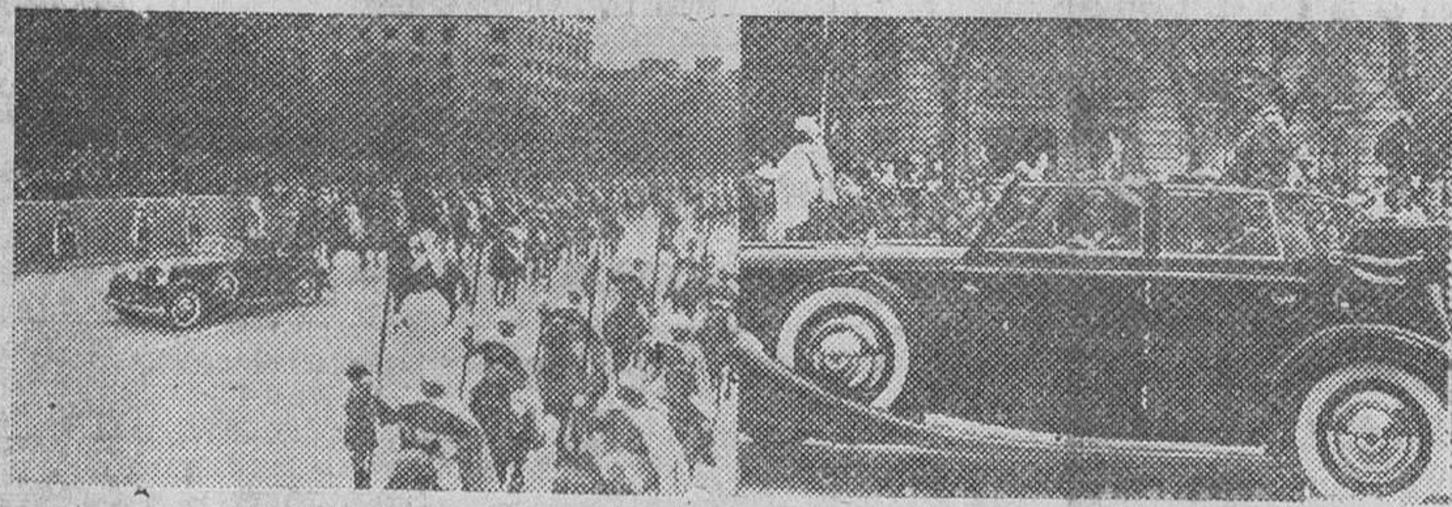
Escortado por la Guardia Mora, el Caudillo se aproxima a la tribuna, desde donde ha de presenciar el desfile. Después, en el coche, de pie, acompañado del Ministro del Ejército, S. E. abandona el paseo de la Castellana, saludando a la muchedumbre, que le aclama con entusiasmo.