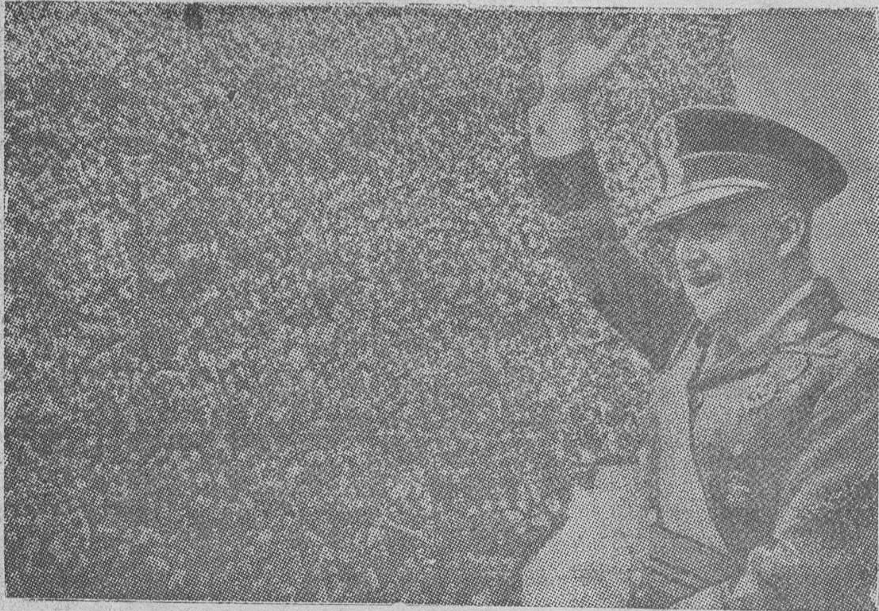
Madrid. S. E. el Jefe del Estado saluda desde el Palacio Nacional a la inmensa multitud que le aclama en la Plaza de Oriente. Flamean los pañuelos blancos símbolo de paz y de triunfo jubiloso al grito de ¡Franco! ¡Franco! ¡Franco! S. O. C.