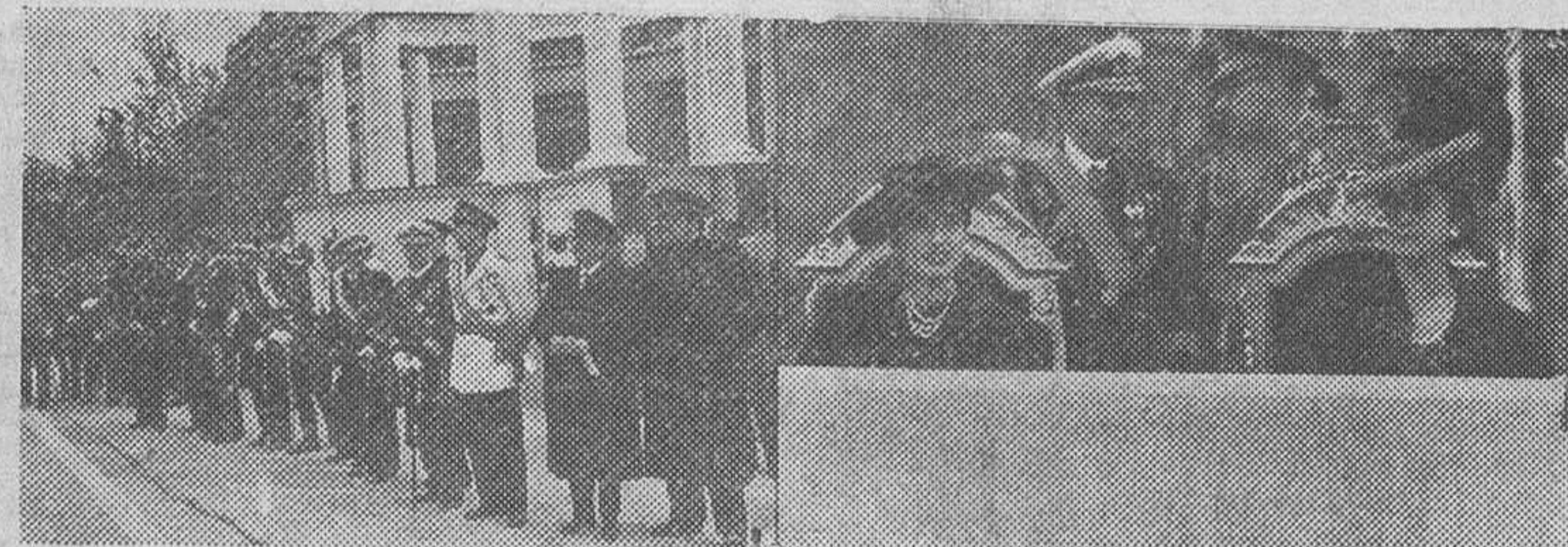
El Gobierno en pleno espera del Caudillo, para que de co en la tribuna presidencial del Paseo del Generalísimo la llegada mienzo el desfile de la Victoria. Al pie de la tribuna, los ministros otras autoridades civiles y militares. Frente a la tribuna del Jefe del Estado, su esposa y su hija asisten al magnífico desfile del séptimo año de la Victoria.