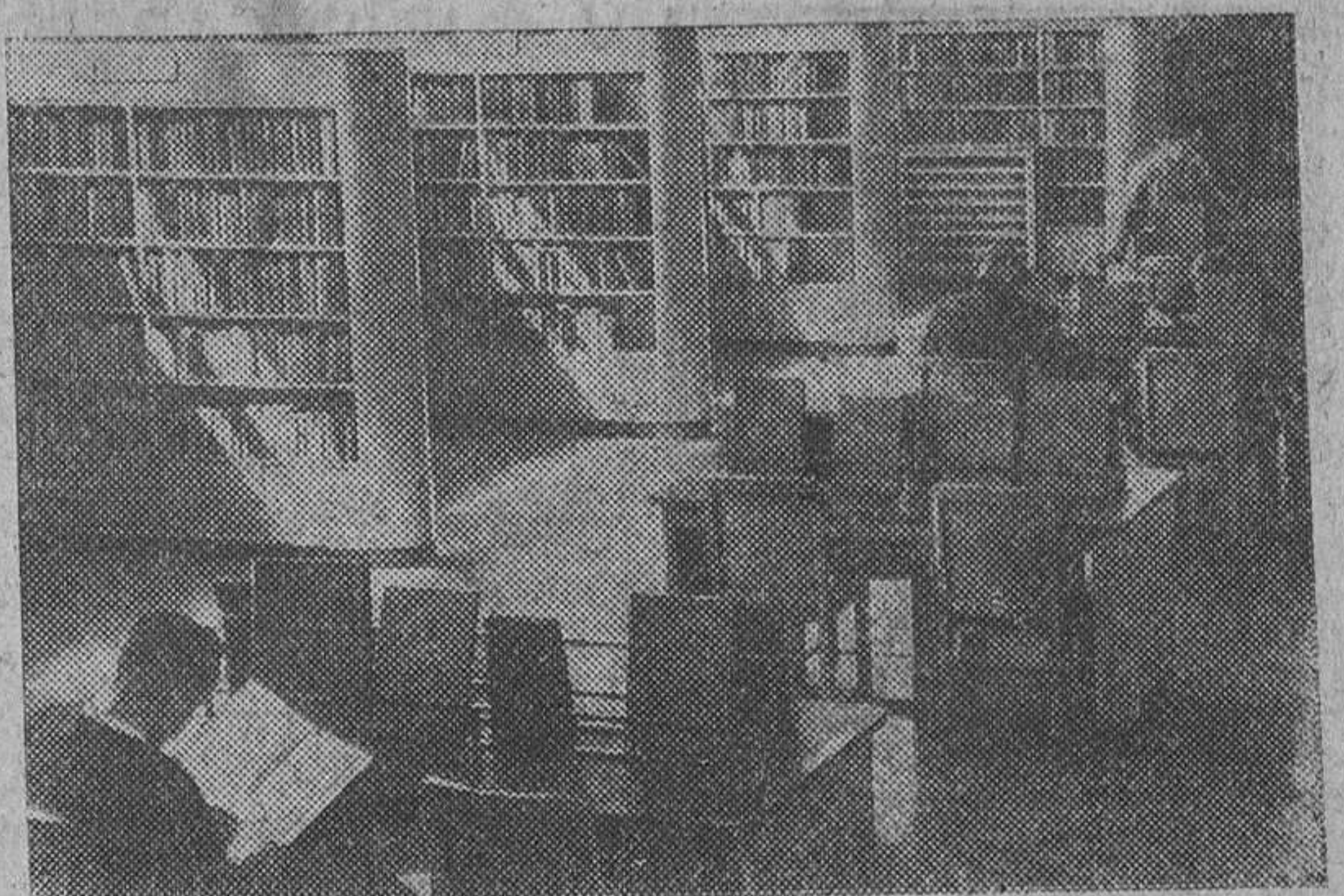
Vista interior de la biblioteca regional de Kenton, en Midd (Inglaterra) con arreglo a las modernas necesidades en centros de este estilo