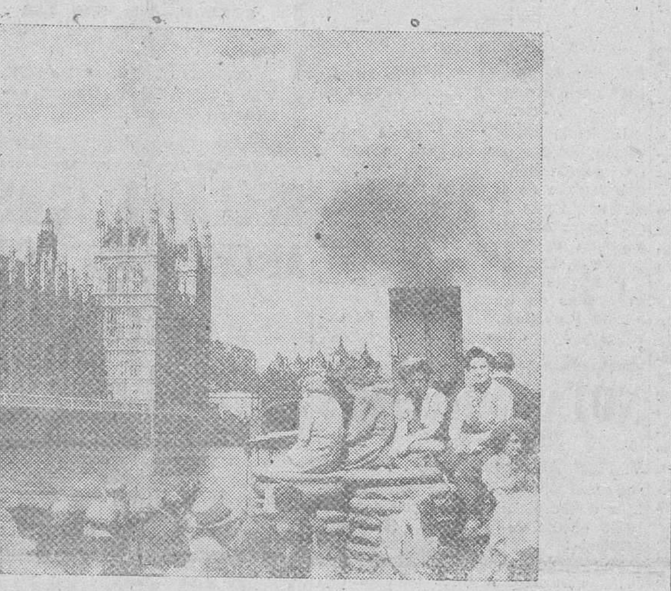
A la terminación de las hostilidades, se han reanulado los viajes turísticos de navegación por el Támesis, como nos presenta la foto

La Asamblea constituyente francesa celebró ayer su primera sesión