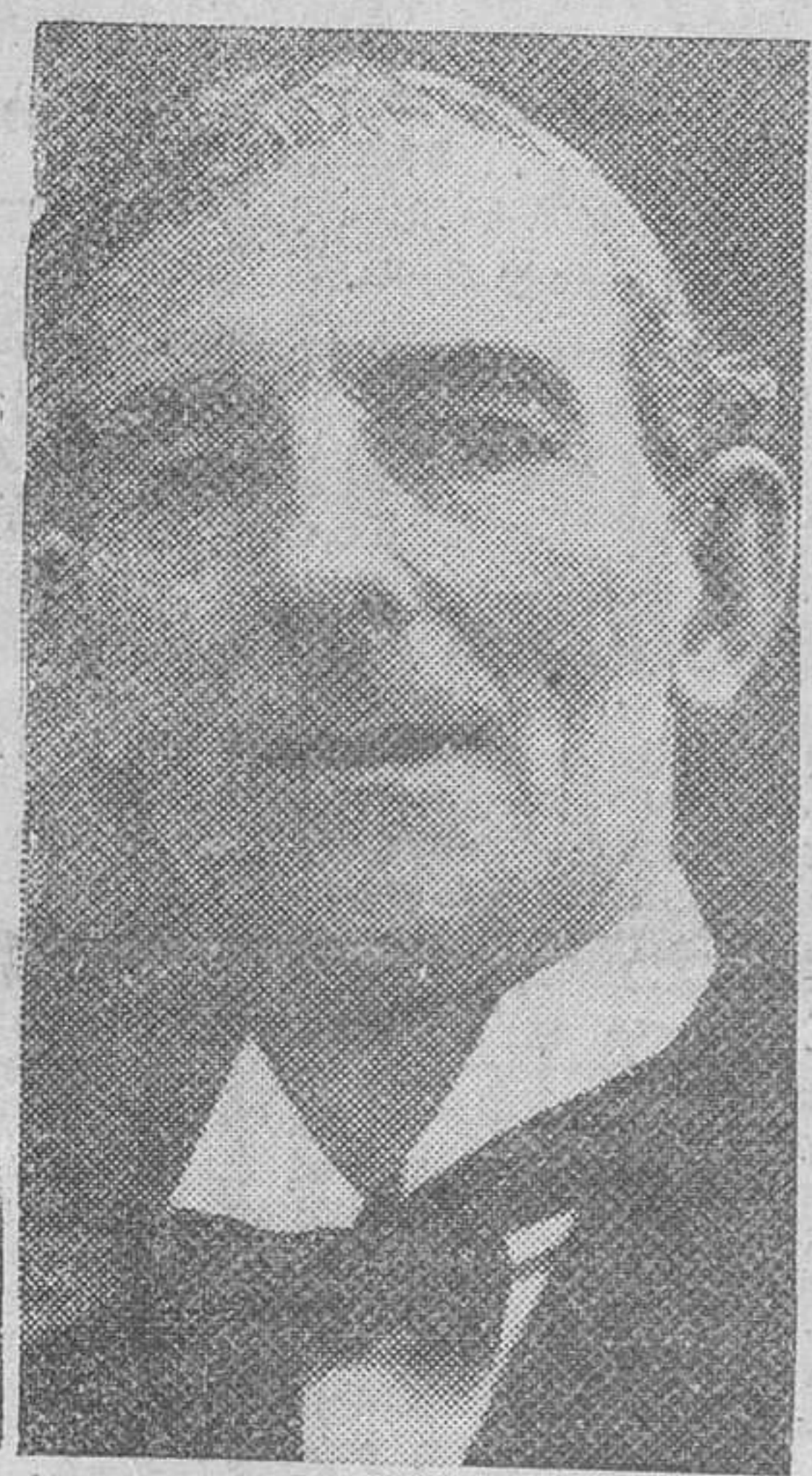
Mr. Tom Williams, ministro de Agricultura del Gobierno laborista inglés