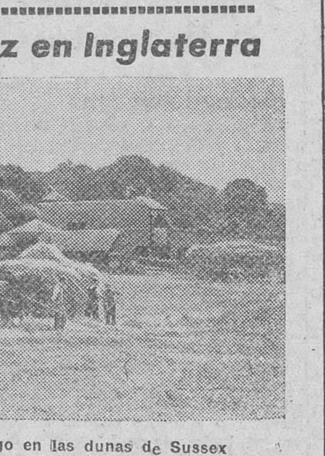
Faenas de recolección del trigo en las dunas de Sussex

Londres (Crónica especial transmitida por radio).—El presidente del Presidium supremo de la Unión Soviética, Mikail Kalinin, ha pronunciado recientemente un discurso —cuyo contenido no ha sido conocido hasta hoy en Londres— que arroja mucha luz sobre la política que en la órbita internacional está siguiendo Moscú, incomprendiblemente para muchos, pero de fácil explicación después de haberse leído las de-