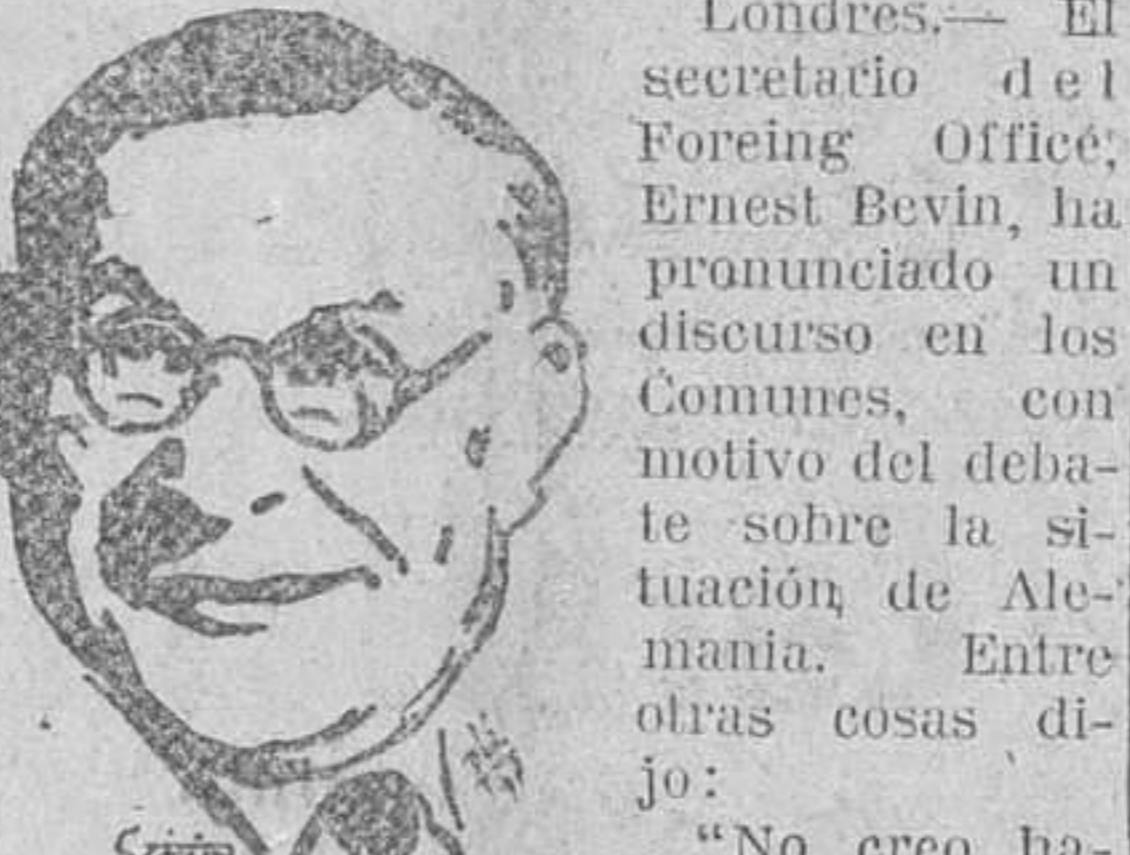
Londres.— El secretario del Foreign Office, Ernest Bevin, ha pronunciado un discurso en los Comunes, con motivo del debate sobre la situación de Alemania. Entre otras cosas dijo: "No creo haya en el Mundo nada peor ni más criminal que unos estadistas que persiguen su objetivo levantan odios de raza y arrojando a unos pueblos contra otros. Dejad vivir a los pueblos su propia vida, sea cual fuere su nacionalidad y convivan felizmente. Nunca se atacarán si no se les empuja a ello por algún motivo militar o estratégico o por alguna razón de esa índole."

El periódico "Daily Mail" publica su información sobre este acto bajo el siguiente título: "Kalinin hace una advertencia al ejército contra la cultura occidental", y como subtítulo escribe: "El presidente soviético levanta el velo del secreto de Rusia" y "El Estado aún se encuentra en peligro".