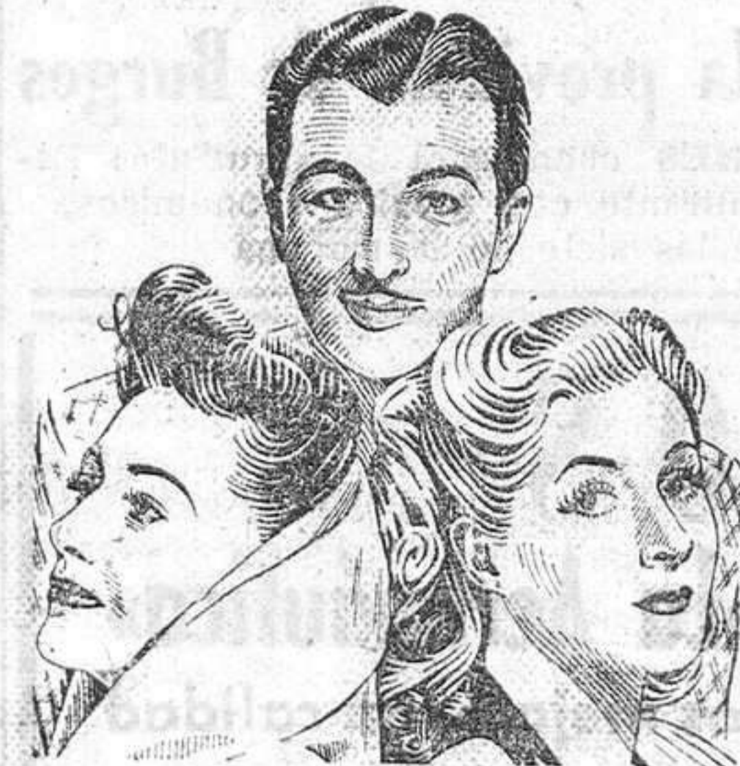
Joan CRAWFORD Robert TAYLOR * Creer GARSON