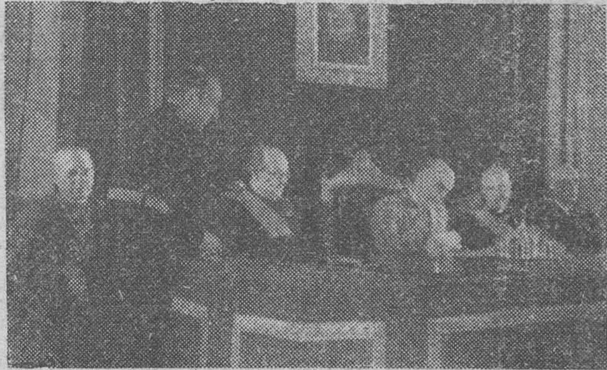
Madrid.—La sesión de clausura de la reunión del Pleno del Consejo Superior de Investigaciones Científicas, fué presidida por el Caudillo acompañado del ministro de Educación Nacional y presidente de dicho Organismo y del señor Siñeriz, vicepresidente.—Foto (S. O. F.)