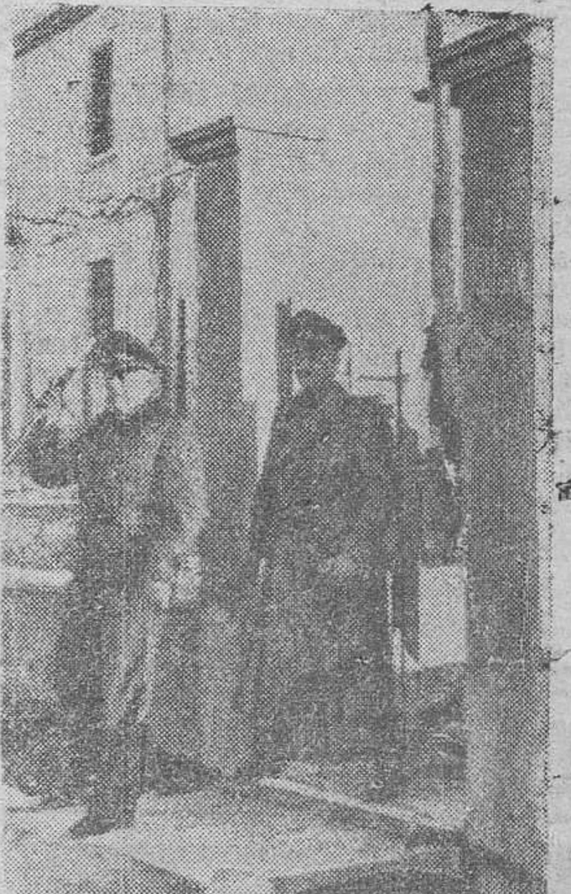
El mariscal Kesselring, acompañado del general von Vietinghoff, sale de inspeccionar un puesto de mando alemán.