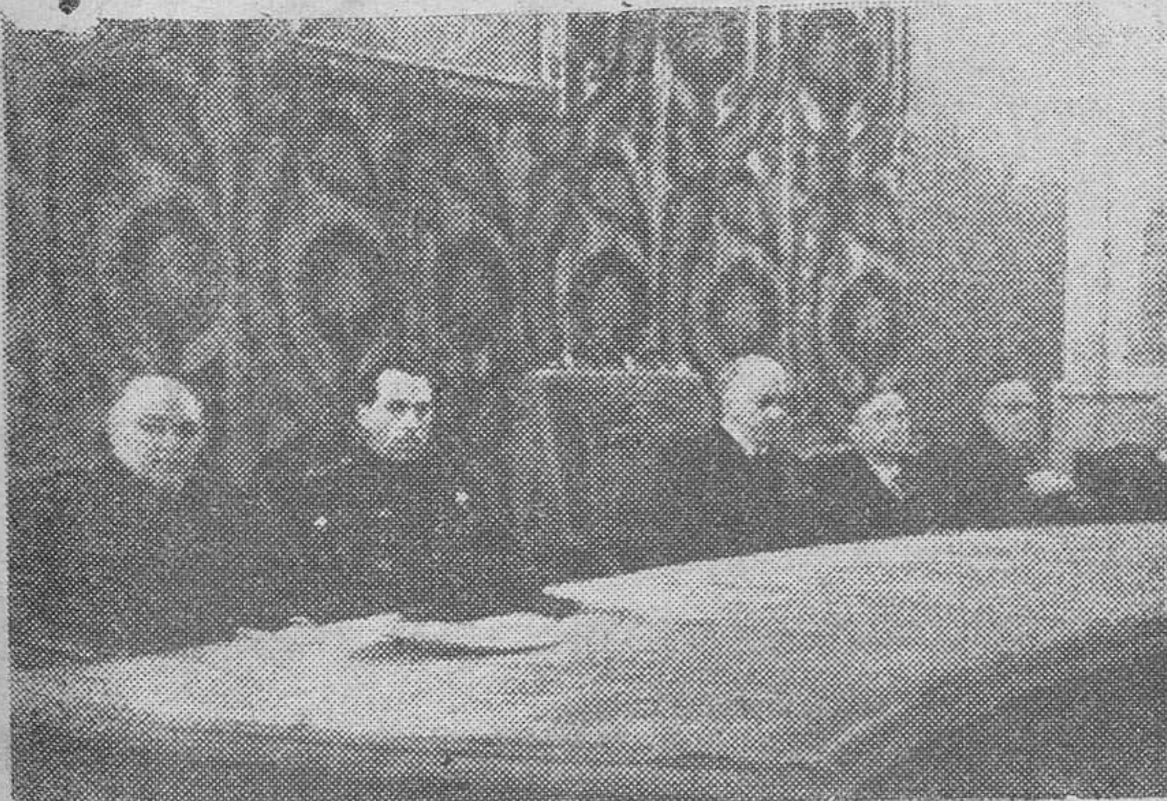
Madrid.—En la Universidad de Madrid se ha inaugurado el curso de la Facultad de Ciencias Económicas y Políticas.