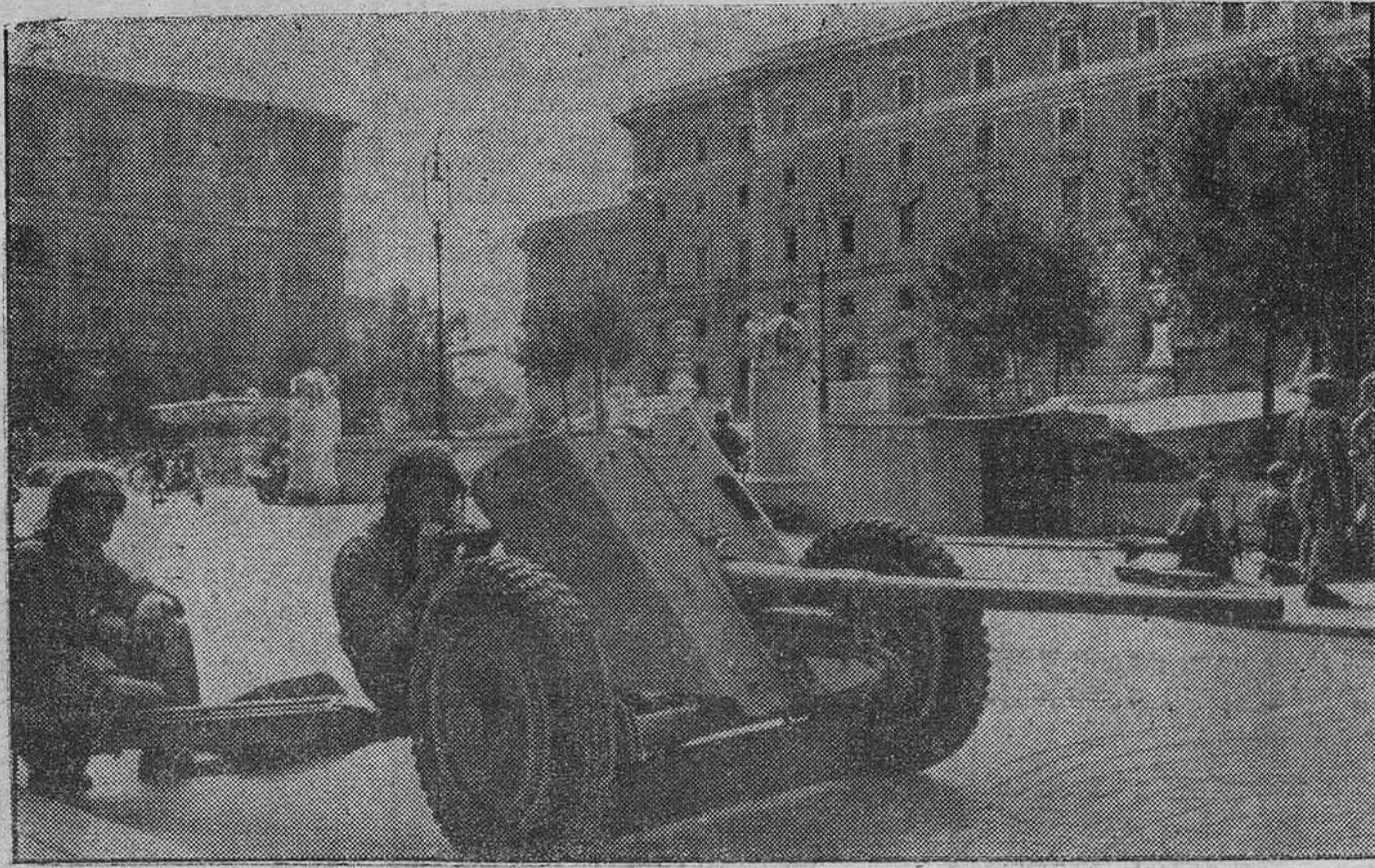
Fuerzas paracaidistas alemanas destacadas en una ciudad del Norte de Italia toman todas las medidas preventivas para un posible ataque del enemigo