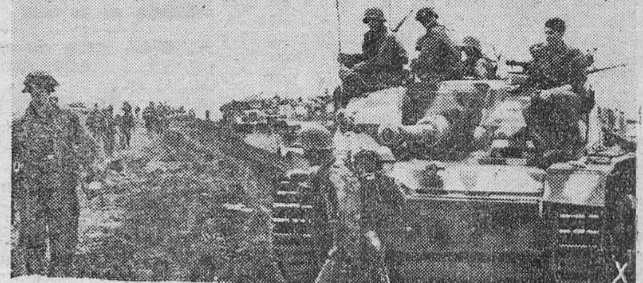
Infantería y tanques alemanes camino de las posiciones defensivas en el frente Este