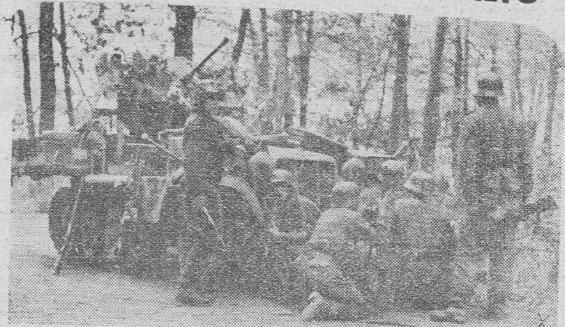
Tropas de choque alemanas, parapetadas tras un carro de asalto, se dispone a lanzarse sobre las posiciones del enemigo en el frente del Este