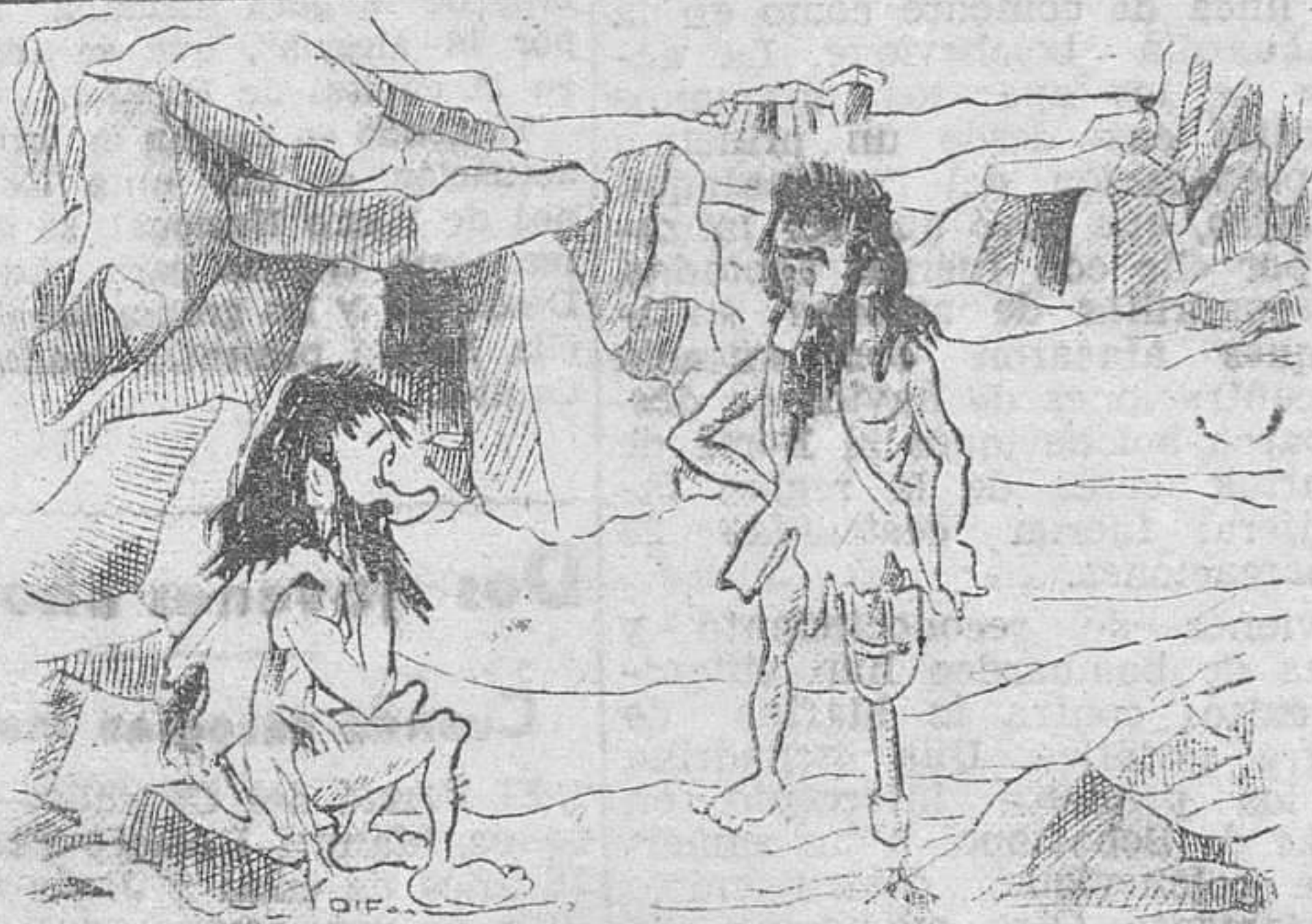
EN LA EDAD DE PIEDRA

ULTIMO MODELO LA LLAVE DEL ETER BATTANER - MONEDA. 14