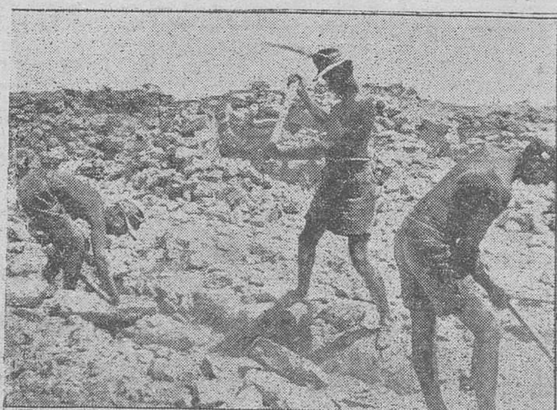
Las fuerzas del Eje han realizado en el Norte de Africa esfuerzos sobrehumanos. No sólo los de la guerra y la tenaz resistencia a los ingleses, sino el construir caminos, fortificaciones y el hacer de los arenales y pedregales zonas asequibles al movimiento de la guerra de nuestros tiempos. En esta foto presentamos un momento de estos trabajos