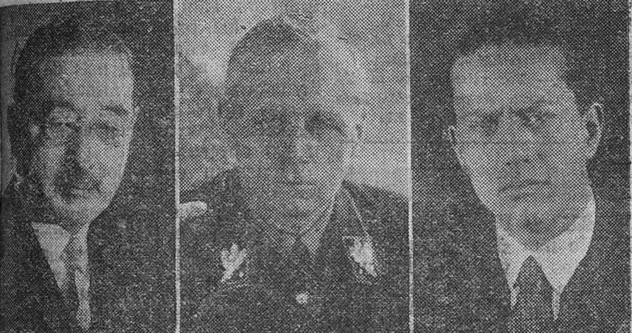
Kurusa, Von Ribbentrop y el Conde Ciano, los plenipotenciarios del Japón, Alemania e Italia, firmantes del Pacto Tripartito de estas tres potencias

pon, en idéntico sentido de concepción de la vida como pueblos libres, las potencias del Eje de Europa estaban librando la batalla contra Inglaterra. Antes, el triángulo Berlín-Roma-Tokio, actuó en común contra la fuerza destructora del comunismo. Con el pacto antikomintern, libraron los tres países de una pesadilla que amenazaba con su virus destruir a la humanidad, circunscribiendo a la U. R. S. S. sus equivocados conceptos ideológicos. Quizás quepa a los gobernantes japoneses un tanto en favor de España. El Imperio del Sol Naciente fué siempre una amenaza para la U. R. S. S. bolchevique, e influyó mucho para que se llegara a la firma del pacto famoso del 24 de Agosto de 1939 entre Alemania y Rusia. ¿Es extraño que con todos estos antecedentes se llegara a la triple alianza germano-italo-nipona? Es preciso hablar un poco de Norteamérica. Se tiene que reconocer que los yanquis han sido siempre los favorecidos de la suerte. País inmenso como ninguno en la tierra, tiene todas las rique-