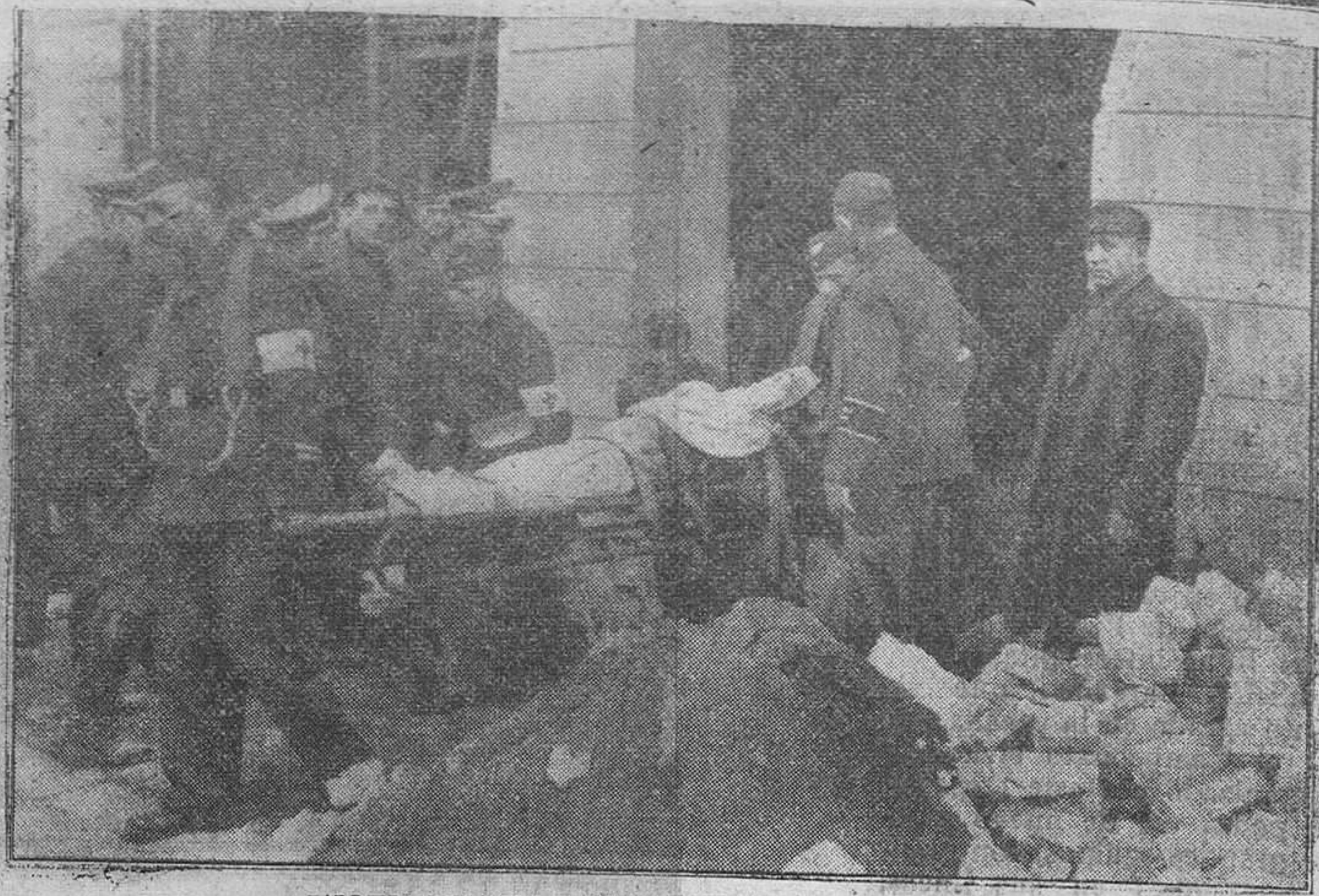
VICTIMAS DE LA POBLACION CIVIL ALEMANA En la noche del 24 de Septiembre, los aviones ingleses pudieron llegar hasta Berlín. Sus bombas, lanzadas al azar y sin precisas las sobre objetivos militares, causaron daños en el Norte y Este de la ciudad, en barriadas muy habitadas. He aquí el momento de retirar una víctima los servicios de Seguridad

MADRID.— El «Boletín Oficial del Estado» publica un decreto por el que cesa en el cargo de subsecretario de Prensa y Propaganda, don José María Alfaro y Polanco, agradeciéndosele el servicio prestado.—Cifra.