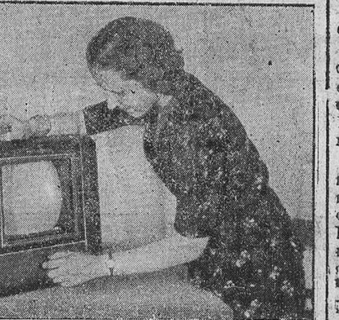
El nuevo receptor de mesa de televisión tipo Telefunken TF 1, un aparato suplementario para el radioreceptor