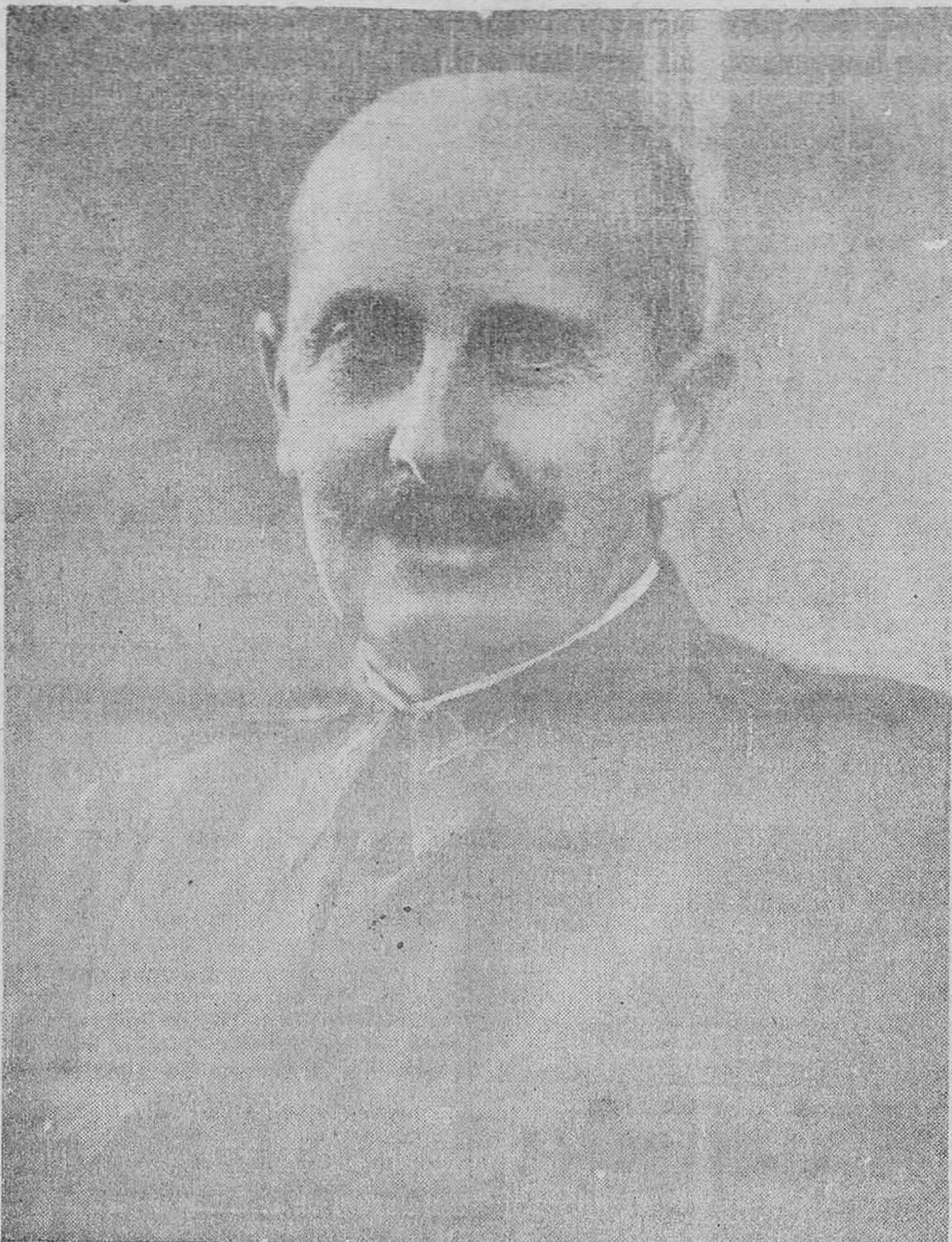
El insigne general D. Fidel Dávila y Arroyo, que al frente del Ejército del Norte ha llevado la mayor parte del peso de la guerra con sus campañas victoriosas del Norte, de Aragón y de Cataluña

«Agradezco vivamente la entusiasta felicitación de V. E. por la liberación de Madrid y victoria final de nuestras invictas armas, complaciéndome en manifestarle que en estas horas de triunfo tenemos muy presente que la gran Nación Alemana y su glorioso Führer supieron comprender desde el primer momento la justicia de nuestra Causa y nos ofrecieron su simpatía y amistad. Salúdale muy cordialmente.—General Jordana, vicepresidente del Gobierno y ministro de Asuntos Exteriores.»