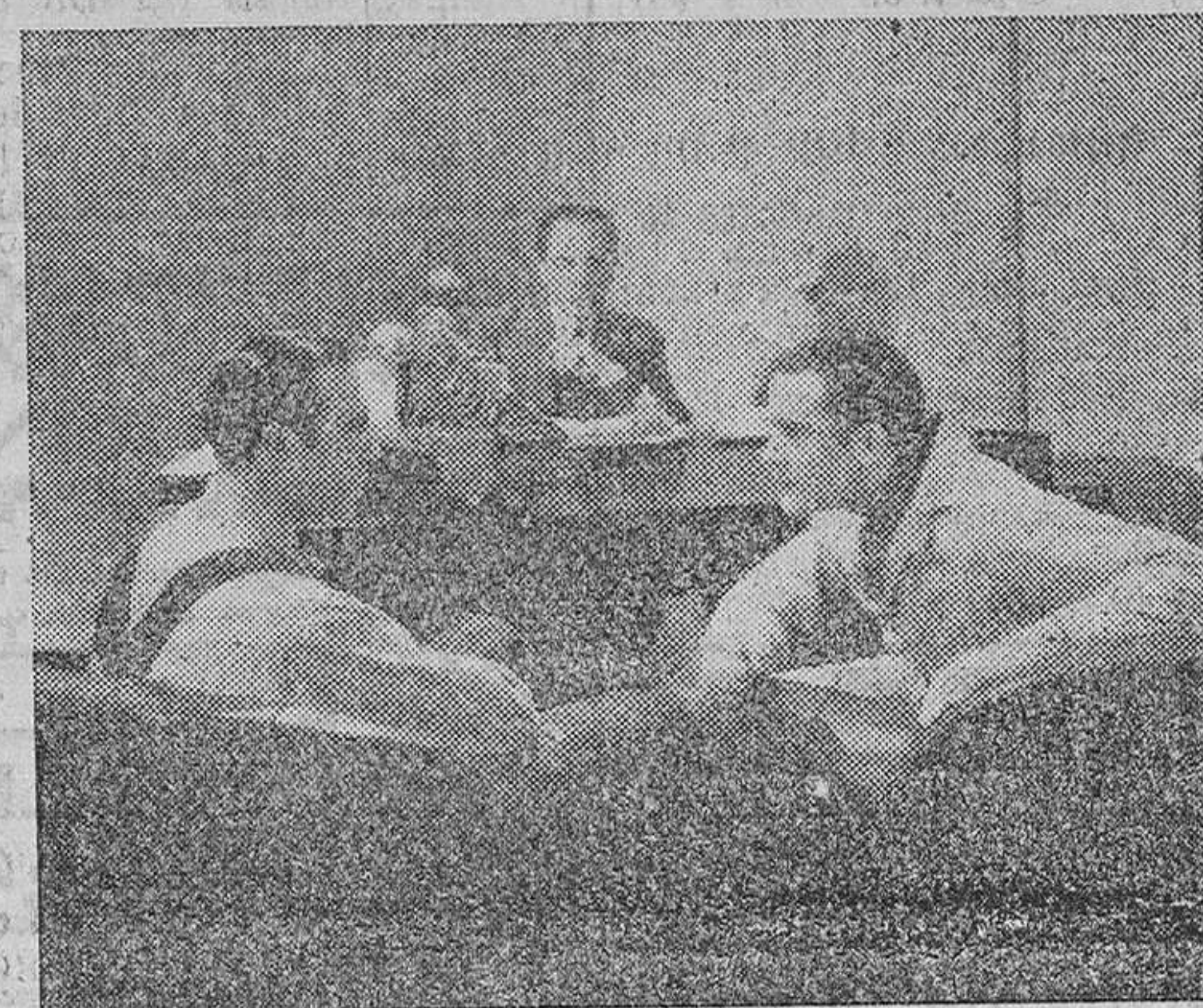
LA SANGRE MANDA, excelente producción mejicana que presenta en España CIFESA.