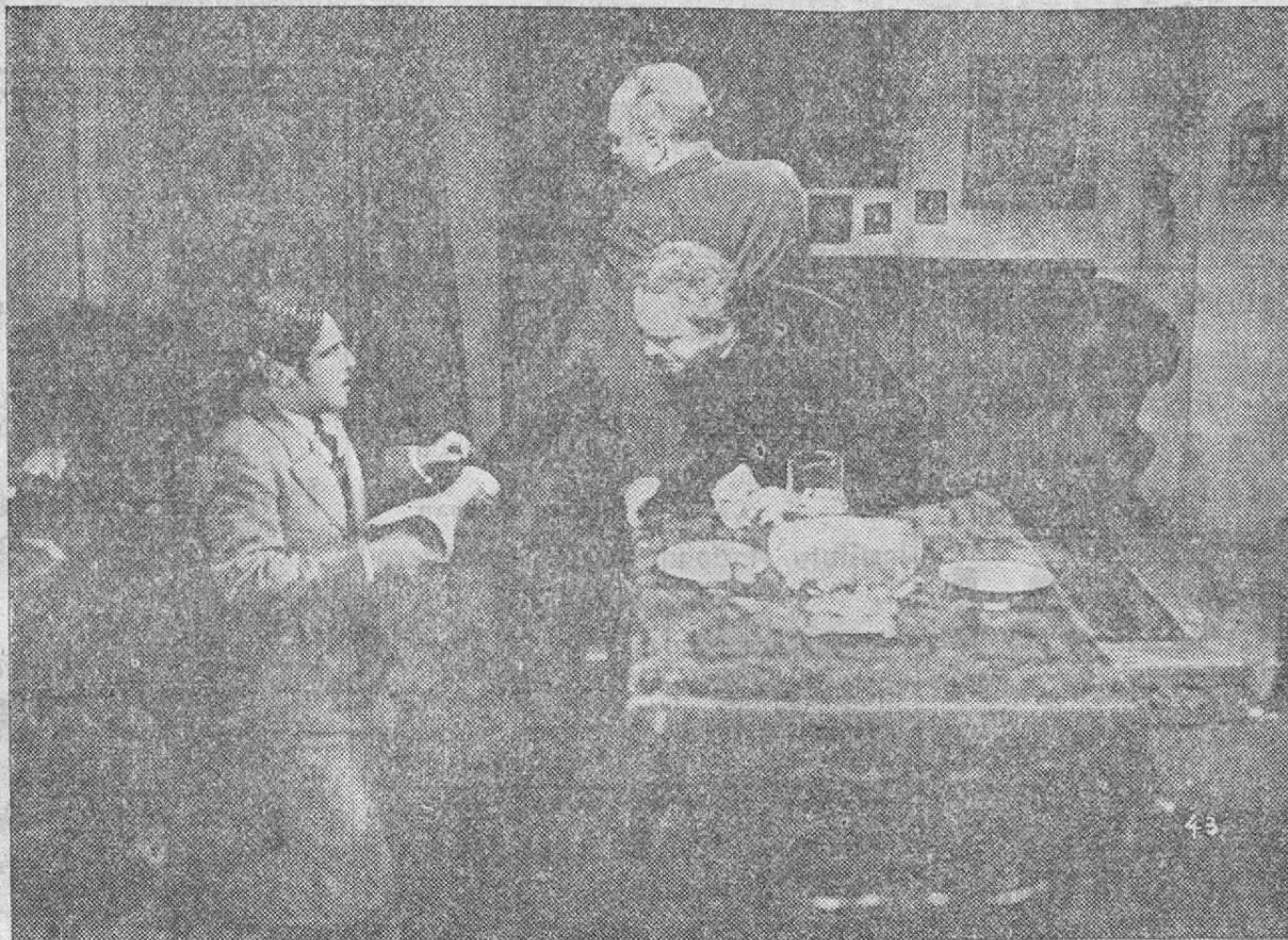
Una escena del emocionante film LA SANTA Y EL LOCO distribuido por Cifesa.