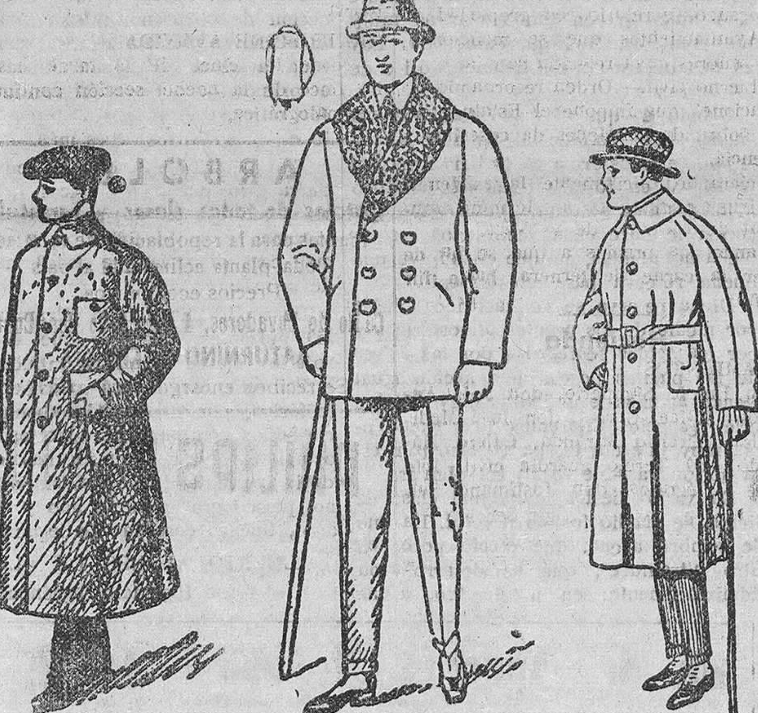
Guardapolvos de caballero a 13, 20, 25, 30, 40, 50 y 70 pesetas Pellizas pelo, cuello rizo a 18, 20, 25, 30, 40, 50 y 75 pesetas Gabardinas a 40, 50, 60 y 70 pesetas Impermeables de 25 a 30

La casa que más barato vende y más surtido presenta