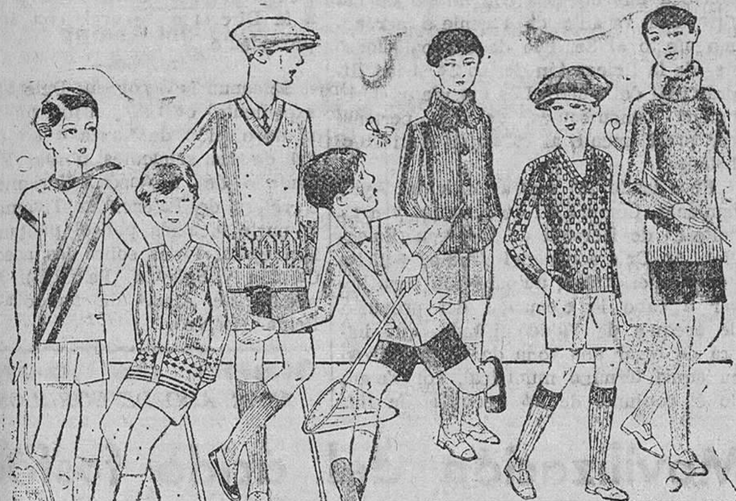
Gerseys punto, para niño, diversidad de dibujos y colores A 4, 5, 6, 7, 8 y 10 pesetas