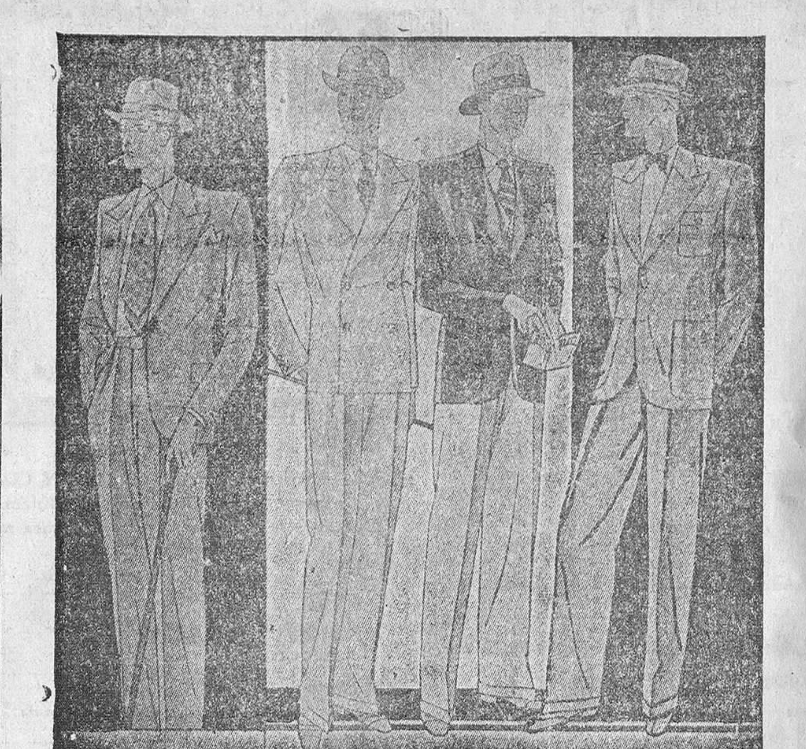
Trajes, corte perfecto, a 40, 50, 60, 70, 80, 90, 100 y 125 pesetas. Grandes surtidos para elegir.

La Casa que más surtido presenta y más barato vende