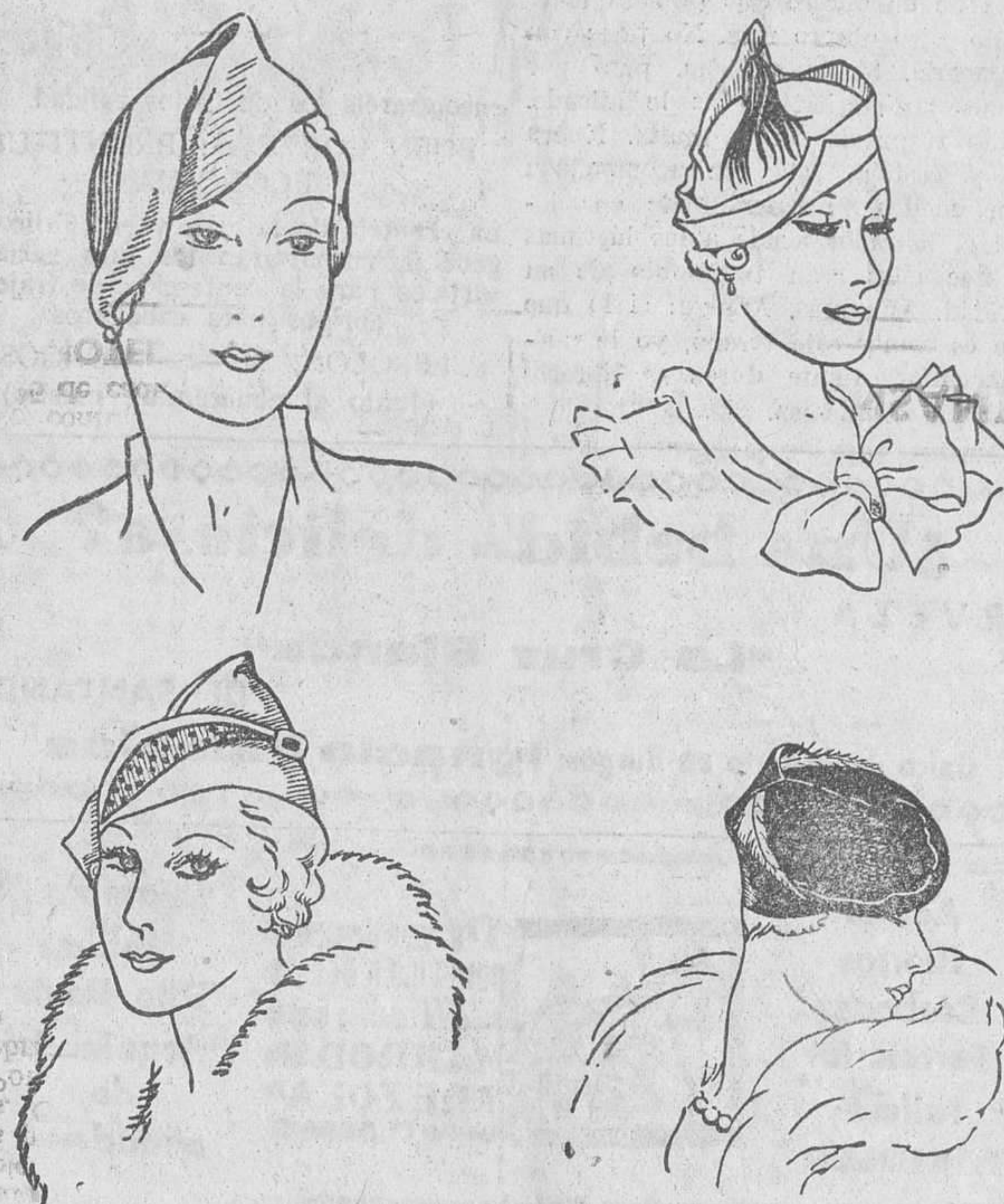
Algunos de los modelos que presenta en la actual temporada