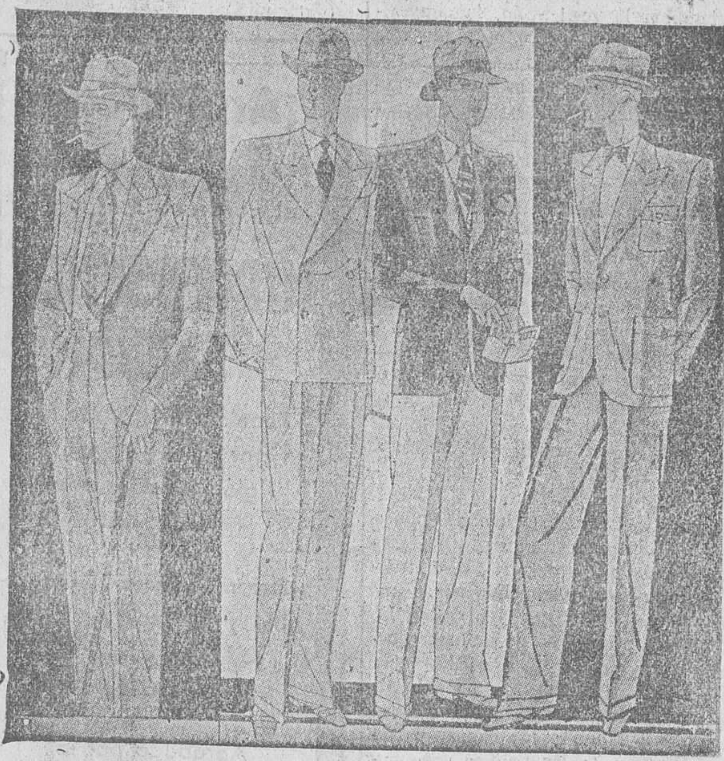
Trajes, corte perfecto, a 40, 50, 60, 70, 80, 90, 100 y 125 pesetas. Grandes surtidos para elegir.

La Casa que más surtido presenta y más barato vende