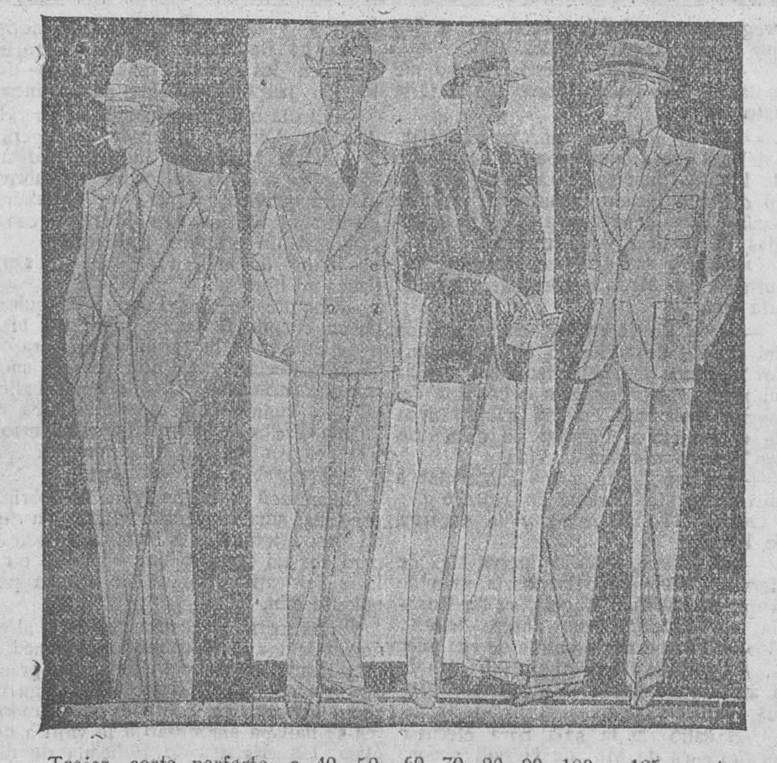
Trajes, corte perfecto, a 40, 50, 60, 70, 80, 90, 100 y 125 pesetas. Grandes surtidos para elegir.