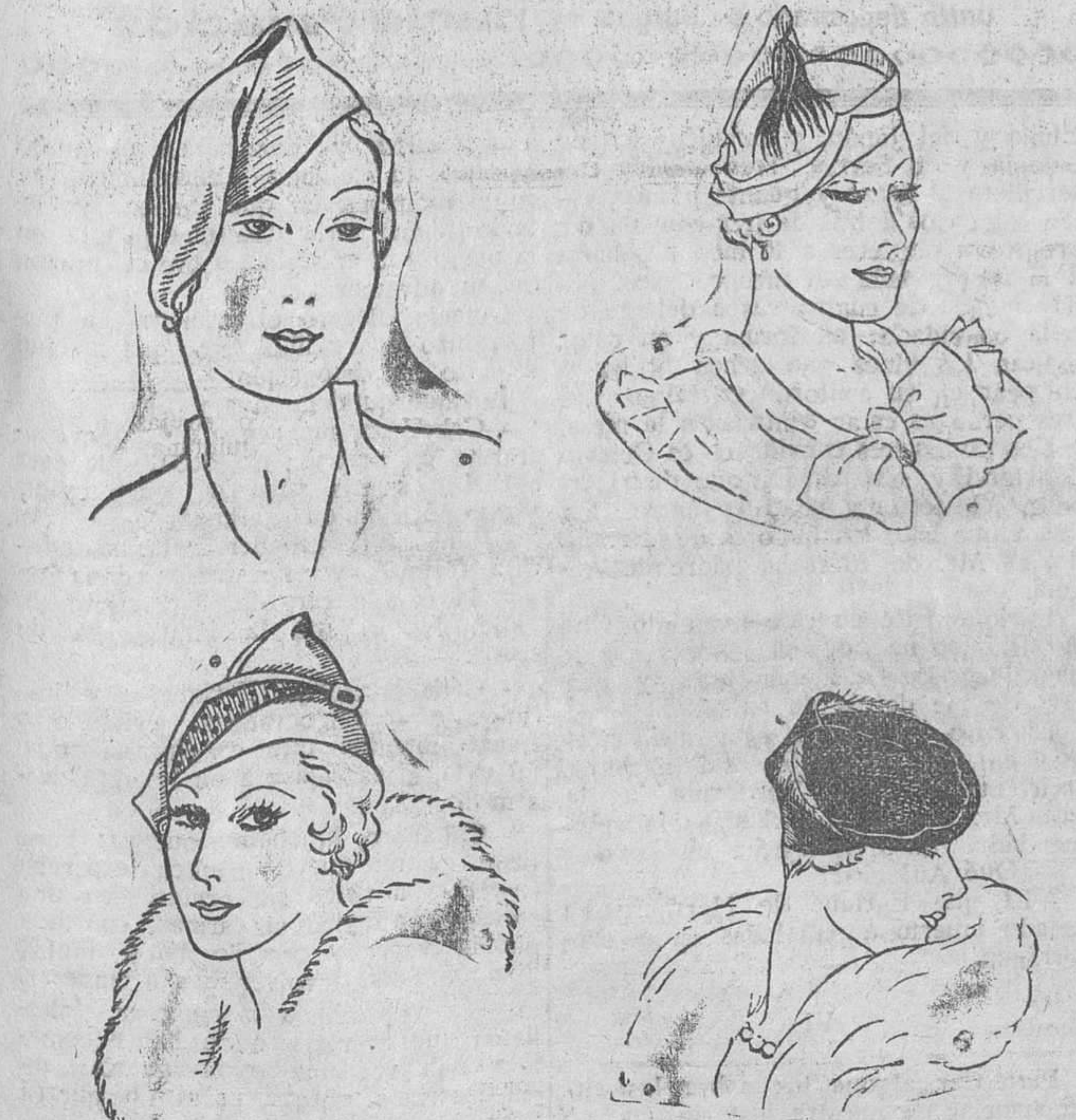
Algunos de los modelos que presenta en la actual temporada