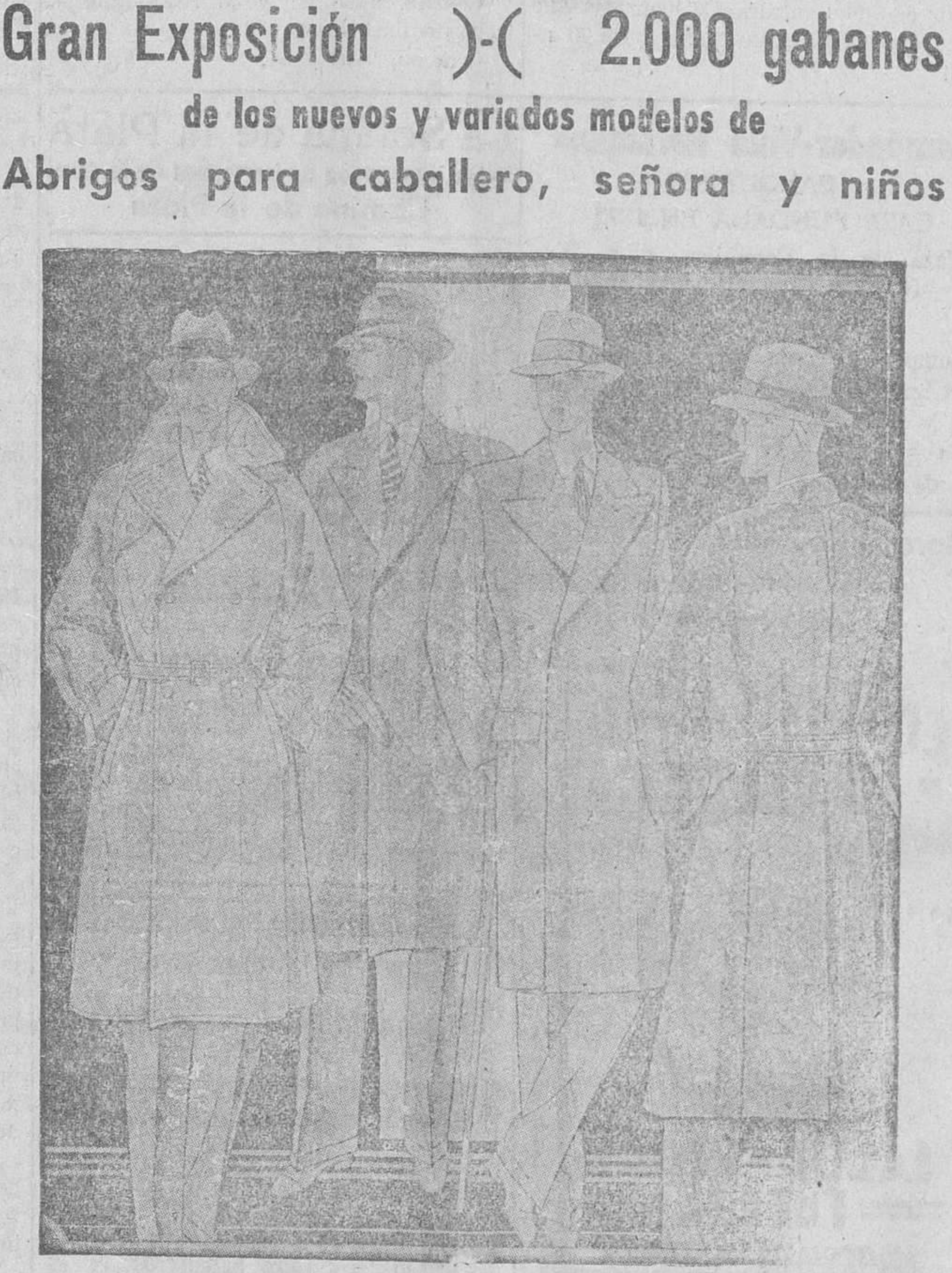
Aconsejo que antes de hacerse un abrigo de caballero, señora o niños, vea precios, y calidades en

Gran Exposición — ( 2.000 gabanes de los nuevos y variados modelos de Abrigos para caballero, señora y niños