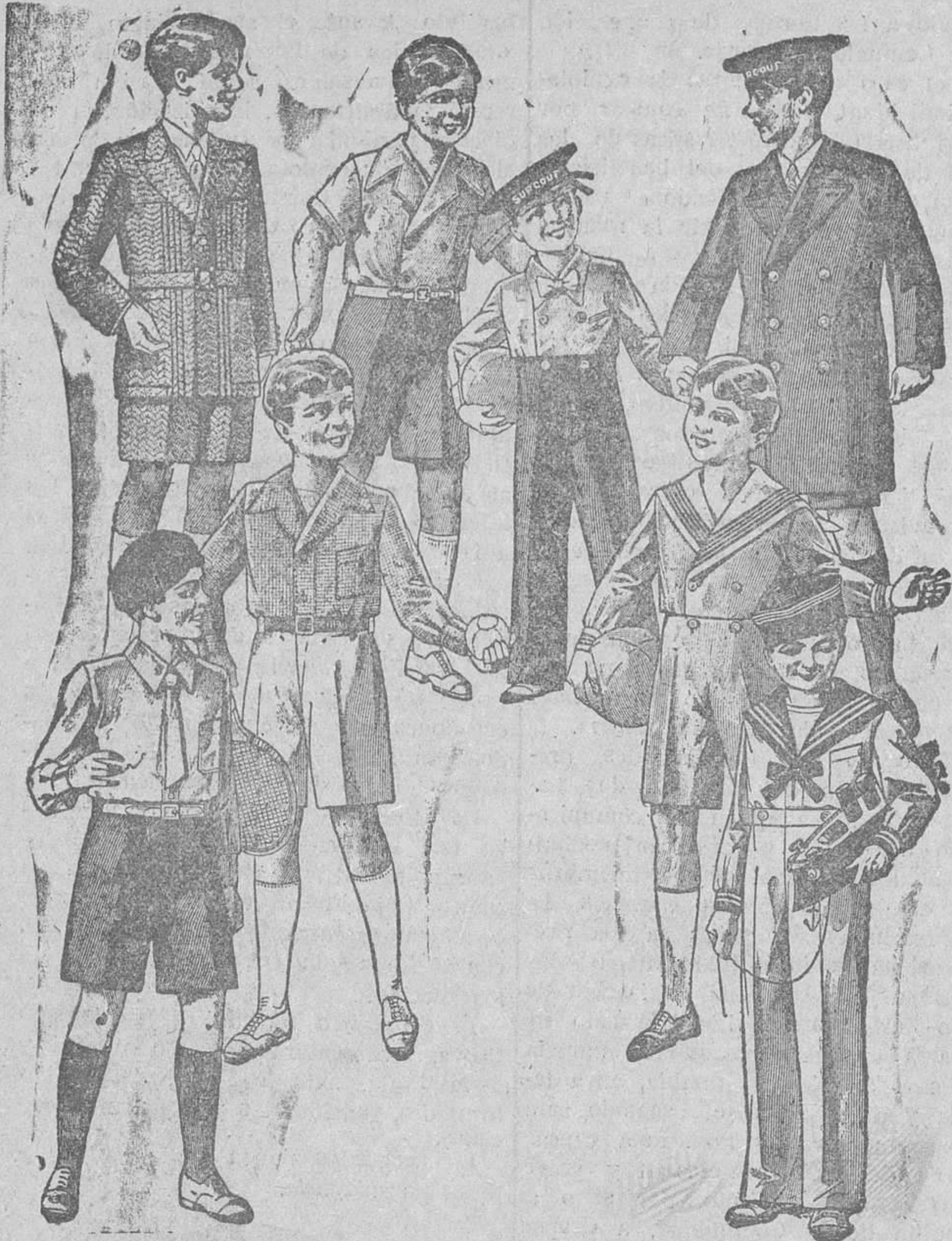
Trajecitos, modelos novedad, de 15, 18, 20, 25 y 30 pesetas

Primera casa en confecciones para caballero, señora y niños Plaza Mayor, 43. Lain-Calvo, 9 y 11.-Sucursal: Plaza Mayor, 8, Burgos Teléfono, 603-R Teléfono, 284