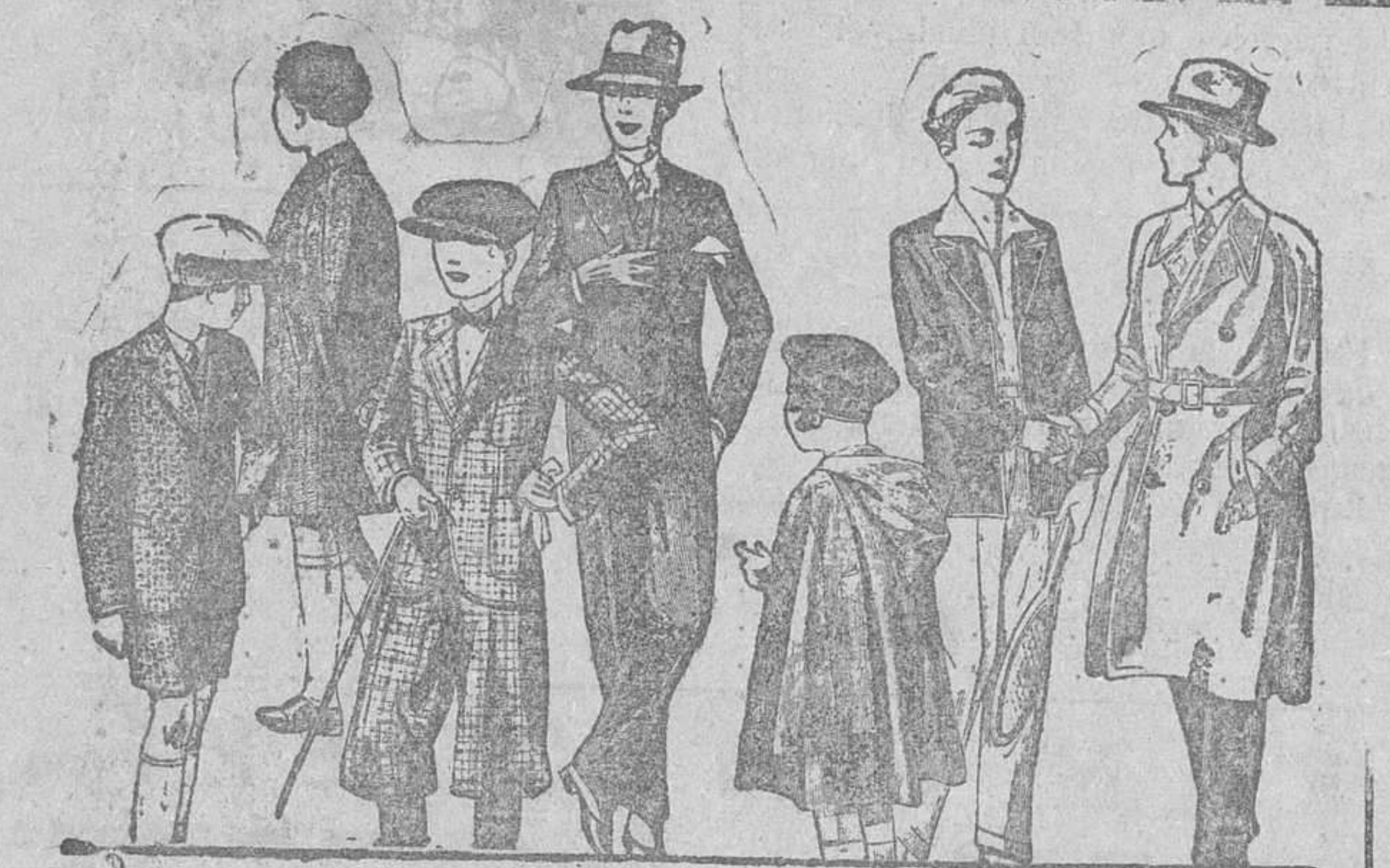
Abrigos y trajes de paño, modelos nuevos de 20, 25, 30, 35, 40 y 50 pesetas