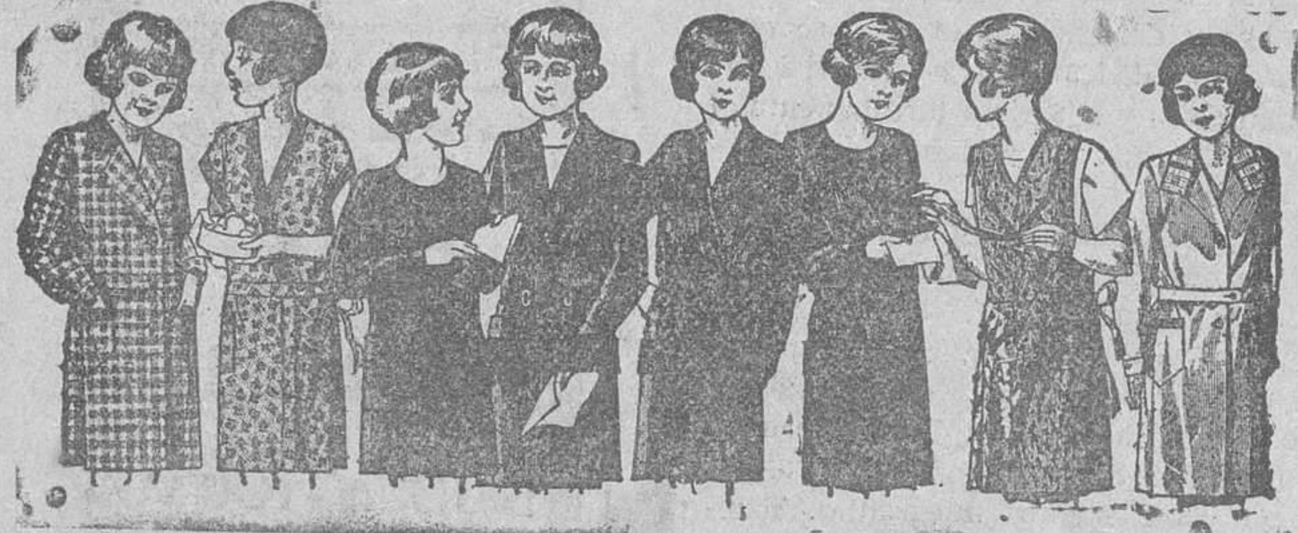
Centiditos para niñas de 8 a 14 años, en crepón, seda o lana, de 12, 15, 18, 20 y 25 pesetas.