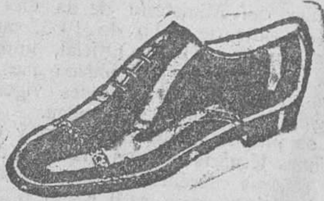
ZAPATOS Los mejores-Últimos modelos a 18 pesetas

La Casa que más surtido presenta y más barato vende