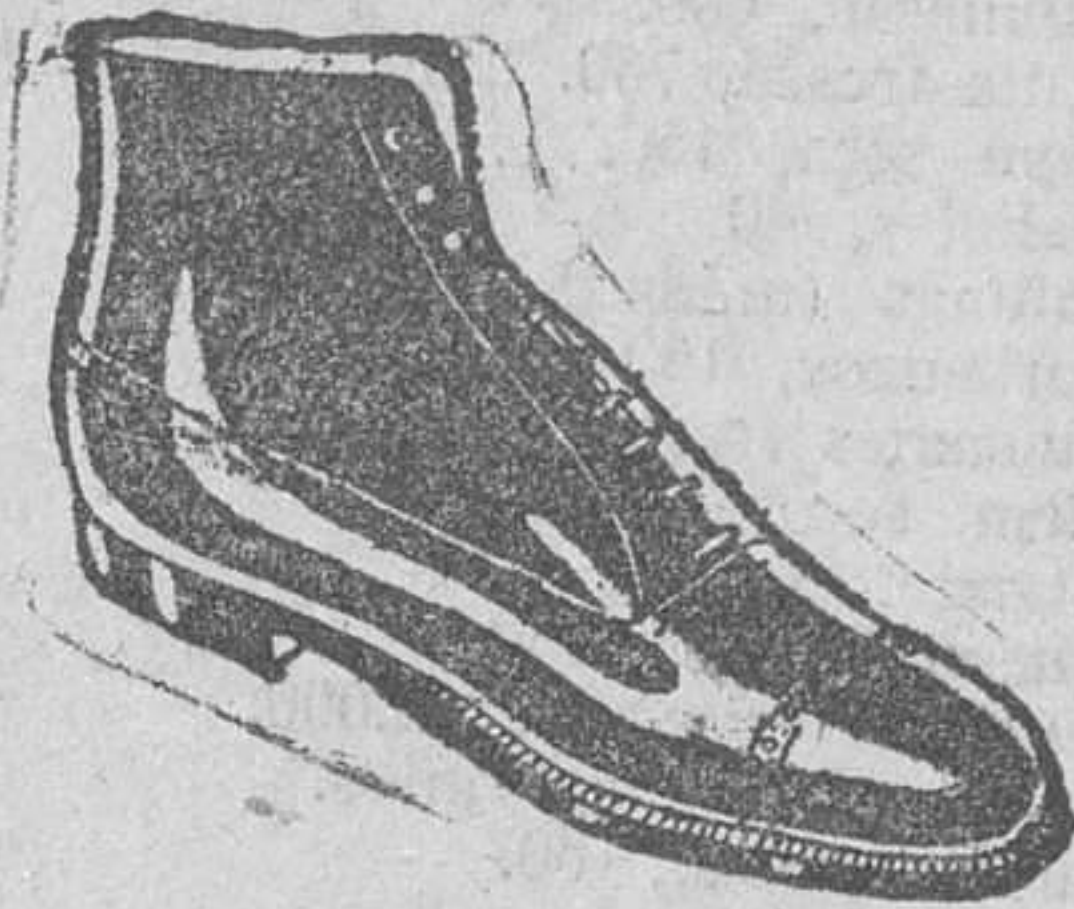
BOTAS Todo cosido a 19,50 pesetas