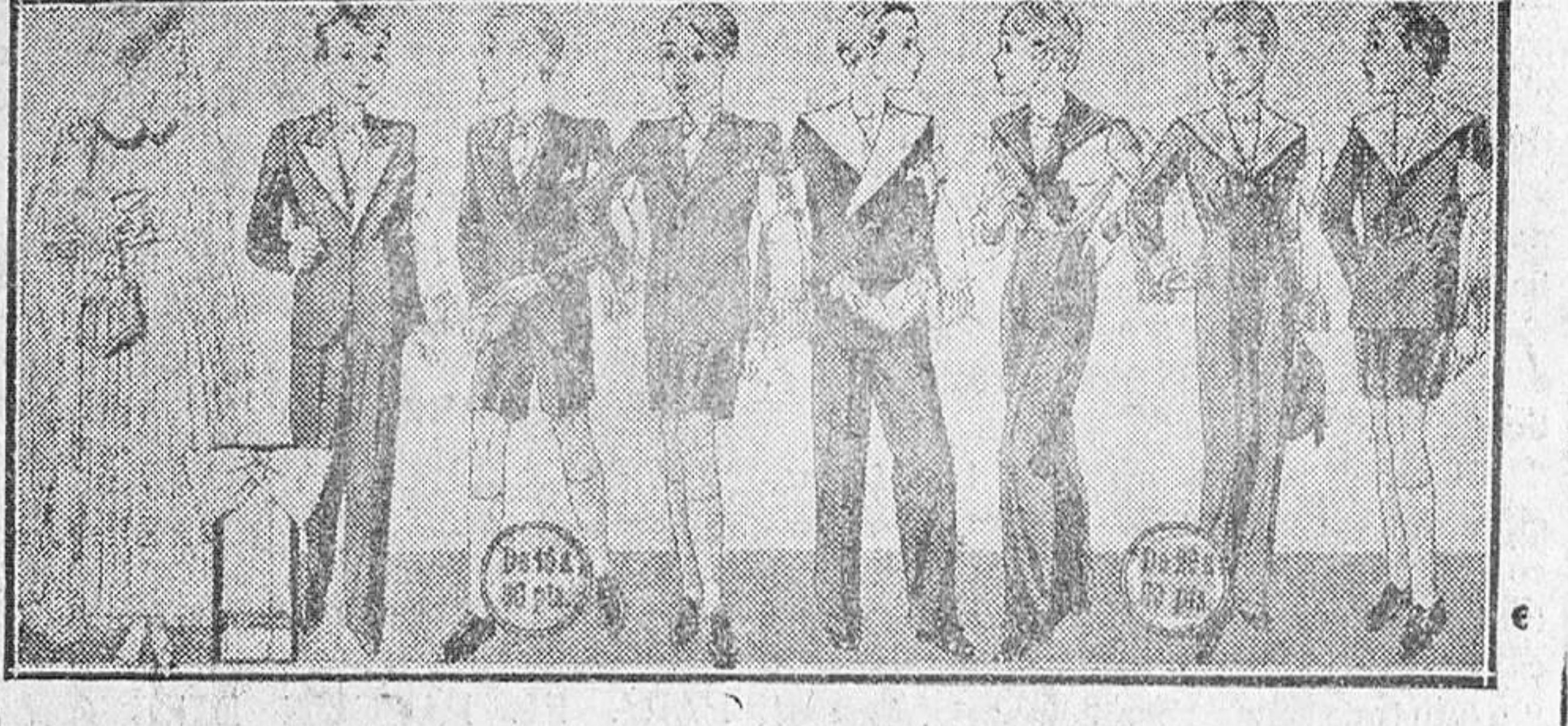
Diversidad de modelos de trajecitos para Primera Comunión, en lana blanca, lana gris y en azul, a 20, 25, 30, 40 y 50 pesetas.

Primera casa en confecciones para caballero, señora y niños Plaza Mayor, 42. Lain-Calvo, 9 y 11.-Sucursal: Plaza Mayor, 6, Burgo