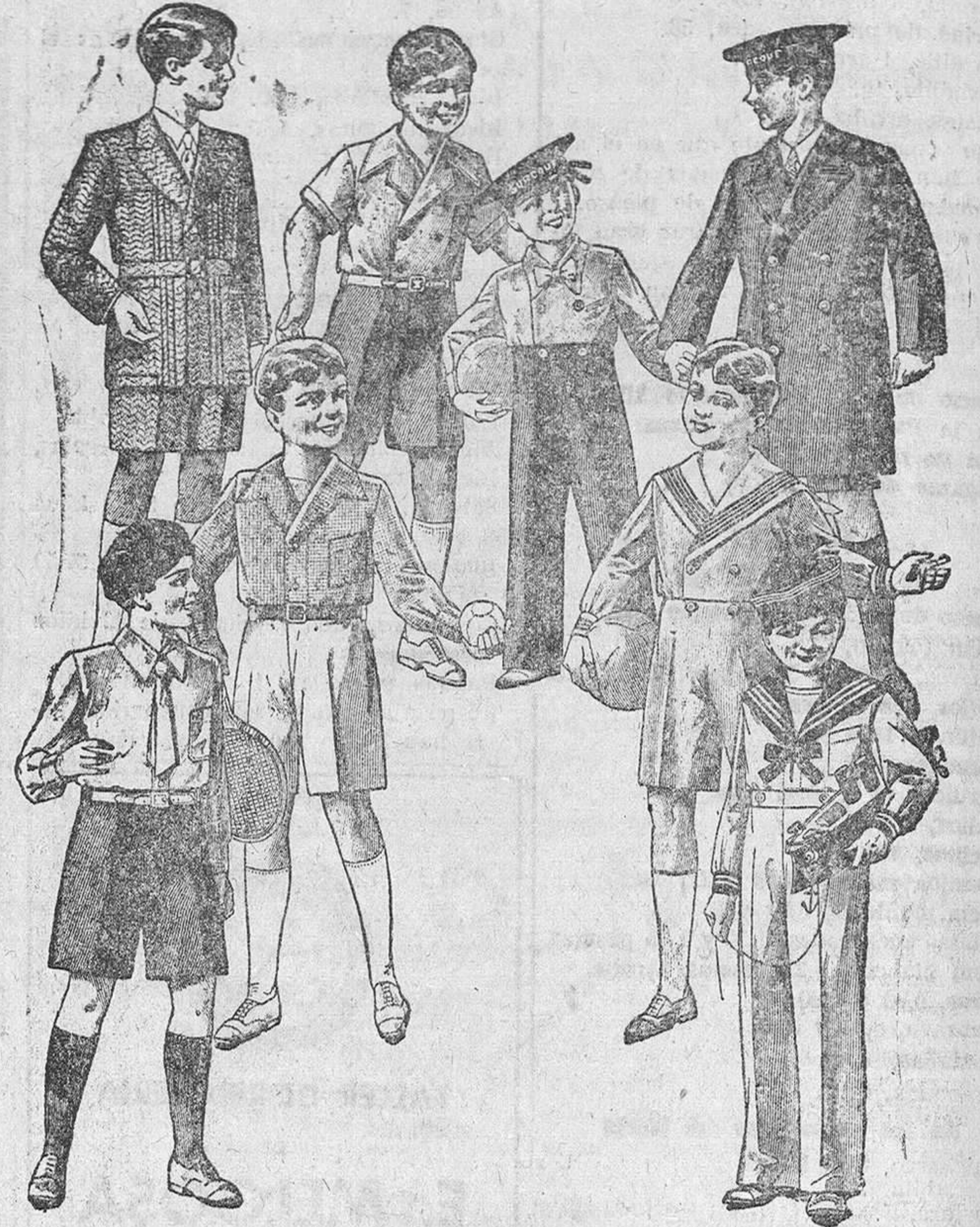
200 modelos distintos en trajecitos desde 12, 15, 18, 20 y 30 pesetas.

Primera casa en confecciones para caballero, señora y niños Plaza Mayor, 42. Lain-Calvo, 9 y 11.—Sucursal: Plaza Mayor, 8, Burgo