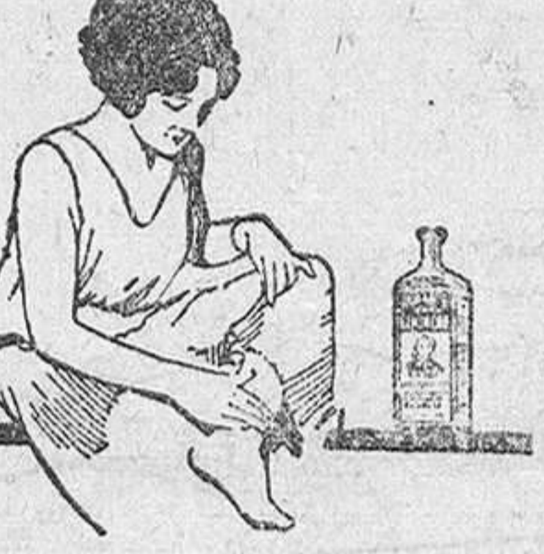
LAS TORCEDURAS deben curarse pronto y completamente. El Linimento de Sloan alivia el dolor, evita que se endurezcan los tejidos y coopera al pronto restablecimiento

El Linimento de Sloan quita casi inmediatamente cualquier dolor neurológico, reumático o muscular, es decir, que se presente sin herida. No son precisos vendajes ni fricciones, basta extenderlo suavemente por la parte dolorida para que penetre hasta la raíz del mal, haga circular la sangre y produzca una sensación agradable de calor y bienestar. Se seca rápidamente sin dejar mancha. No es grasoso.