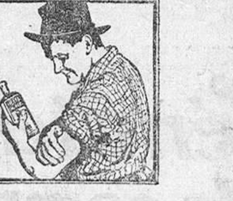
MUSCULOS CANSADOS Puede hacerse desaparecer rápidamente su dolor y endurecimiento con el Linimento de Sloan.

Por lo que pudiera suceder, tenga siempre un frasco en casa.