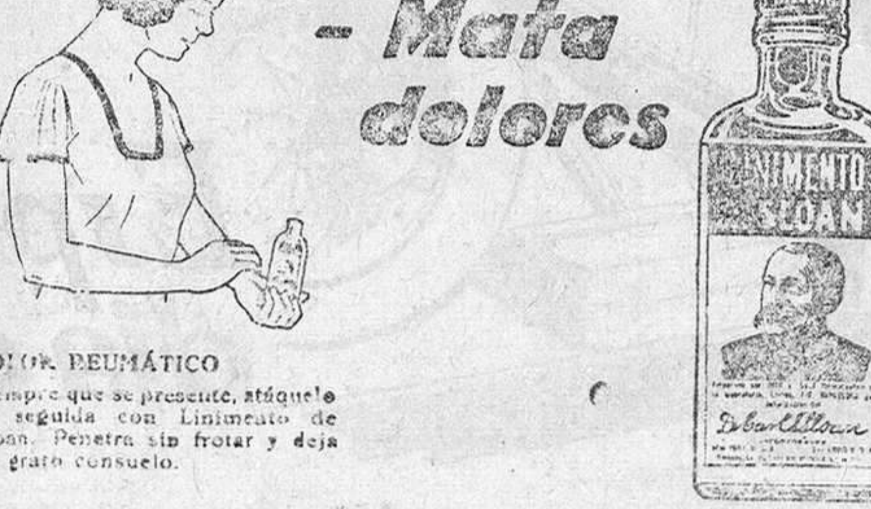
DOLOR REUMÁTICO Siempre que se presente, atáguelo en seguida con Linimento de Sloan. Penetra sin frotar y deja un gran consuelo.