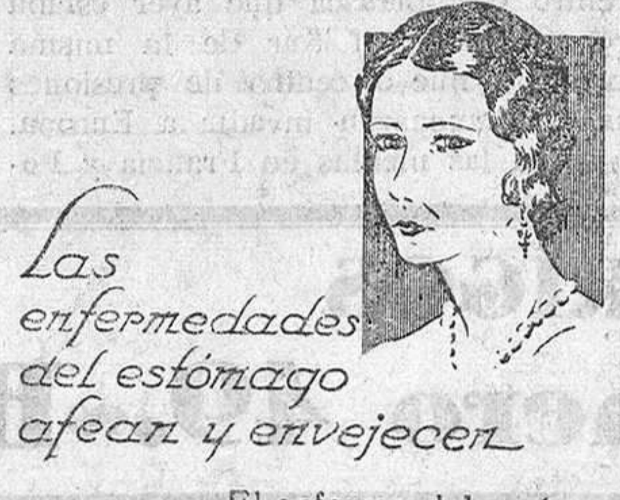
Las enfermedades del estómago afectan y envejecen