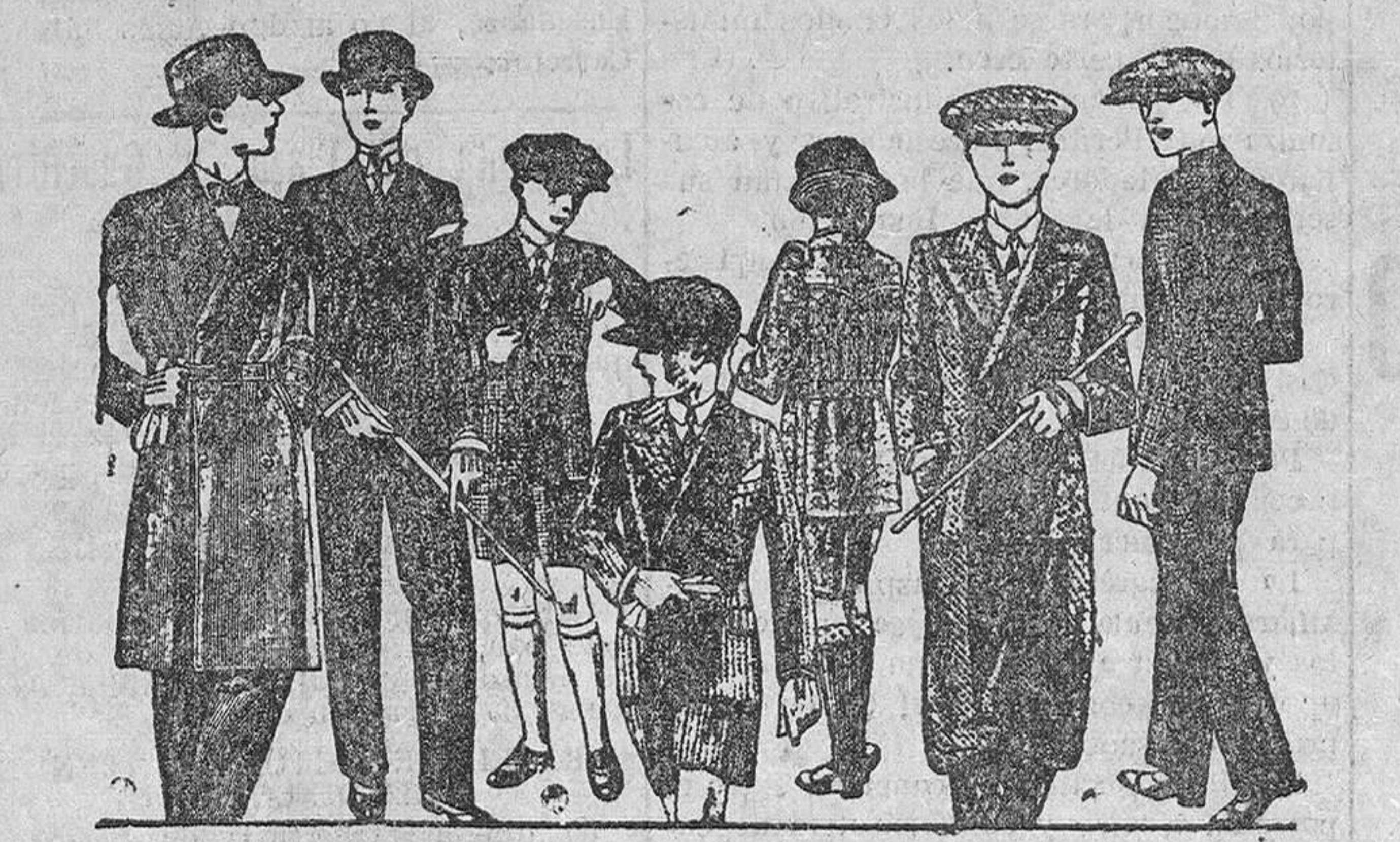
Trajes para jovencitos, edad de 12 a 20 años, a 40, 50, 60, 70 y 80 ptas.

Papel blanco e Impreso Se vende en la Administración de este periódico