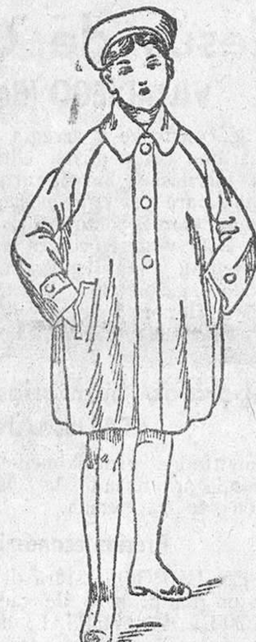
Impermeables checos, a 18, 20, 25 y 30 pesetas

Siempre grandes existencias encontrarán en la