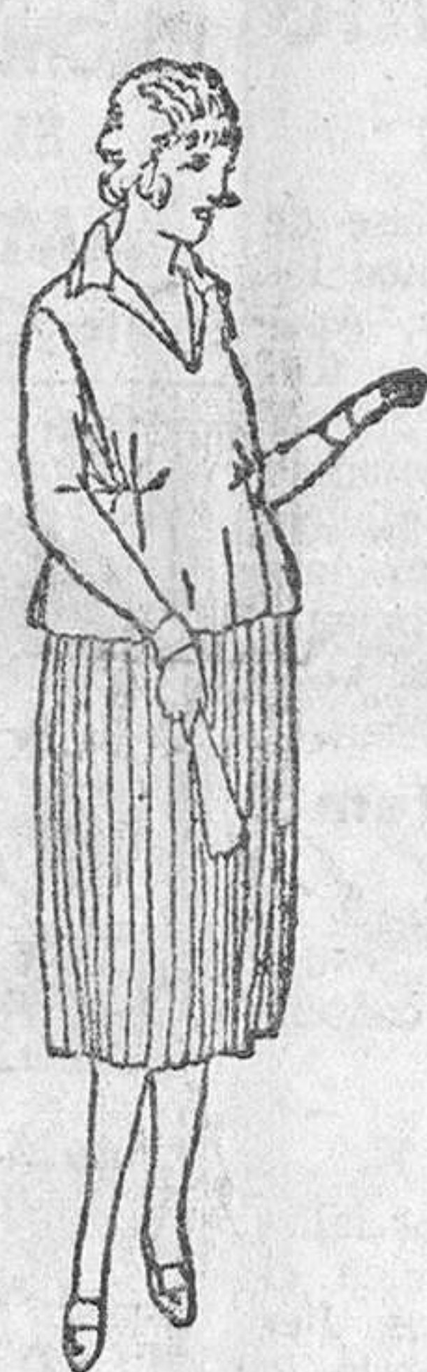
Vestidos para jovencitos en crepón o lana, a 5, 20 y 25 pesetas