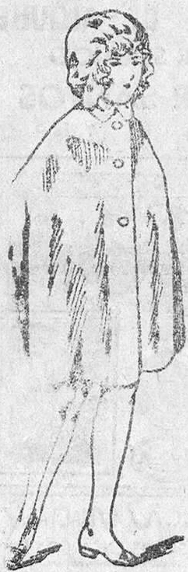
Capas colegiales, en distintos colores, a 8, 9, 10, 12 y 15 pesetas

Establecimiento oficial del Turin Club Español