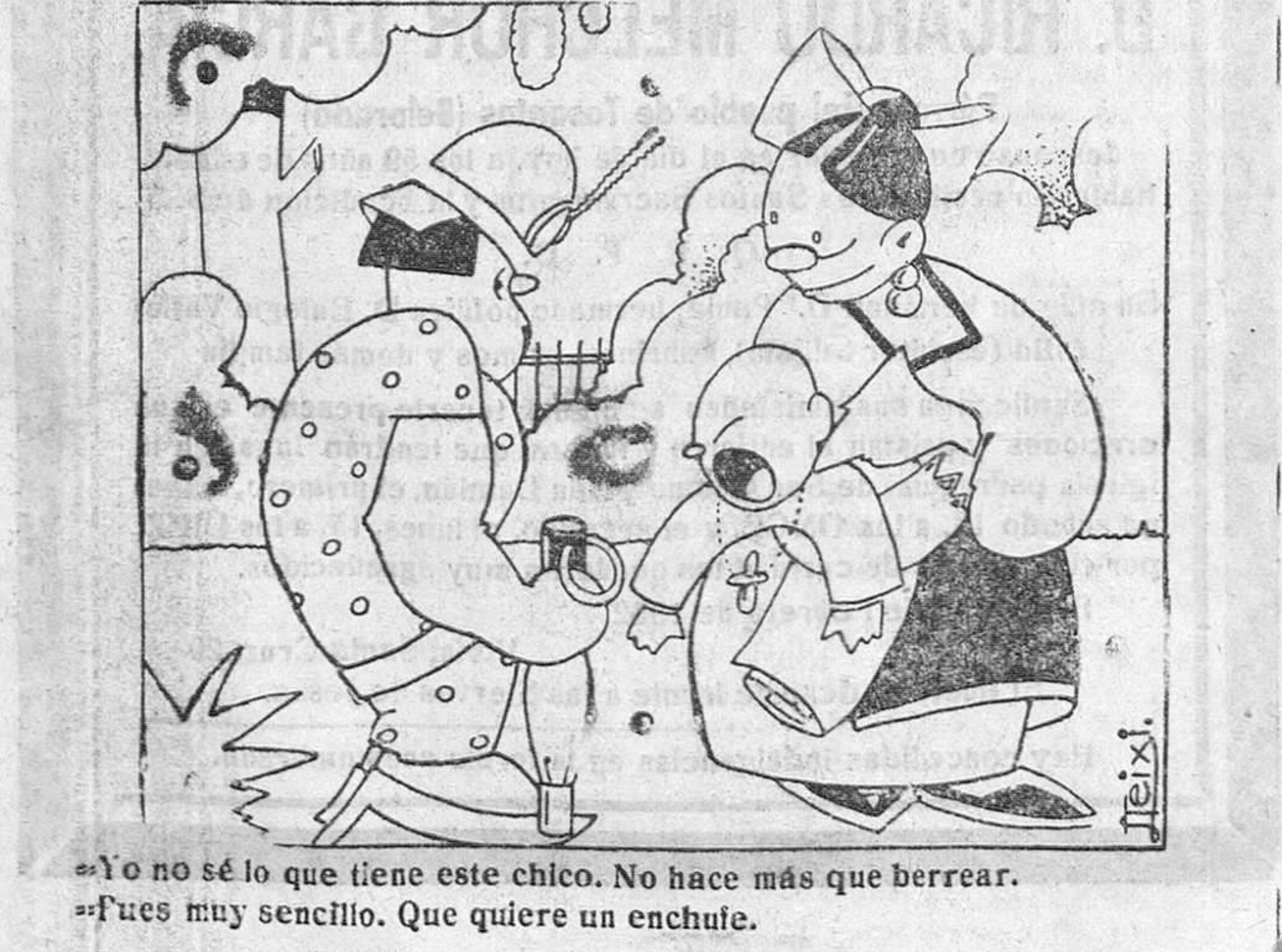
—Yo no sé lo que tiene este chico. No hace más que berrear. —Fues muy sencillo. Que quiere un enchufe.