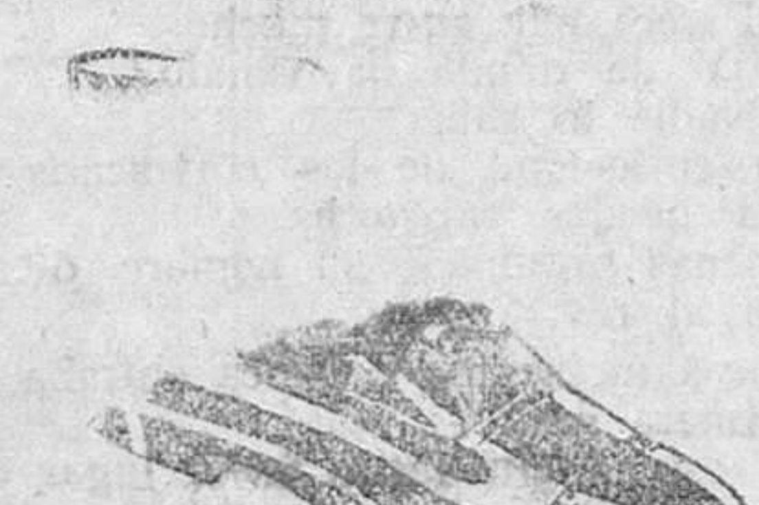
Botas en negro y color, todo cosido 19'50 pesetas