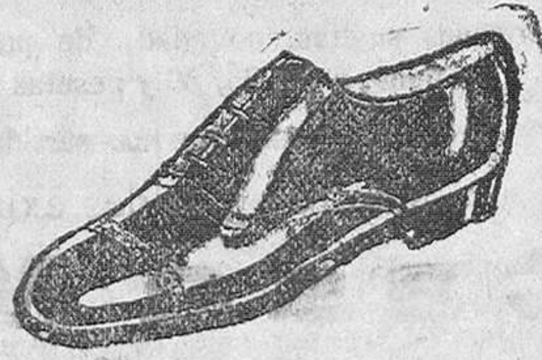
Zapatos en cinco colores distintos 18 pesetas Zapatos de charol 19'50 pesetas

Calzados SEGARRA Todo cosido "GOODYEAR" Venta directa del fabricante al consumidor