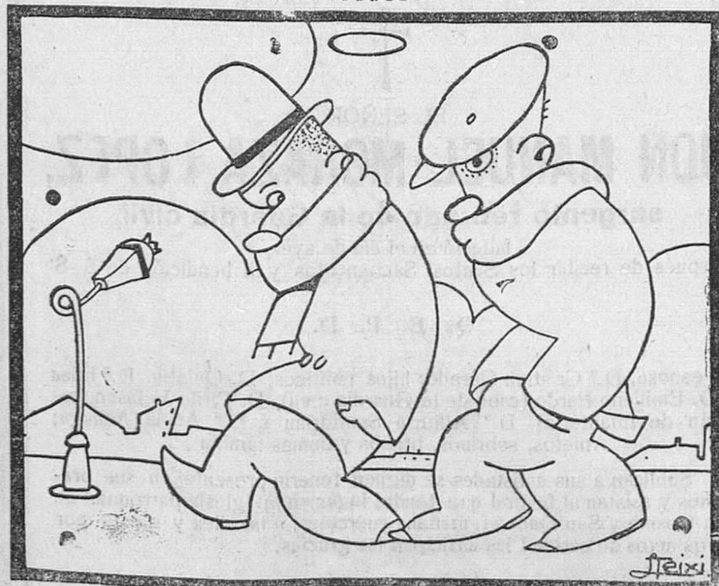
DIA DE COBRO

Recordar las luchas e inquietudes desplegadas desde su pueblito de partido de Belorado y termina ofreciéndose a todos.