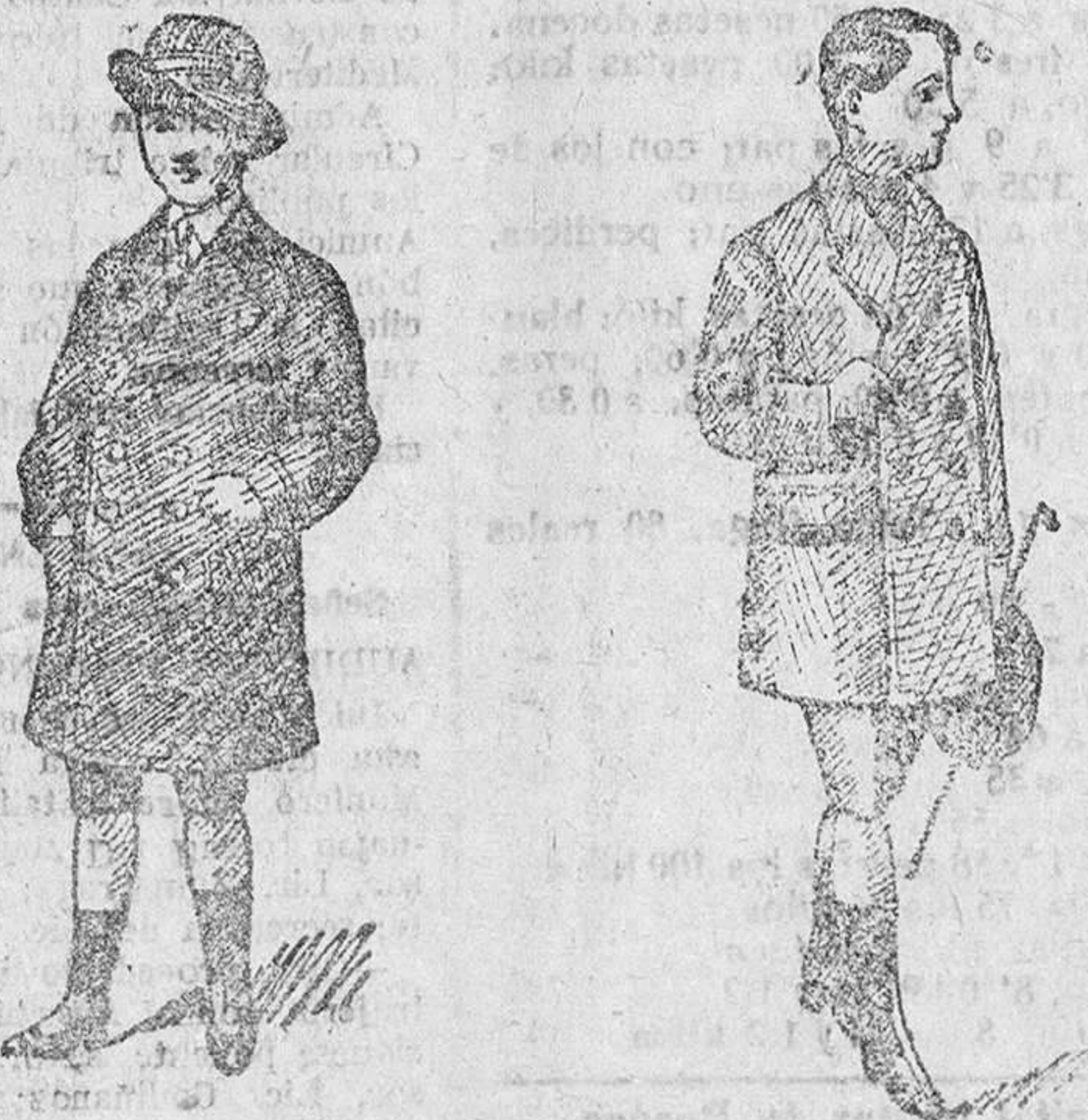
1.000 abrigos para niños, diversidad de modelos, a 16, 20 y 25 pesetas Precio fijo verdad. Todos los artículos marcados.

Gran fábrica de libros rayados y cajas de cartón