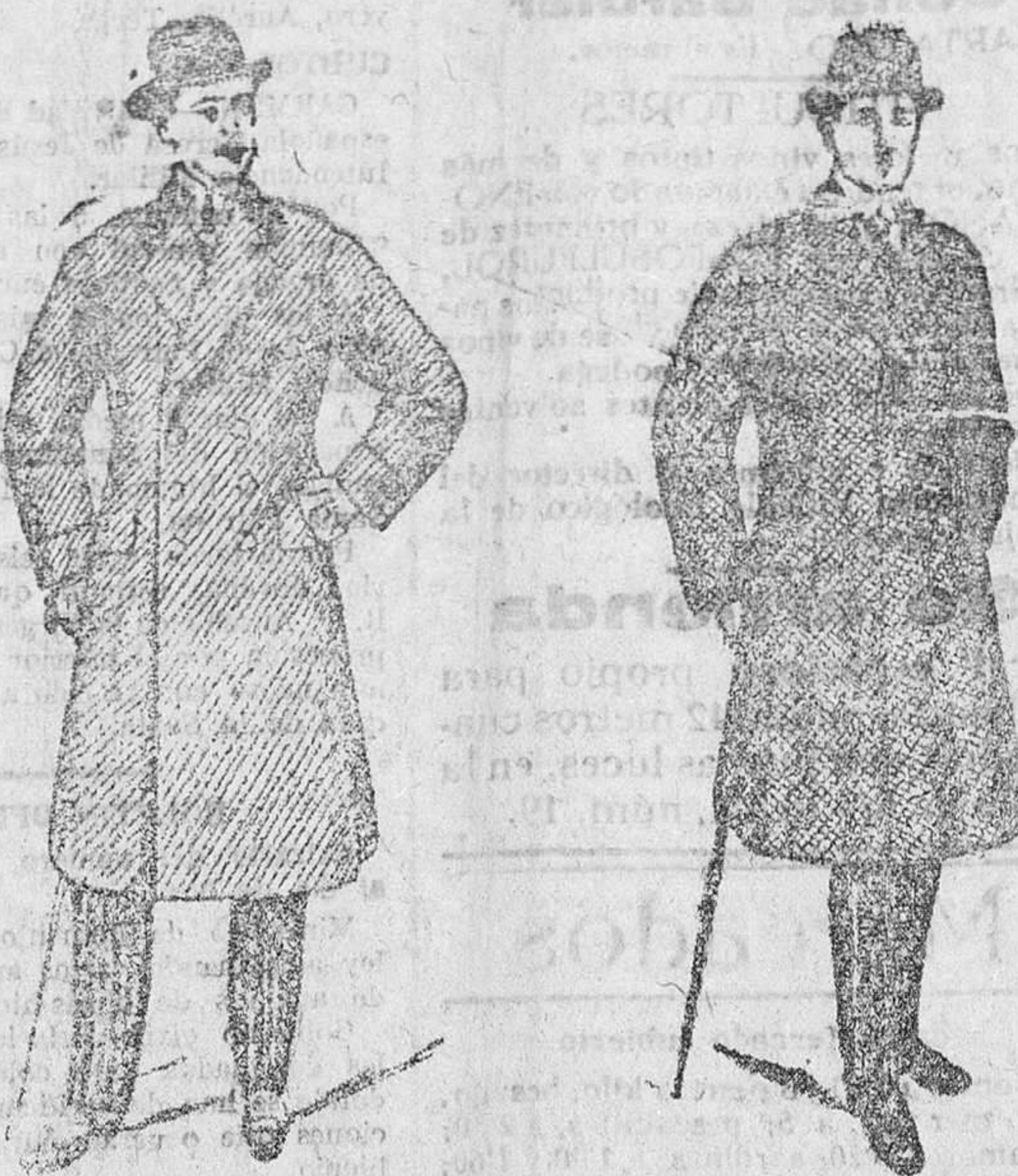
2.000 gabanes para caballero, a 40, 50, 60, 70, 90, 100 y 150 pesetas

Gran caja de tejidos, papelería y confeccionados de caballero, señora y niños