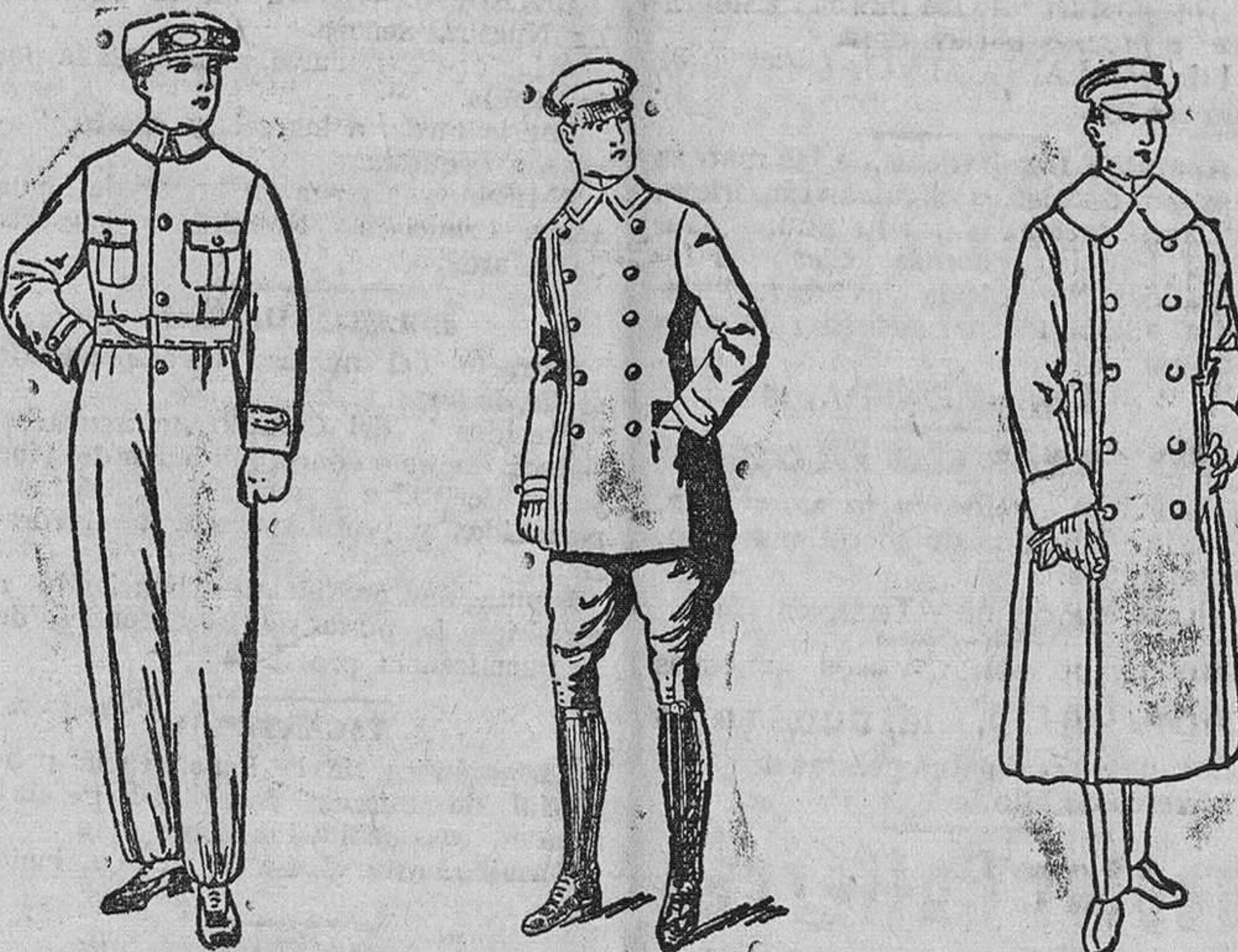
Buzos azules y kakís, desde 11 a 25 pesetas. Uniformes para señores, en dril, 40, 50 y 60 pts. Guardapolvos blancos, cuellos y puños azules, a 18, 20 y 22 pesetas.

Precio fijo verdad. Todos los artículos marcados.