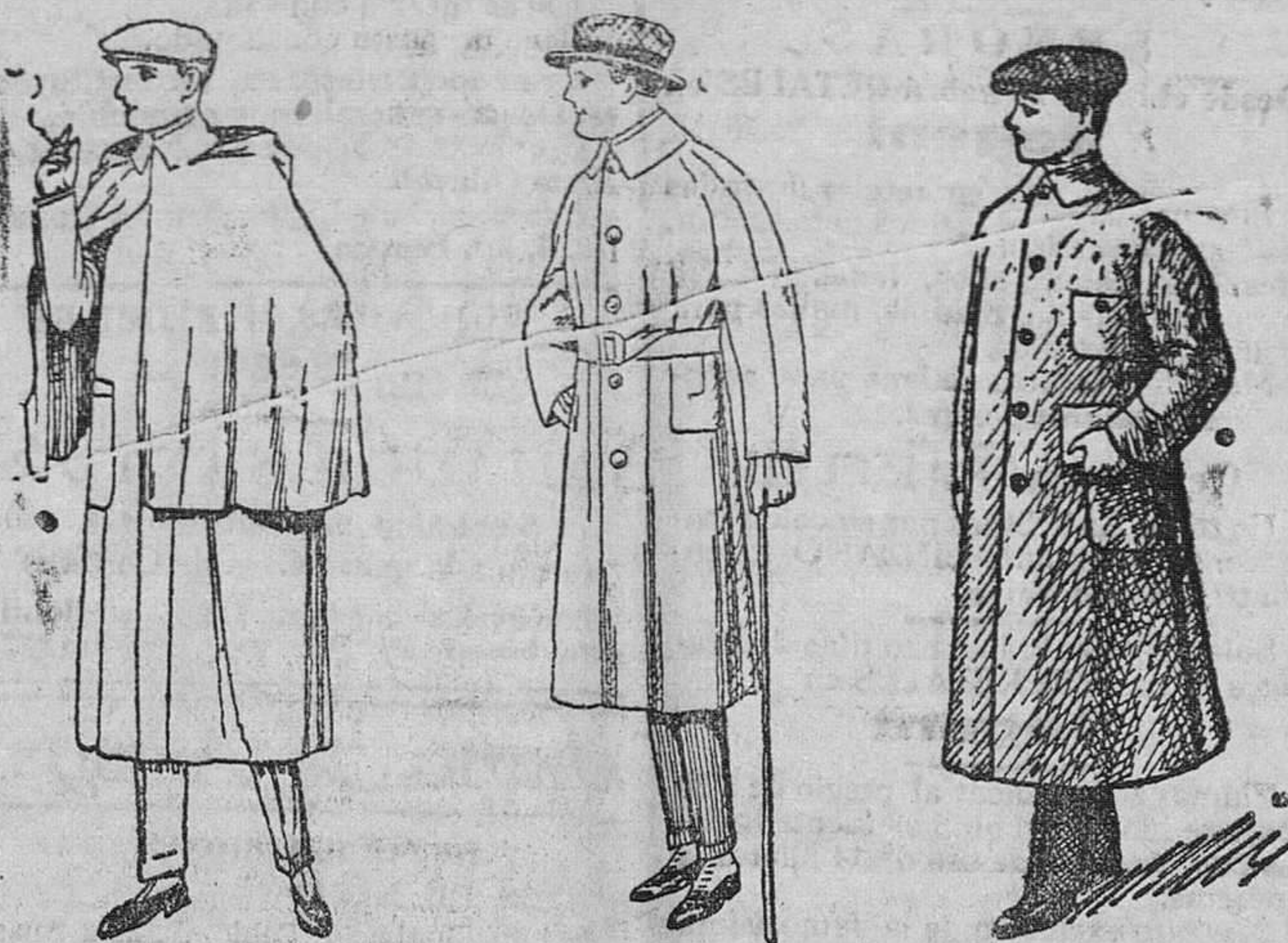
Impermeable a pesetas 100, 115 y 125. Trincheras novedad, a 85, 90 y 100 pesetas. Guardapolvos, de 7 a 25 pesetas.

Gran casa de tejidos, pañería y confecciones de caballero, señora y niños