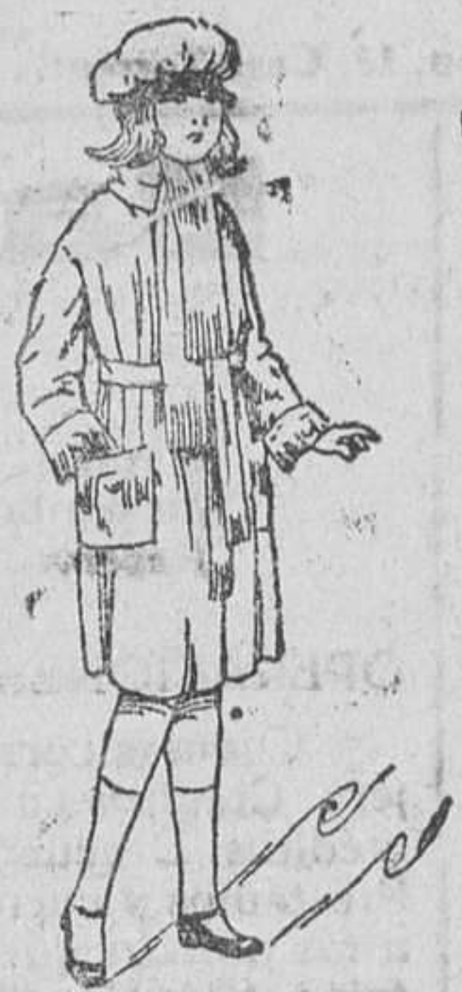
Abrigos de jovencitas, de 16 a 30 ptas.