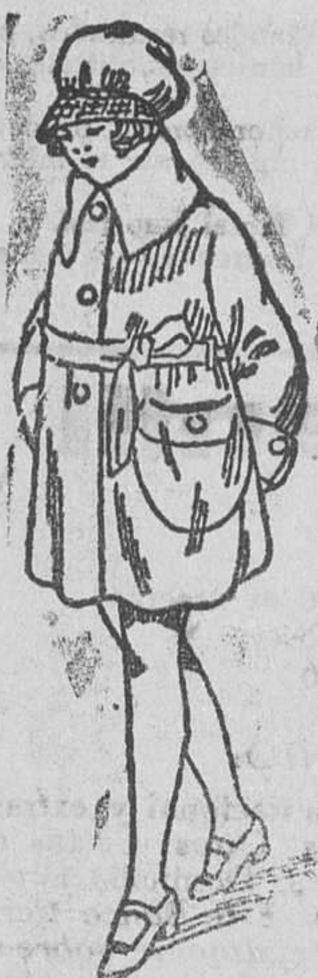
Abriguitos niña, tejidos novedad, a 10, 12, 15 y 20 pesetas

Gran casa de tejidos, pañería y confecciones de caballero, señora y niños