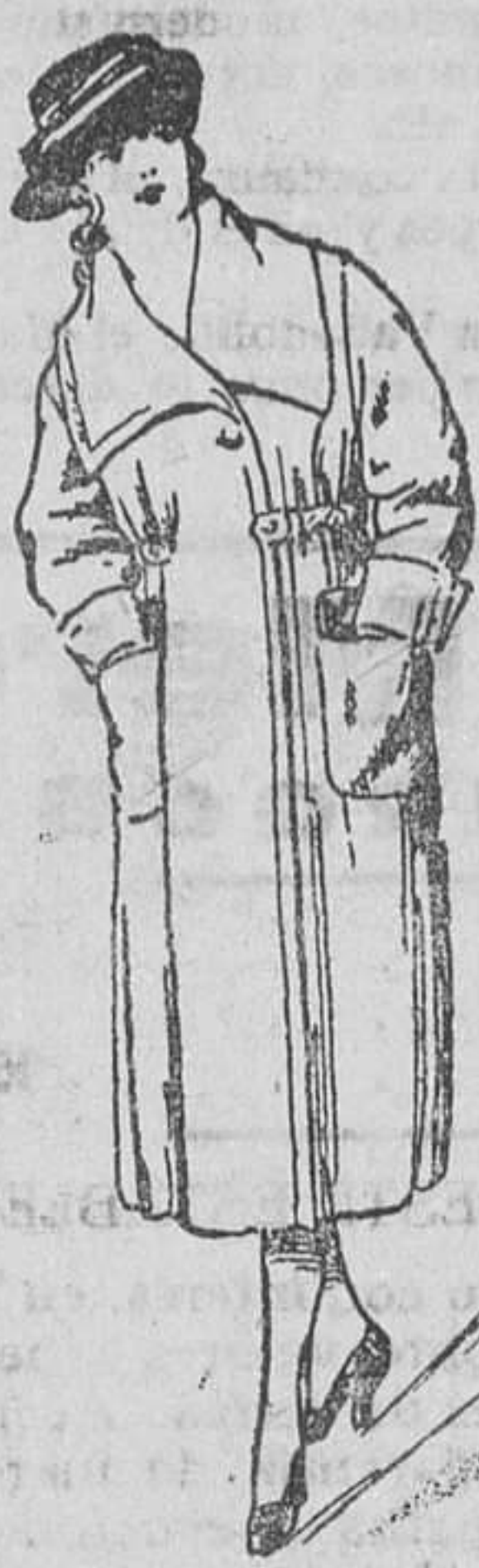
Abrigo de señora, paño novedad, a 30, 35, 40, 50 y 60 ptas.