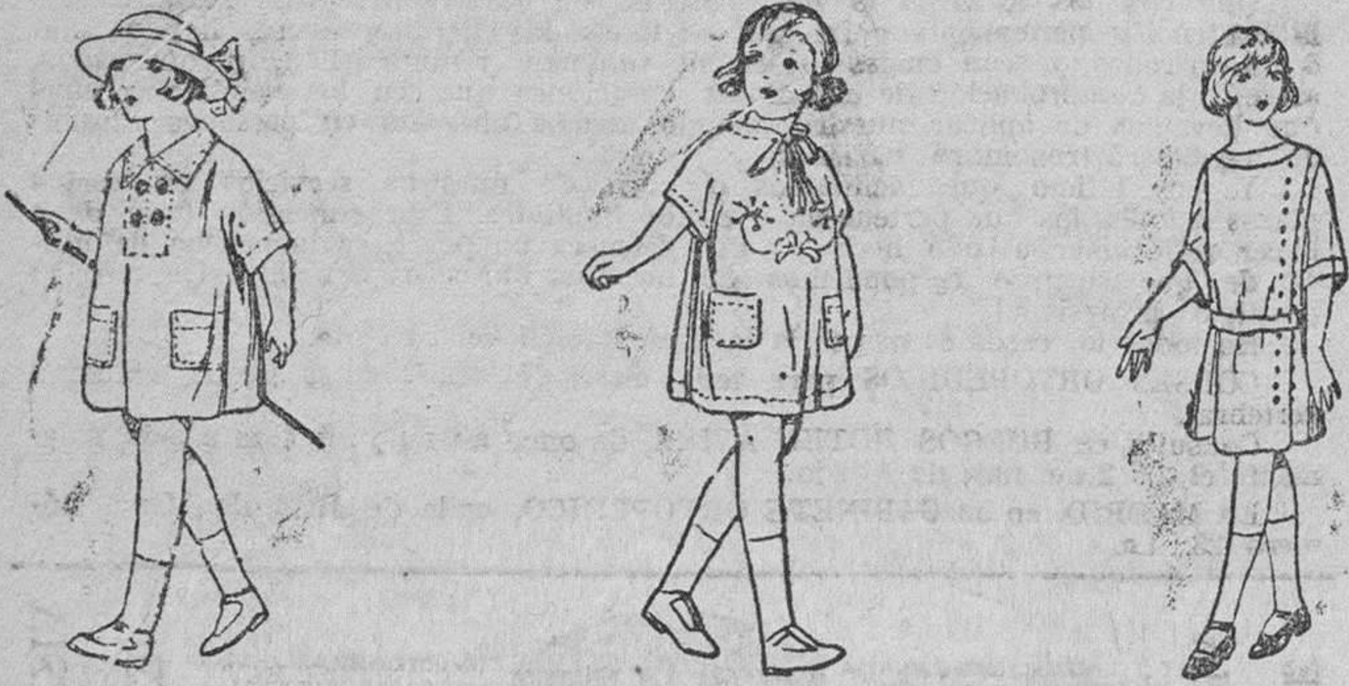
Diversidad de modelos en vestiditos de percal y batista, 2'50 a 10 pesetas.

Gran casa de tejidos, pañería y confecciones de caballero, señora y niños