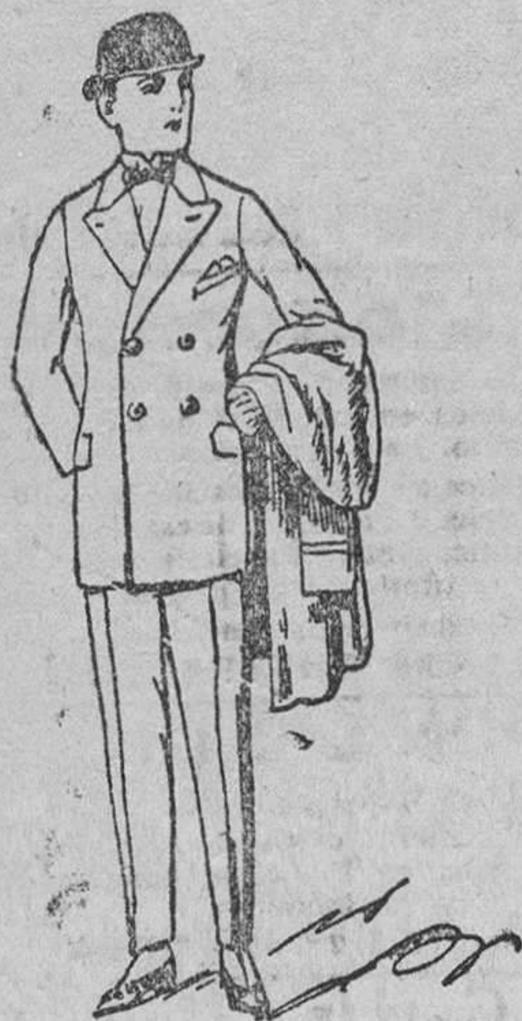
Trajes de paño melton, buena confección, a 40, 50, 60 y 70 pesetas Gabardinas, a 90 y 100 Precio fijo verdad.

Gran casa de tejidos, pañería y confecciones de caballero, señora y niños