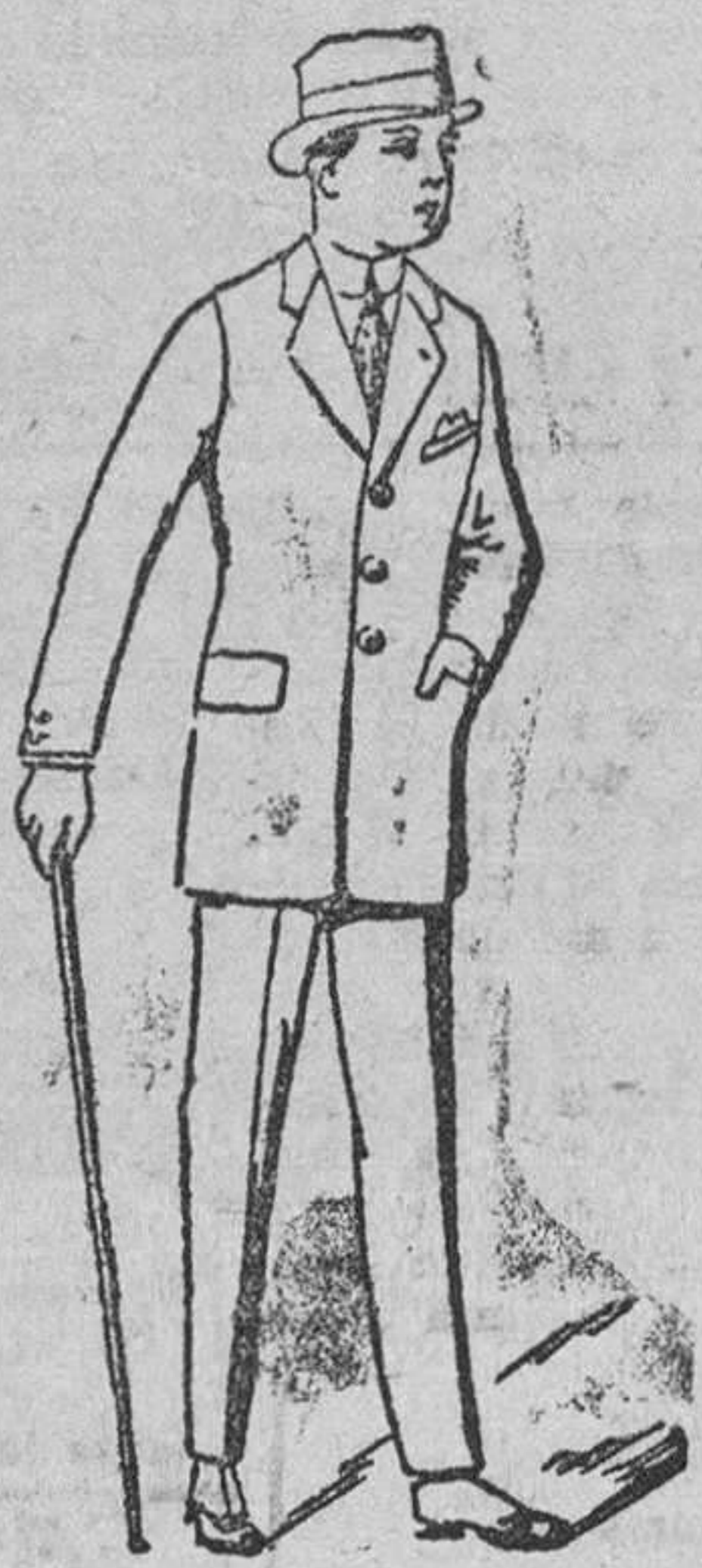
Trajes paño arrasado, corte especial, a 50, 60, 70, 80, 90 y 100 pesetas