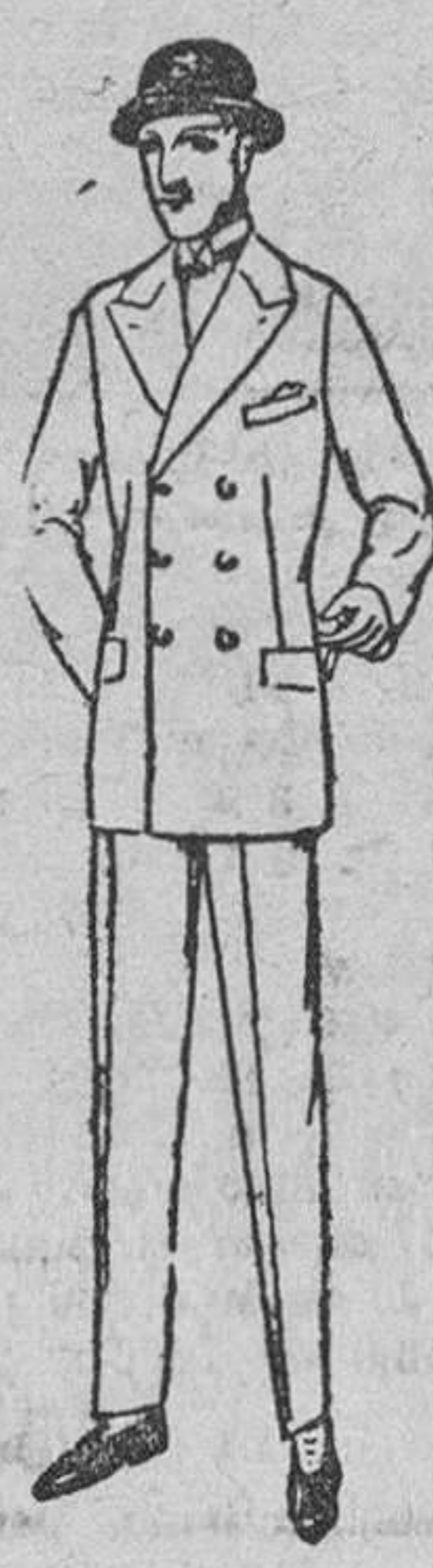
Trajes de juventido, corte especial, a 60, 70, 80, 90, 110 y 120 pts.