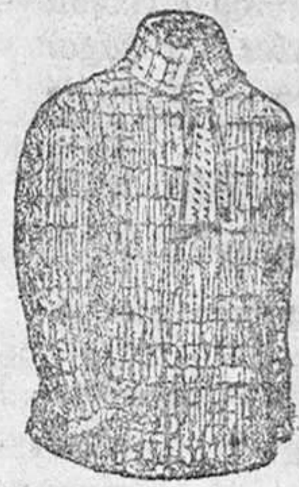
Gersy lana, á 9, 10, 12 y 15 pesetas. Gersy algodón, á 5, 6 y 7 pesetas.