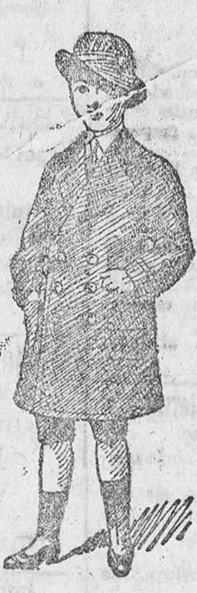
Abrigos de paño y de paño pluma, desde 15 á 50 pesetas.