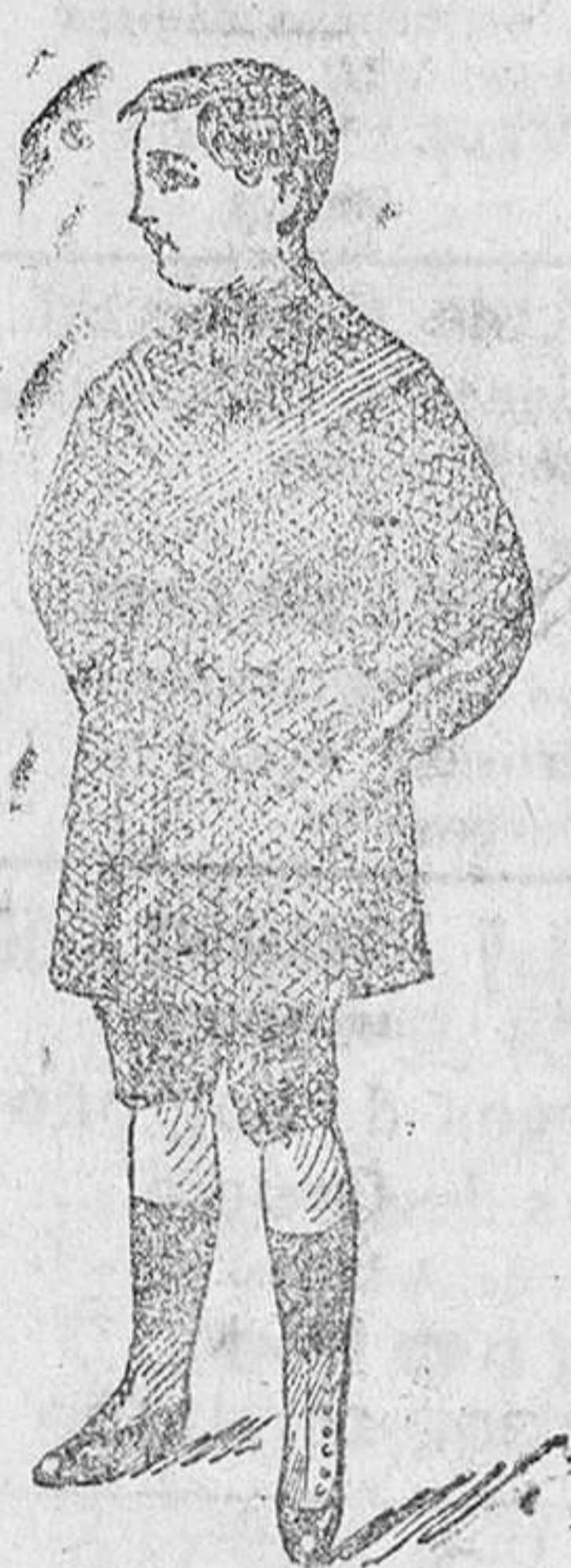
Matelo de vicuña y gerga, en azul marino, desde 15 á 50 pesetas.

Gran casa de tejidos, pañería y confecciones de caballero, señora y niños