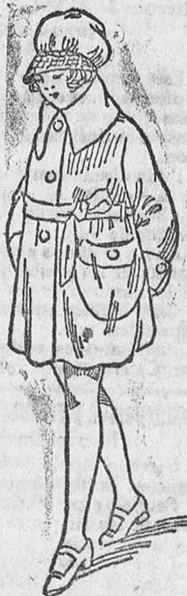
Abriguitos de gamuza para niñas, diversidad de modelos, de 9 á 50