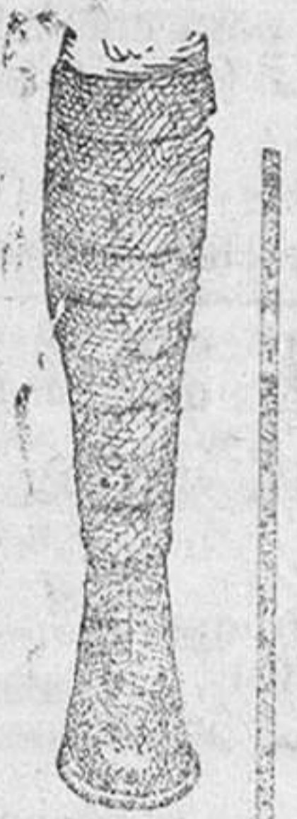
Bandas alpinistas, impermeabilizadas, á 5, 6 y 7 pesetas.