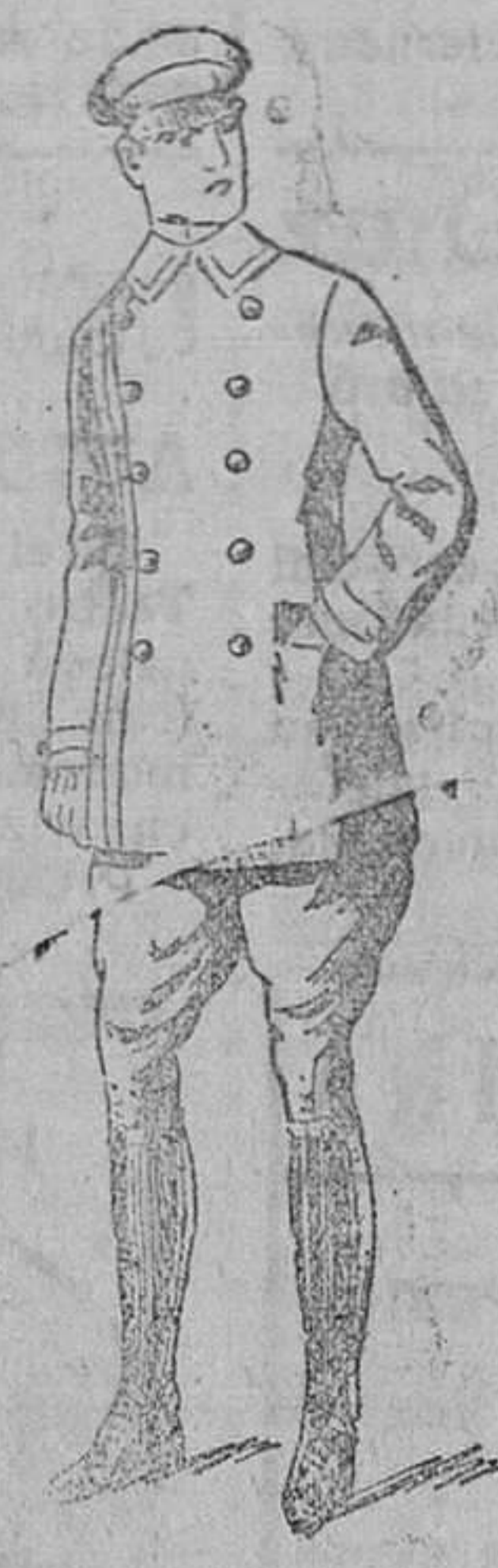
Trejes uniforme en paño y drill, desde 75 á 150 pts.