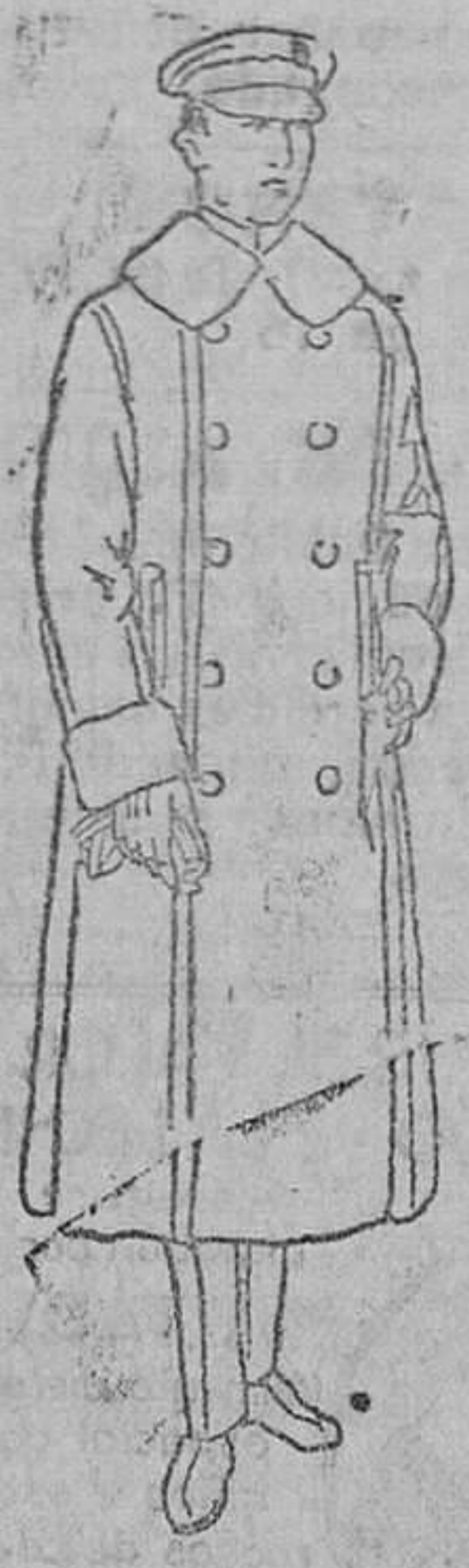
Guarda polvos blancos para sofer con cuello azul ó negro 22 y 25 pts.

Gran bazar de ropas confeccionadas de caballero, señora y niñas