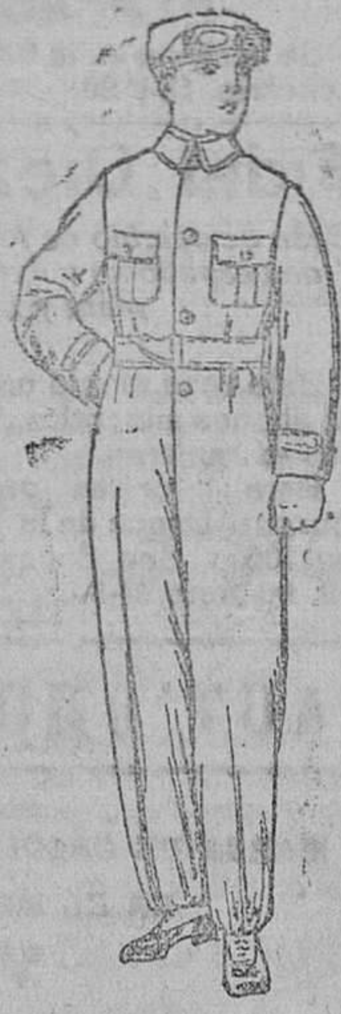
Enterizos azules y color koki desde 15 á 30 pts.