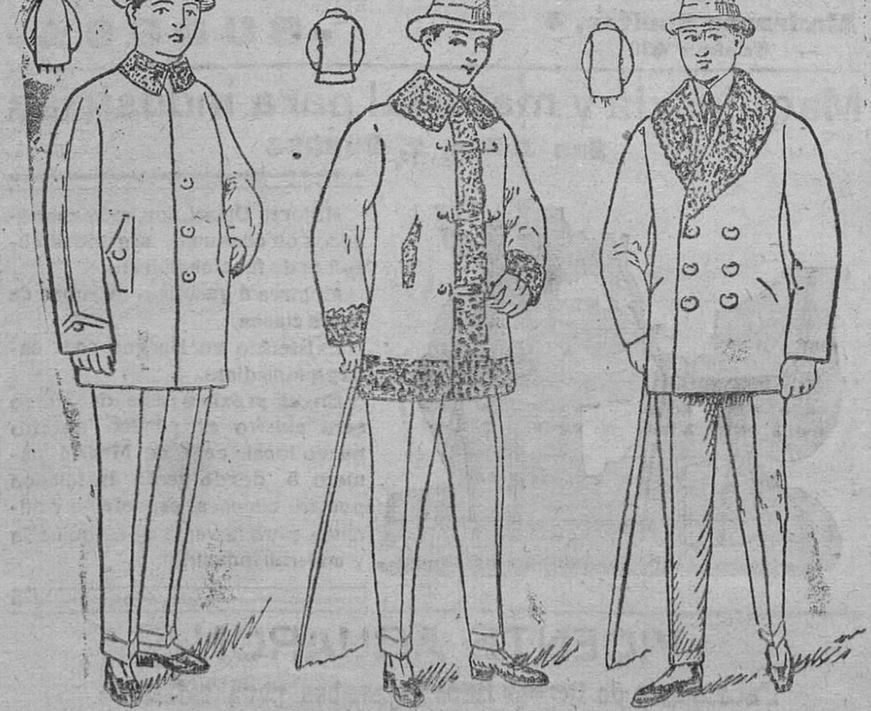
Pellizas con rizo al cuello, Pellizas con cuello alrede- 40, 65 y 40 pesetas. dor y bocanangas, á 50, 60 y 70 pesetas. Pelliza de cañor, cuello de rizo ó piel, á 45, 50, 60 y 70 pesetas. ma