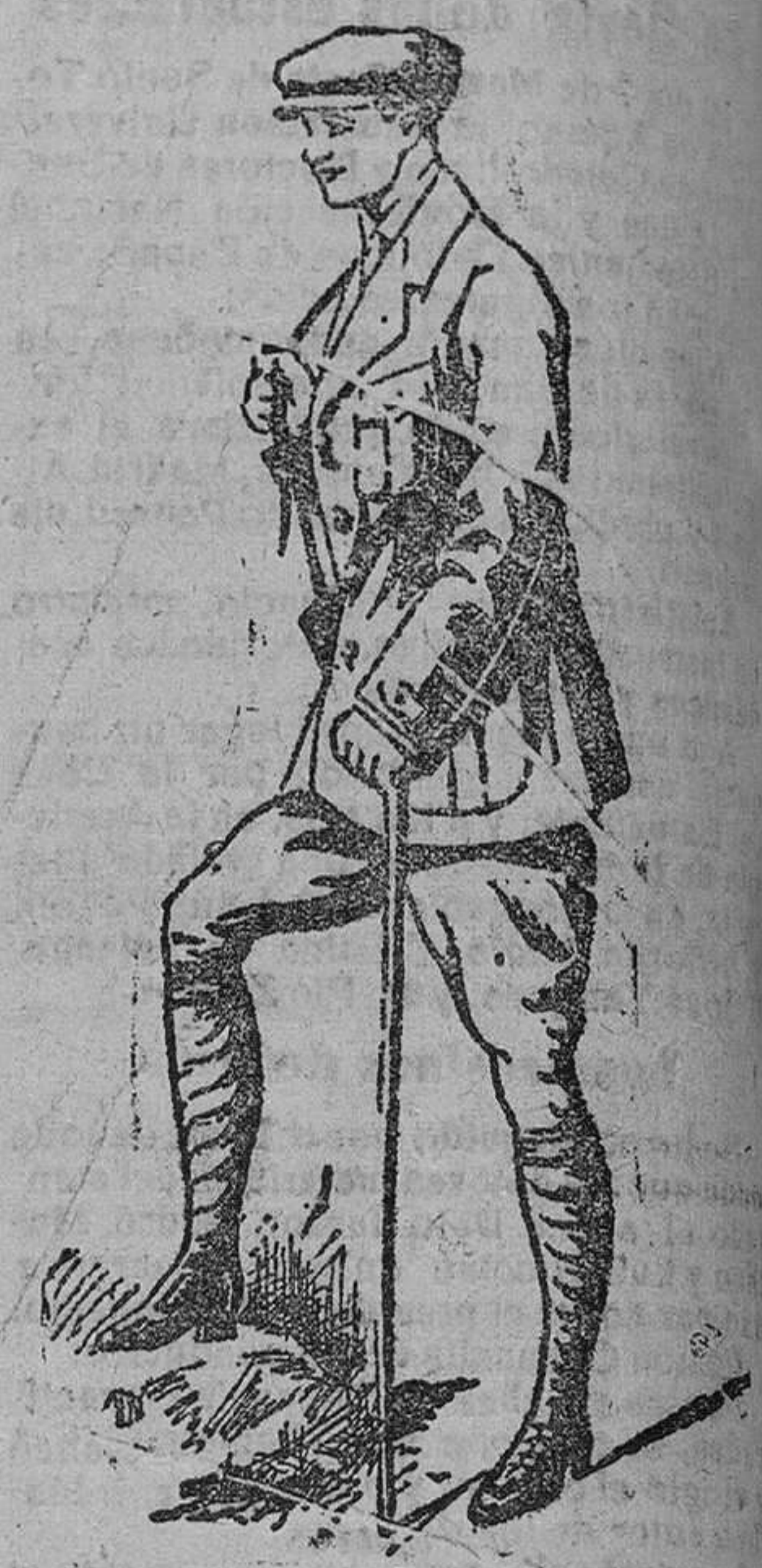
Trajes sport, en paño y pana, á 60, 70, 80, 90 y 100 pts.