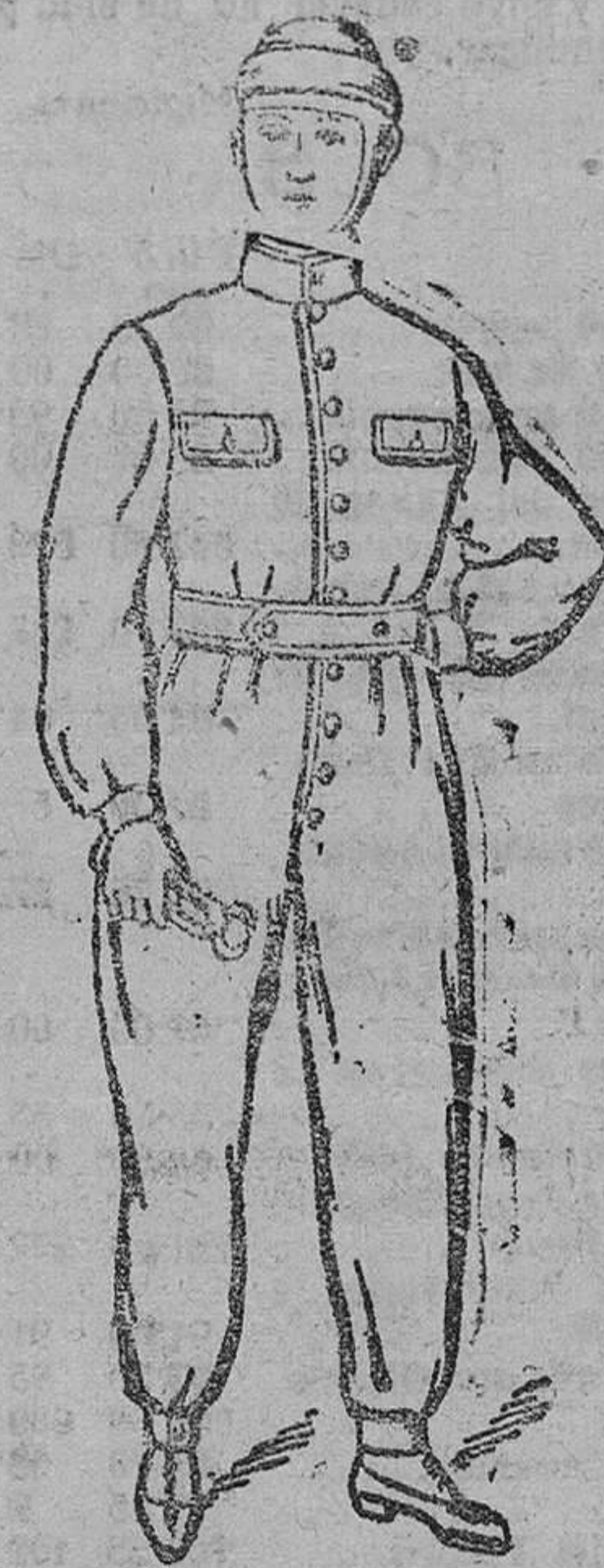
Enterizos azules y drill kaki á 15, 16, 18, 20 y 25 pts.

Primera casa en confecciones de caballero, señora, niños y niñas