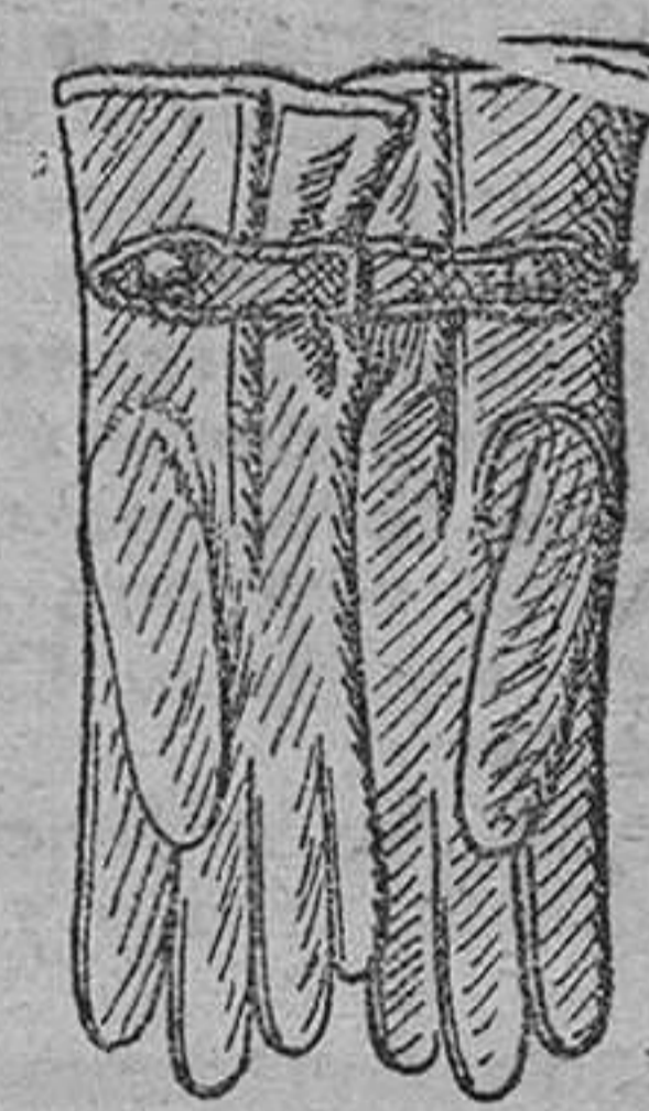
Gautes de piel, forrados de lana, á 7, 9 y 10 pts.