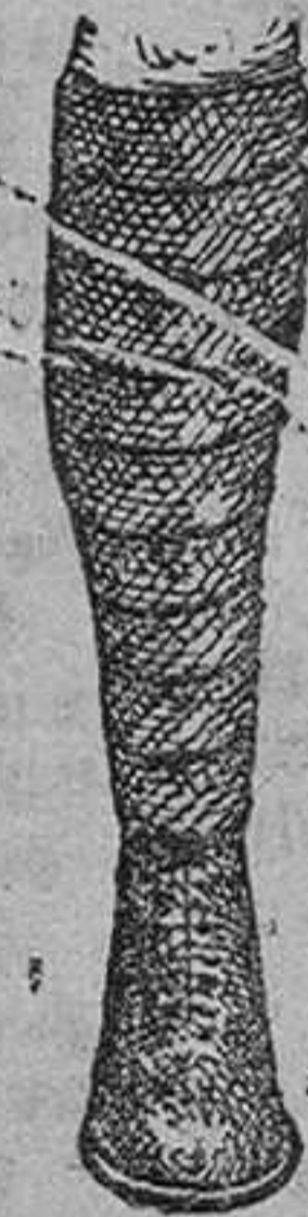
Bandas alpinistas á 7, 8 y 10 pts.