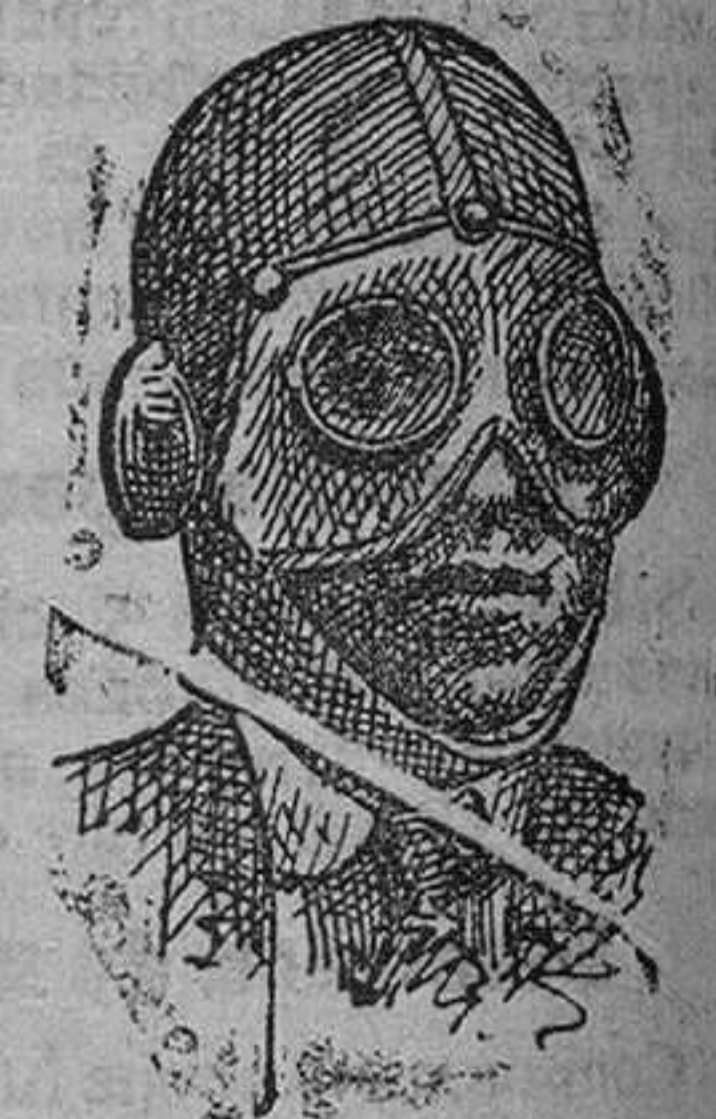
Pasamonafias de lana á 4 pts. Gafas á 4, 5 y 6, pts. 8