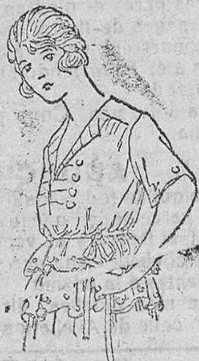
Jerseys lana, en colores novedad, á 15, 18, 20 y 25 pts.