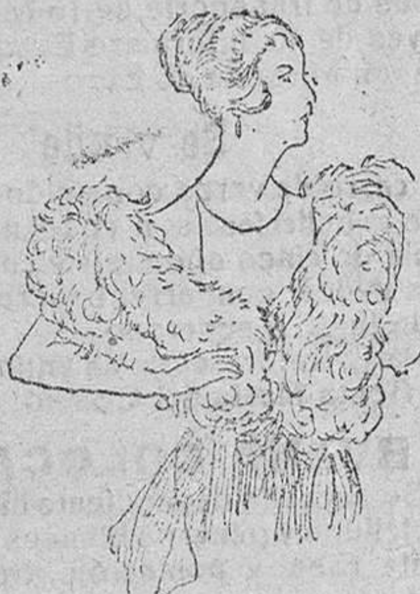
Cuellos de pluma, desde 25 á 65 pts.