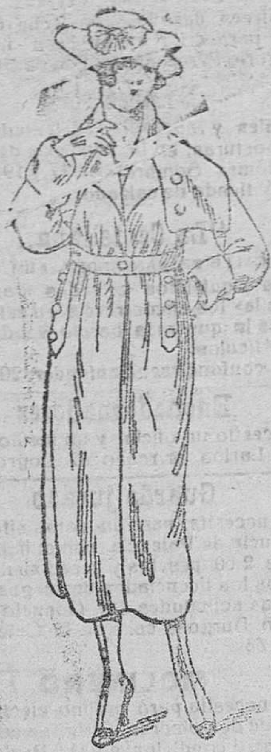
Abrigos novedad, en gamuza, desde 35 á 150 pts.

Primera casa en confecciones de caballero, señora, niño y niña