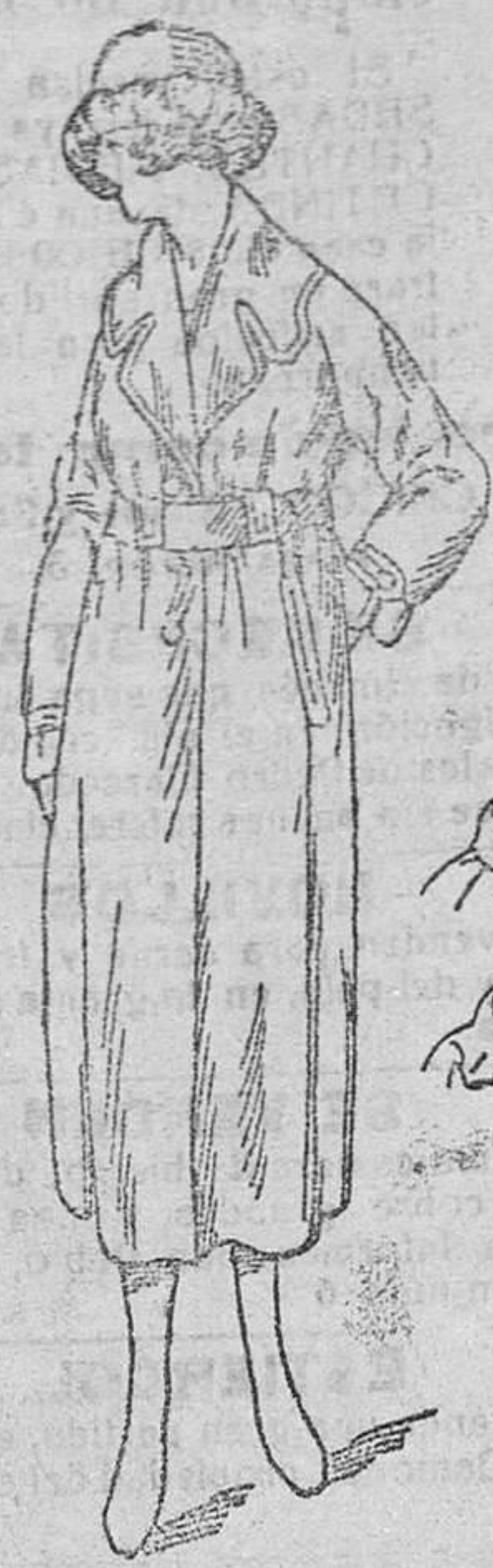
Gabardines señera, desde 100 á 140 pts