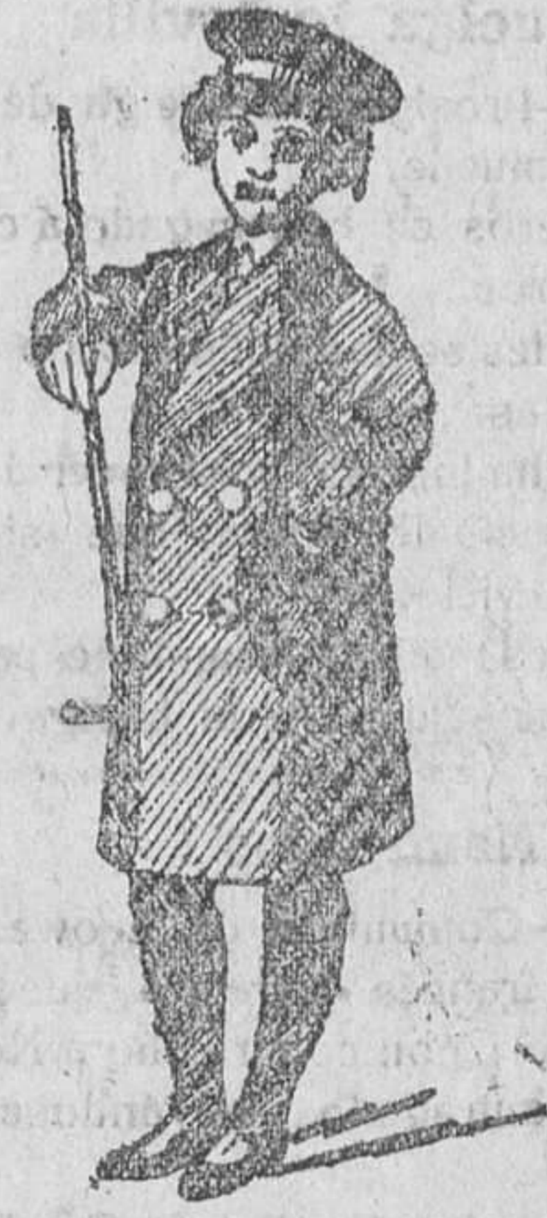
Matelos y gabancitos para niños, de ptas. 12 á 40.

50 modelos diferentes en trajecitos de paño y pana para niños