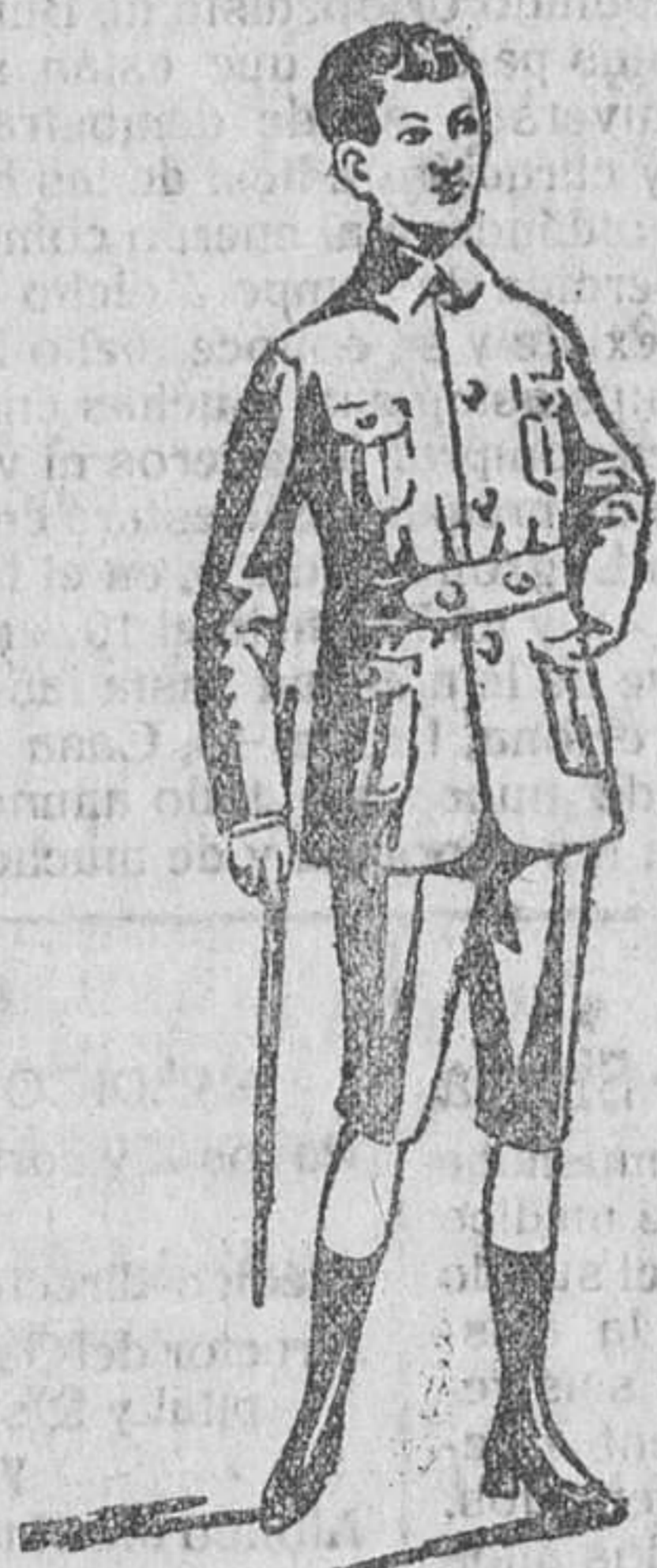
Trajecitos sport, en paño y pana

Trajes para jovencitos, en paño y pana, á precios muy baratos.