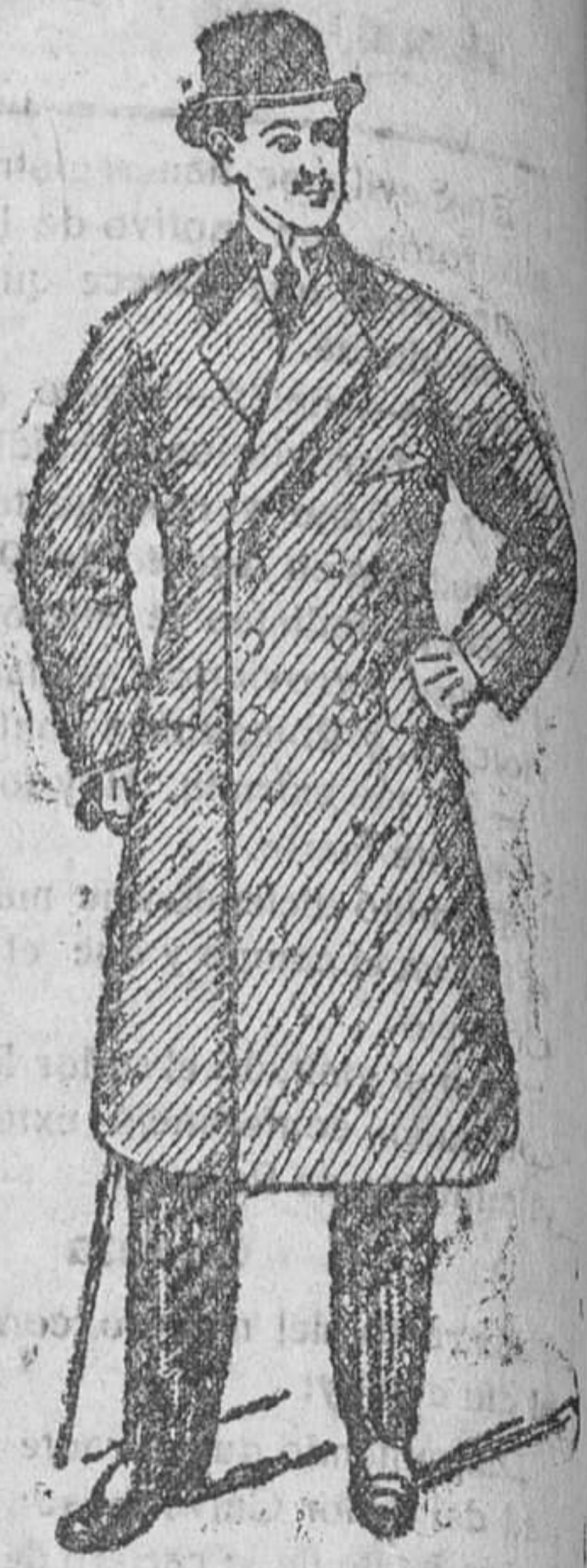
Gabanes decaído pesetas 30 á 125

En forma entallada, hay seis modelos diferentes, á 80 ptas.