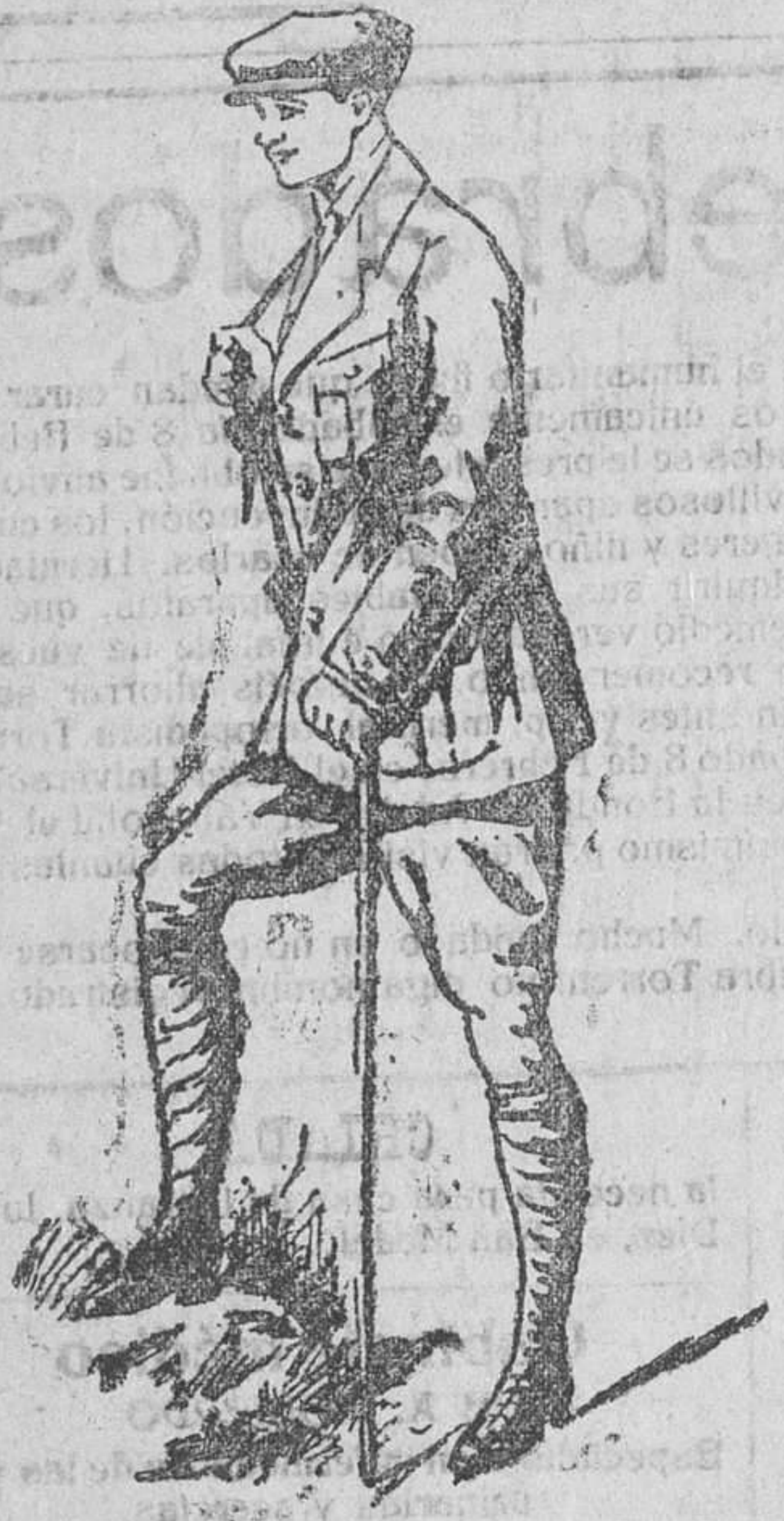
Traje sport, en paño y pana

Única casa que presenta grandes surtidos en tejidos y ropas confeccionadas de caballero, señora y niños