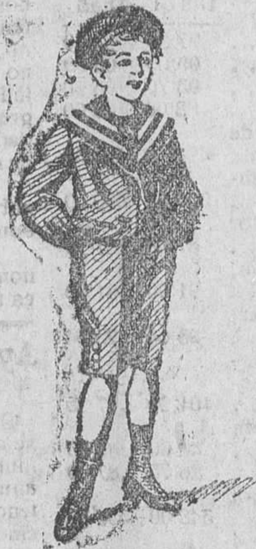
Trajecitos en paño, pana, gerga y drill

Abrigos niña, con cuellos piel, á 15 y 25 pesetas.