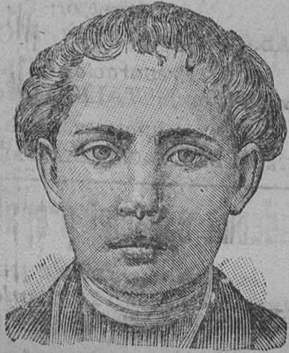
A los 15 días de tratamiento.