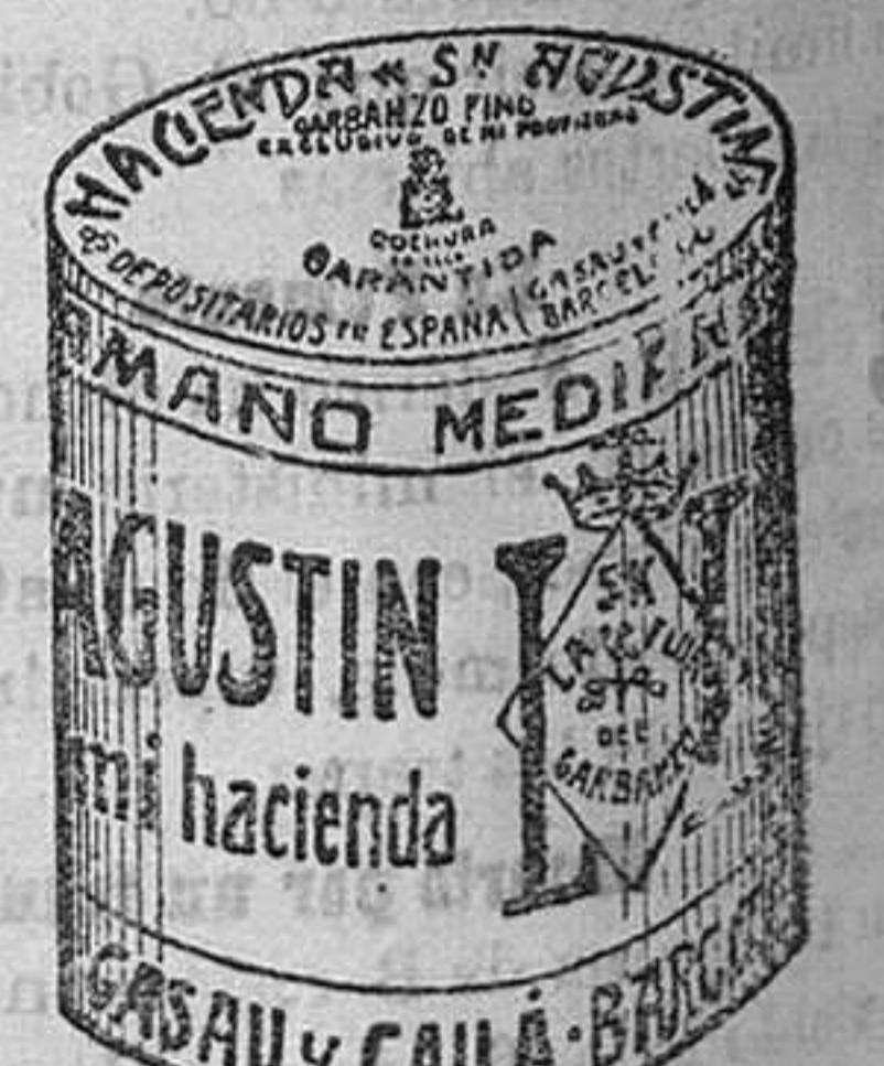
Garbanzo Sauco (5 Kilos)