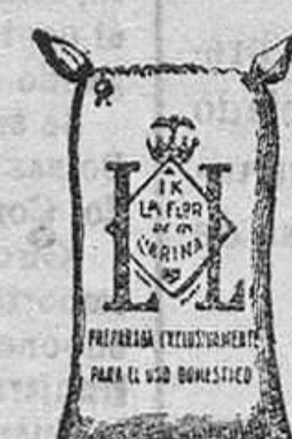
Harina Frappe (1 Kilo)