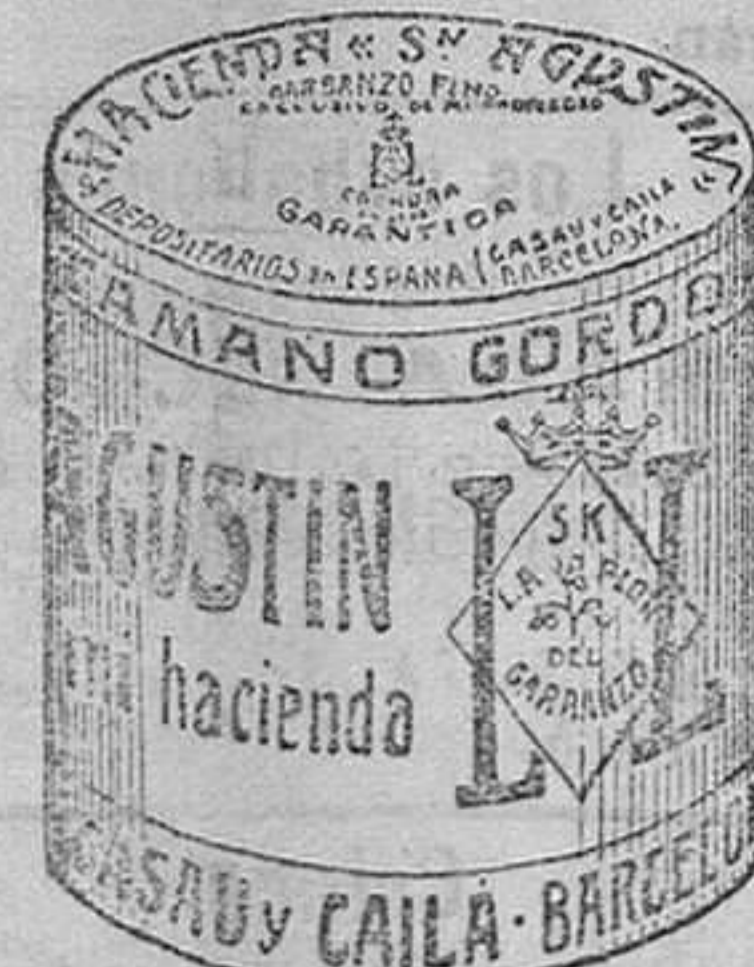
Garbanzo Sauco (5 Kilos)

Compañía Anónima de los legítimos Motores Otto.