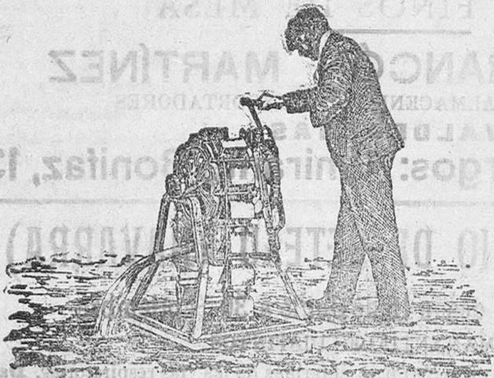
Noria de mano

Los construye de los sistemas más modernos, á precios económicos, Felix Callejo, en Sotillo de la Ribera.